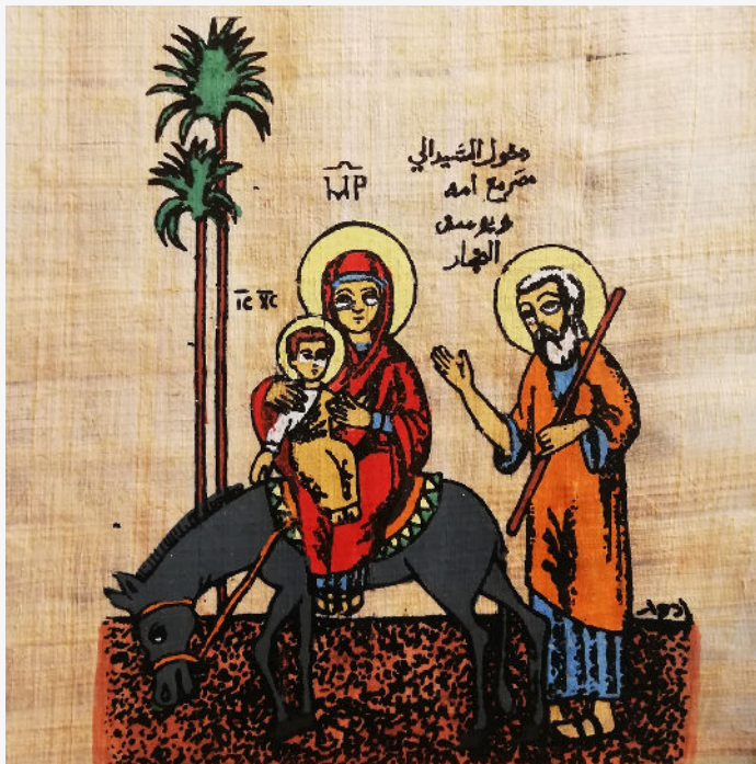
Jésus, en premier lieu, demeura en Egypte ! (papyrus copte)