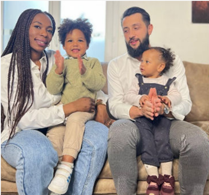
La famille au complet