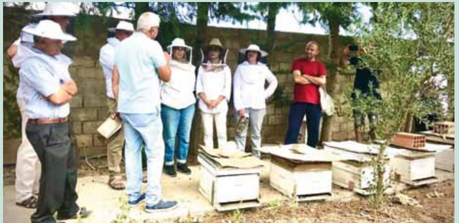
Formation à l'apiculture ATAE-AAG Tunisie

mêmes dispositions. Le « maintien sur place » doit tenir compte des réalités vécues par les volontaires (crainte de la crise sanitaire voire sécuritaire, arrêt des activités, crainte envers le système de santé local, raréfaction des vols ...).