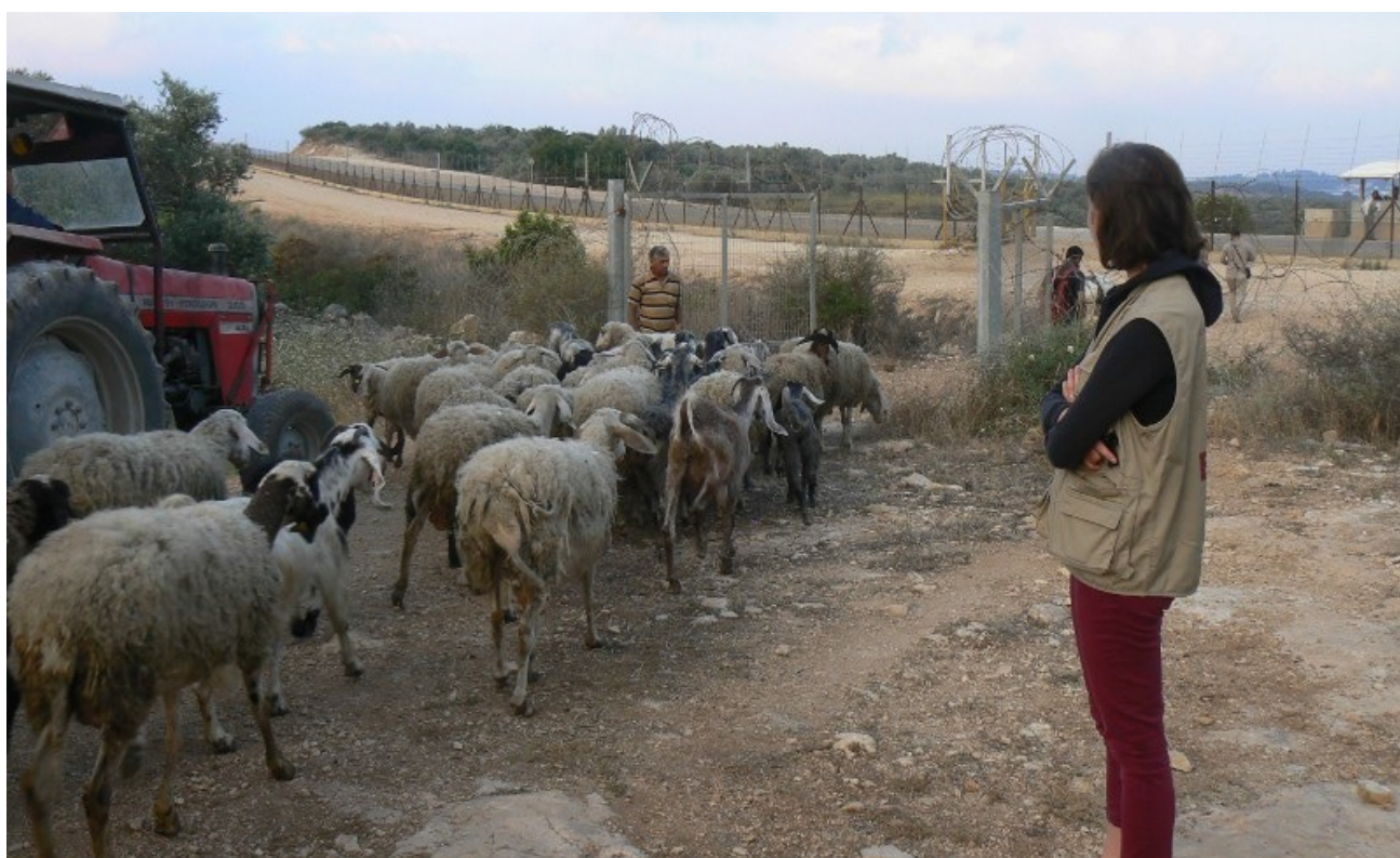
Colonie, en haute vallée du Jourdain

La foule se presse au terminal de Qalandia. J'effectue un comptage au terminal pour les hommes. Plusieurs dizaines de milliers de personnes vont le traverser entre 5h du matin et midi. Quelques-uns sont refoulés, permis non valable, pas dans la tranche d'âge autorisée. C'est un vendredi pendant le Ramadan. L'accès y est facilité pour que les musulmans puissent aller prier à Jérusalem à la mosquée Al-Aqsa, accès autorisé pour les femmes de tout âge, les enfants de moins de