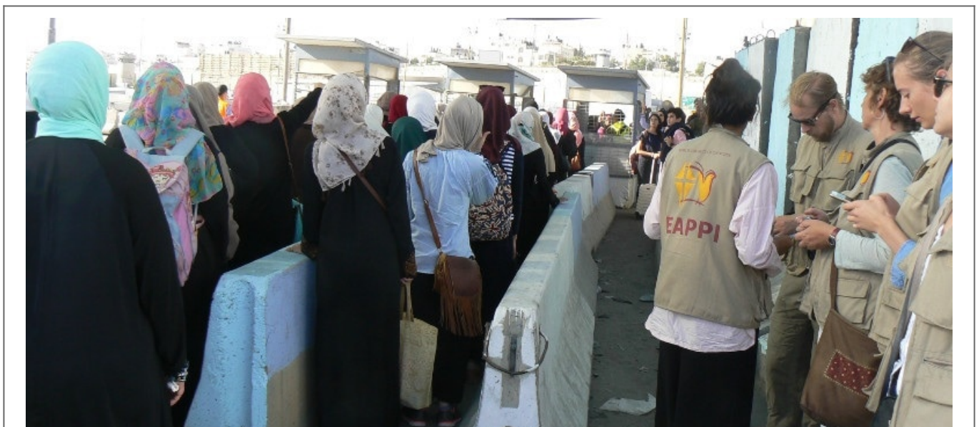
Terminal de Qalandia, file des femmes

Les terminaux de Qalandia (Ramallah) et Gilo 300 (Bethléem) sont les principaux points d'entrées à Jérusalem. Mais il y a de nombreux checkpoints en Cisjordanie, soit fixes soit mobiles, pour entraver la libre circulation des Palestiniens. À l'entrée de nombreux villages, on trouve une barrière jaune, et souvent un poste de contrôle. En période calme, l'accès n'est pas contrôlé. Mais il peut l'être à tout moment.