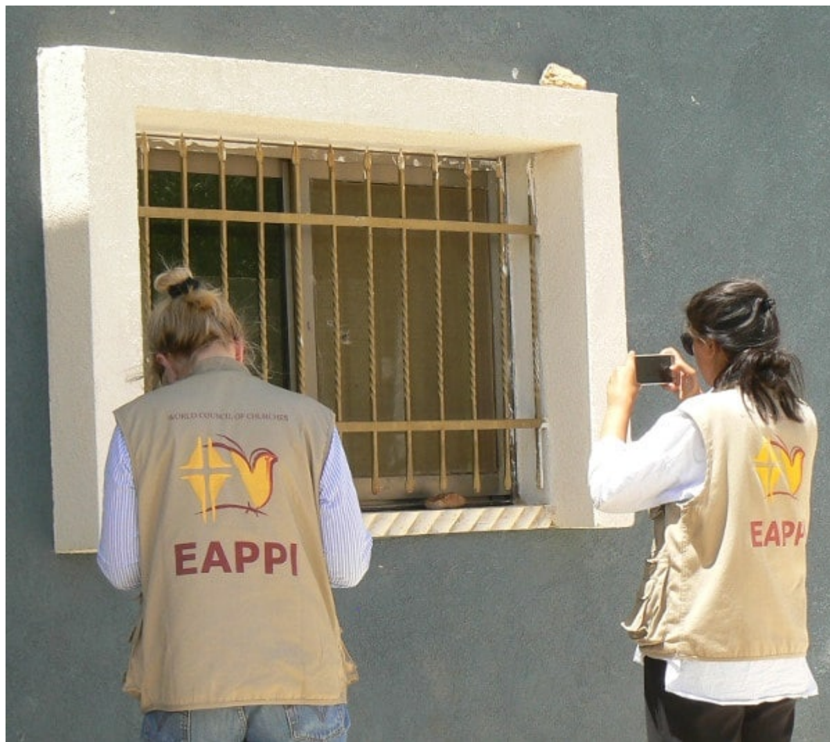
Des pierres jetées contre la fenêtre

Ce dimanche matin, nous roulons vers Ramallah, pour assister à