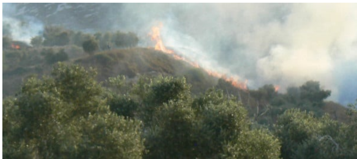
Le feu dans les terres de Burin sous la colonie Yizhar