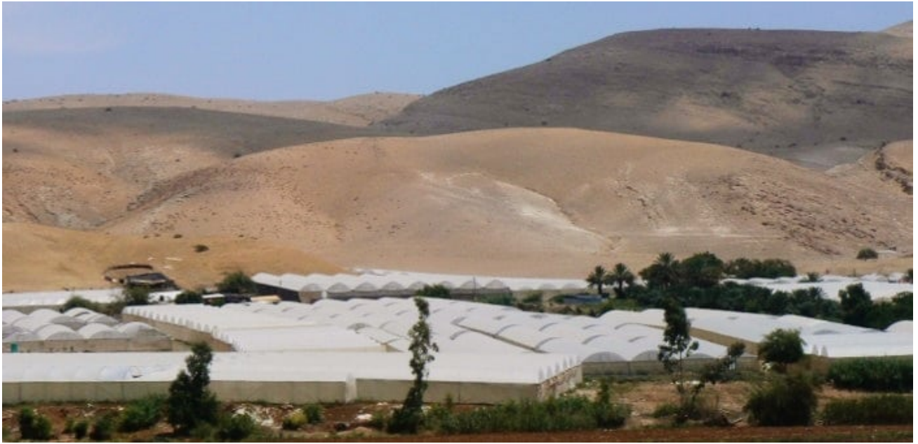
Passage dans une porte agricole

Il est 6h du matin. Quelques fermiers se pressent devant la grille, un tracteur, deux troupeaux de moutons. Nous sommes devant une porte agricole, dans la région de Tulkarem, au nord ouest de la Cisjordanie. Les fermiers attendent l'ouverture de la porte dans le mur de séparation entre Israël et la Palestine. Le mur en zone non urbaine est en fait une grille munie de nombreux détecteurs. Leurs terres se trouvent dans la « seam zone », une zone de non-droit entre le mur de séparation et la ligne verte, frontière reconnue de l'État d'Israël. La porte est ouverte une demi-heure le matin, vers 6h, et une demi-heure l'après-midi, pour le retour des fermiers. Ils ont besoin d'un permis pour se rendre sur leurs terres, permis accordé pour l'accès à une seule porte agricole.