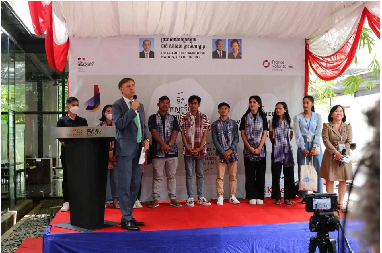
La Journée du volontariat français au Cambodge