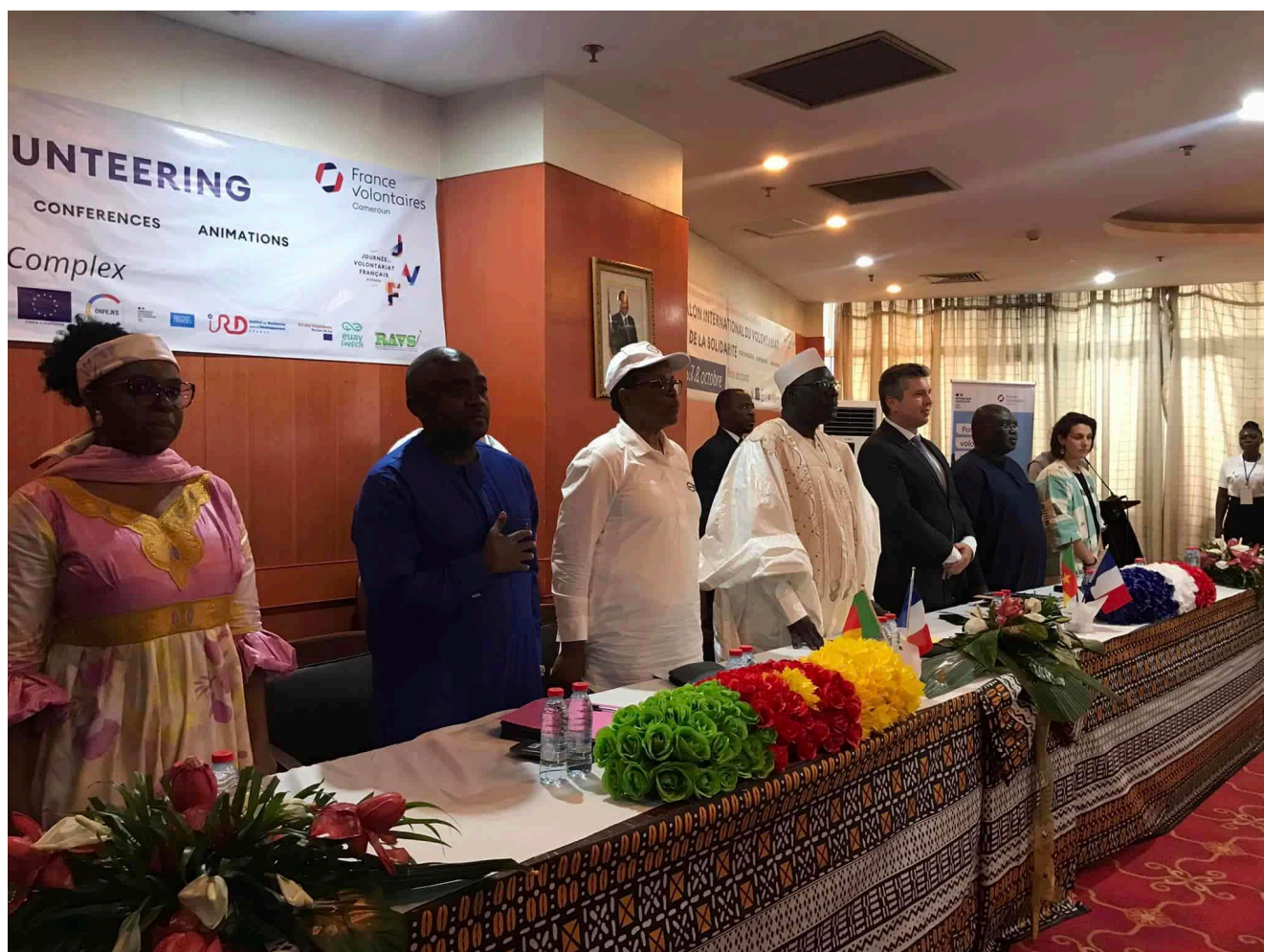
La Journée du volontariat français au Cameroun

qui célébrera les 50 ans de France Volontaires dans le pays, et en Tunisie le 28 octobre. Avec des thématiques mises à l'honneur comme le rôle des volontaires dans la lutte contre le changement climatique, la réciprocité, et de manière générale leur action au quotidien en faveur d'un monde plus juste et plus solidaire.