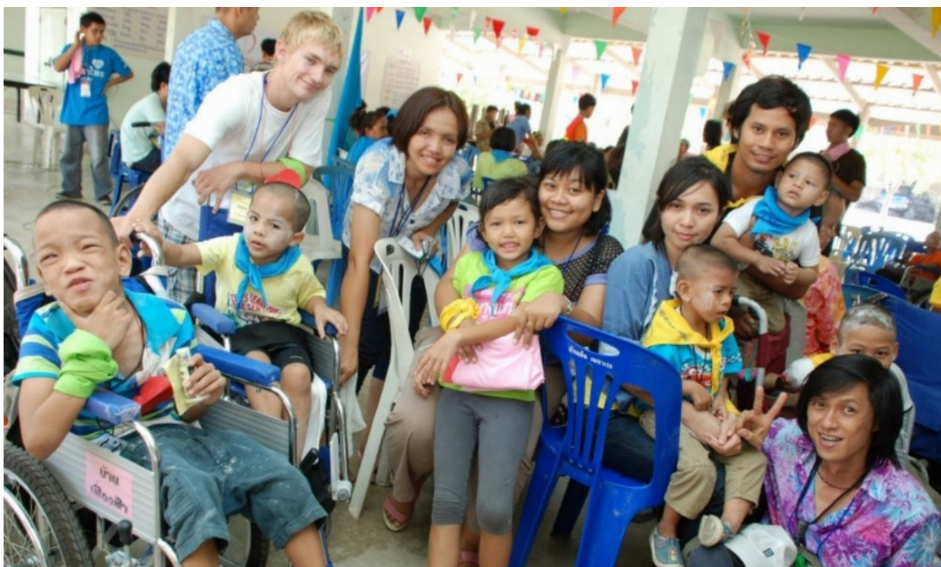
Quelques-uns des pensionnaires de l'orphelinat