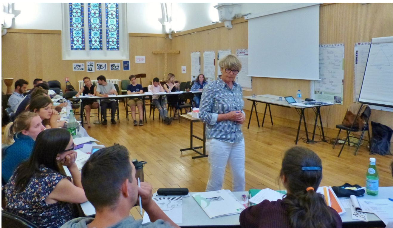
Vue de la session 2019 de la formation des envoyés du Défap