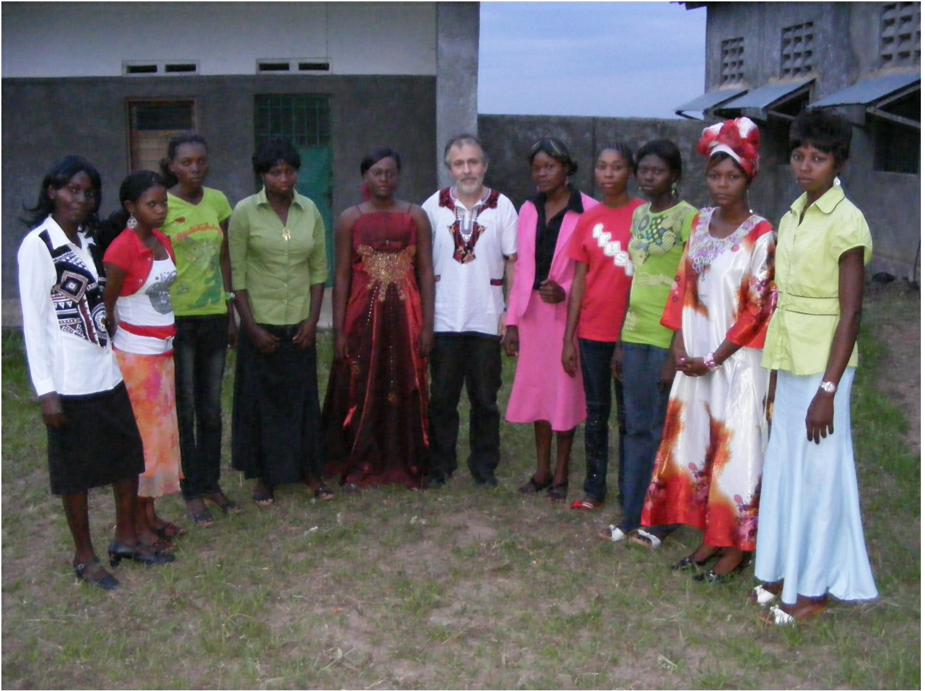
Étudiantes de l'UPRECO