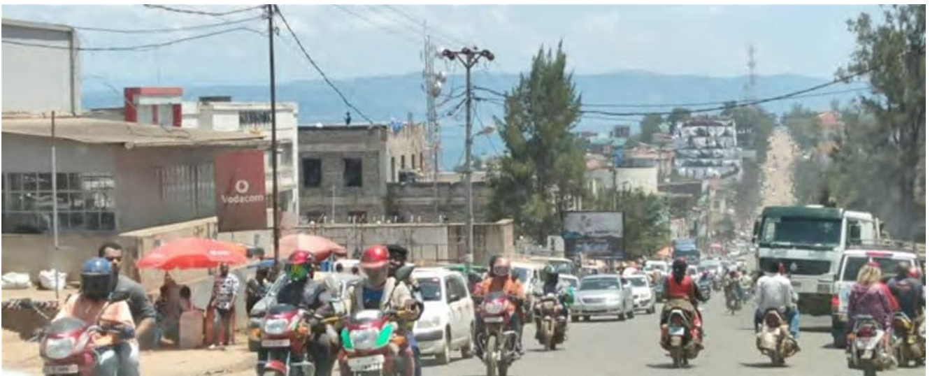
Vue d'une rue à Kinshasa