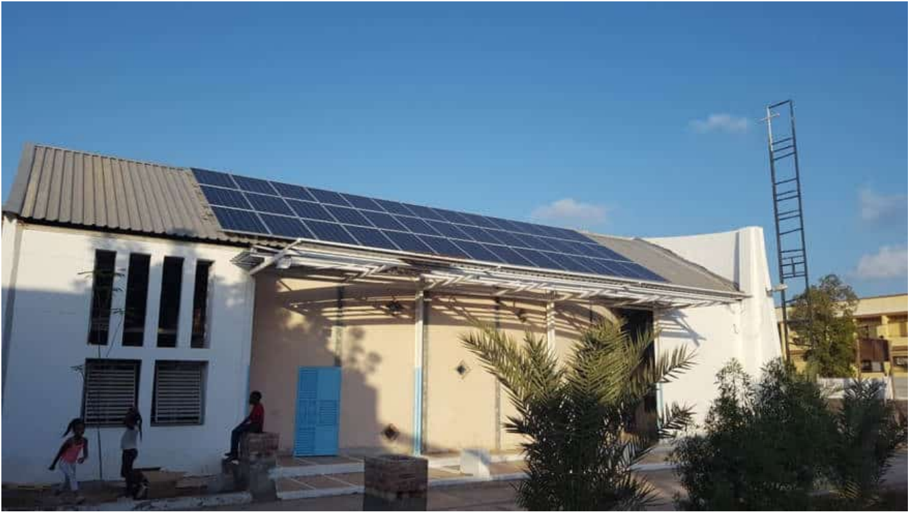
Panneaux solaires installés par l'EPED à Djibouti

À Djibouti, l'accès à l'énergie est un problème majeur : le pays doit accroître sa production d'électricité pour se développer, mais il est très dépendant des importations de combustibles fossiles, dont les prix explosent. Dans un programme de développement à long terme connu sous le nom de « Vision 2035 », il prévoit de parvenir à l'autonomie énergétique en visant un objectif de 100% de sources d'énergie renouvelables – notamment solaire. Encore faut-il former des techniciens, qui pour l'heure manquent cruellement, pour installer et entretenir les panneaux solaires. C'est ce que propose le centre de formation de l'EPED, l'Église protestante de Djibouti. Il dispose du matériel nécessaire, et a déjà développé une expertise dans l'encadrement et la formation pratique de jeunes actifs grâce à l'expérience du « chantier-école » mise en place lors de la réhabilitation du temple de Djibouti.