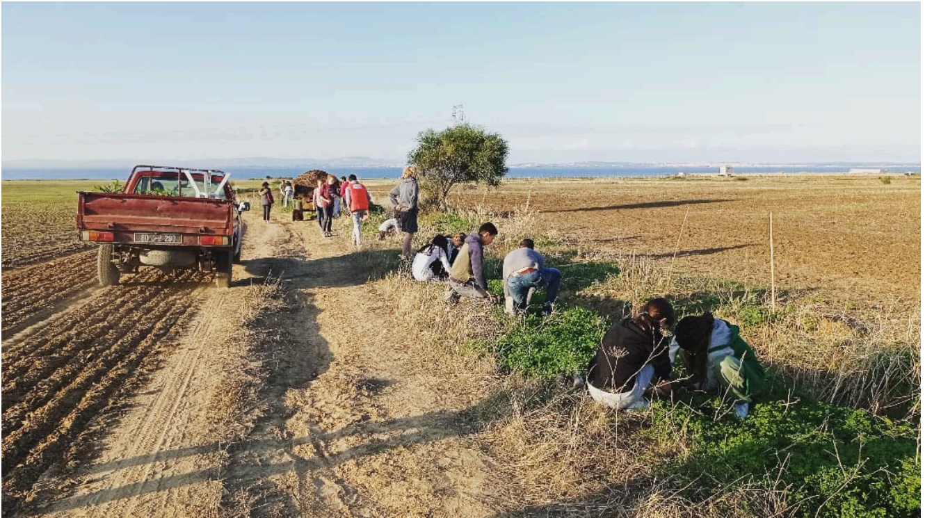
Rendre fertiles des terres délaissées en Tunisie