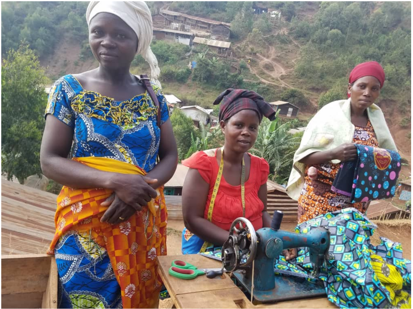
Participantes du projet porté par le Défap lors de la deuxième édition de Hope 360

Des « hopeurs » venus de tous les horizons : le « défi connecté » lancé à l'occasion de la deuxième édition de Hope360 réunit déjà dans une même course des participants présents un peu partout en France, mais aussi en Allemagne, en Suède et en Italie. Lancé au début de l'été, ce nouveau concept permet à tous ceux qui veulent s'engager pour défendre un projet de solidarité de cumuler des kilomètres où qu'ils se trouvent, et de les créditer, via une appli de sport, sur le site de Hope360. À ce jour, plus de 330 participants prennent part à ce challenge. Les coureurs/marcheurs/cyclistes engagés pour soutenir le projet du Défap totalisent près de 1000 km... Mais au-delà du soutien à un projet, il s'agit de parvenir, collectivement, à un seuil symbolique : engranger ensemble plus de 40.000 km – soit le tour de la Terre ! Pour l'instant, c'est près de 20.000 km qui ont été enregistrés sur le site de