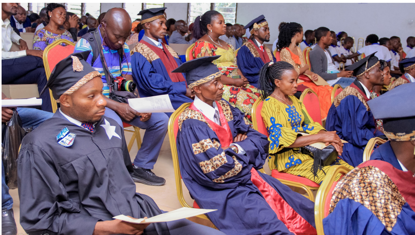
Remise des diplômes en décembre 2021 aux participants à la formation continue sur « Église et leadership » à l'ULPGL

Selon le dernier rapport du cabinet d'étude « Target » sur les Églises en RDC, plus de 93% des Congolais se déclarent chrétiens, avec 42% de catholiques, 25% de protestants, 15% d'adeptes des Églises évangéliques dites de Réveil, 4% de pentecôtistes et 1% de kimbanguistes. Avec ses 1447 paroisses réparties en 47 diocèses disséminés à travers le pays, l'Église catholique joue par exemple un rôle de premier plan. Depuis la signature d'une convention en 2011, l'État lui a délégué, à travers son organisation Caritas, l'organisation de la paye des enseignants du primaire et du secondaire dans les zones rurales. Elle administre directement entre 40 et 60 % des écoles et des services de santé, privés comme publics.