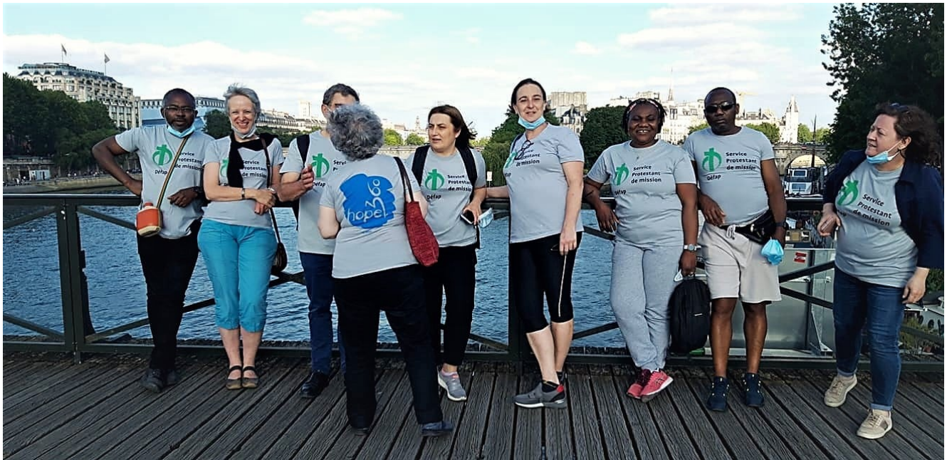
L'équipe du Défap dans les rues de Paris, lors de son parcours connecté du 12 juin

Celui du Défap concerne des micro-crédits à Bukavu, en République Démocratique du Congo. Ils sont destinés à des femmes qui, par de petites activités commerciales, s'efforcent de faire vivre leur famille au quotidien. Des activités aujourd'hui très menacées par la pandémie de Covid-19 : les mesures de confinement sans accompagnement décrétées par les autorités risquent de les priver de tout moyen de subsistance. Actuellement, les coureurs engagés pour soutenir ce projet du Défap totalisent 419 km. Un classement honorable au sein de l'ensemble des associations participantes ; mais d'autres ont fait bien mieux, comme Mercy Ships avec 867 km parcourus... ou La Gerbe, qui caracole loin devant avec la distance impressionnante de 3190 km engrangés par ses 42 coureurs ! Alors, venez nous aider à porter le projet du Défap !