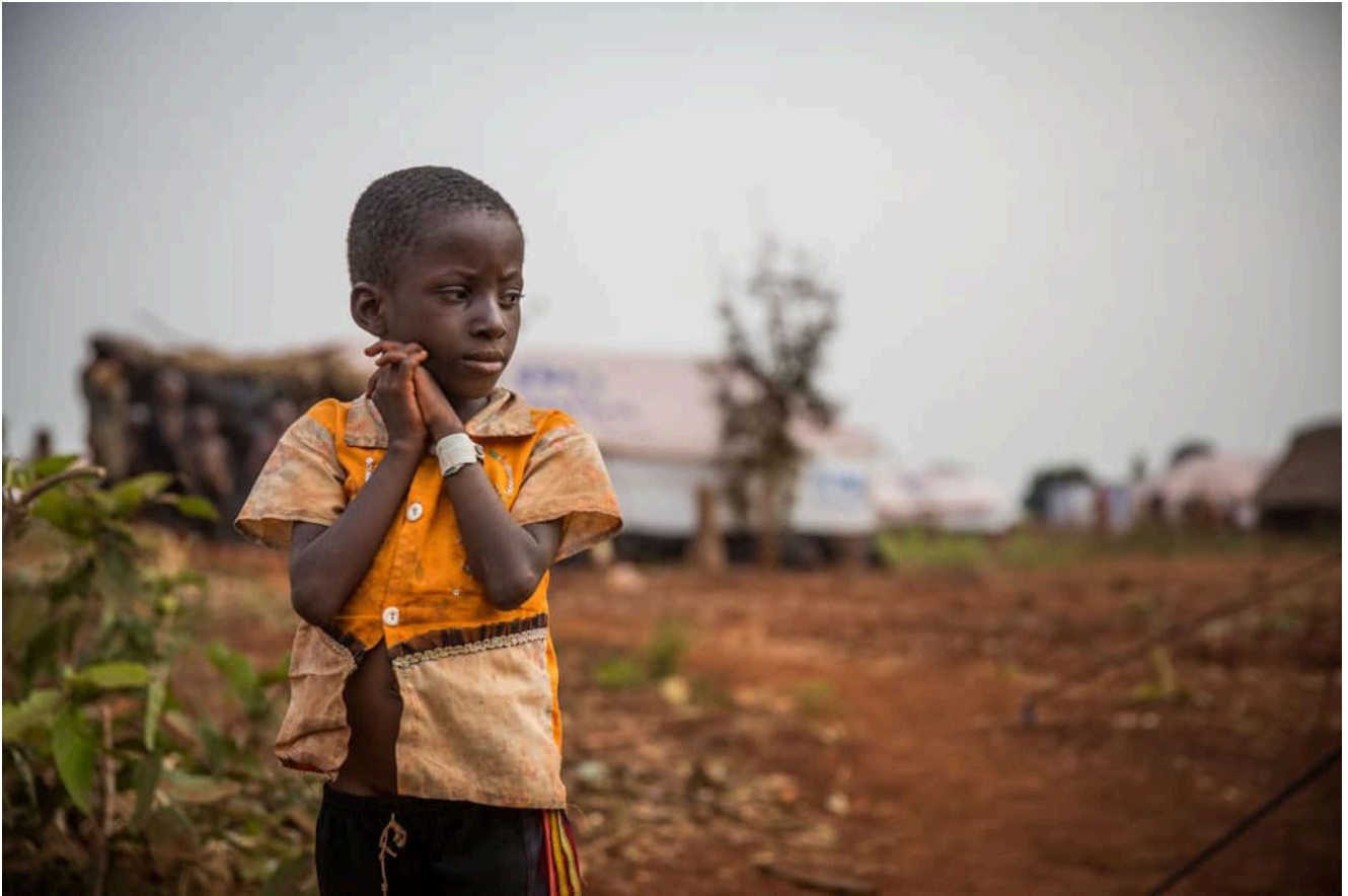
Enfant au Burundi

Des décennies de conflits et de guerres interethniques ont laissé des traces durables. En dépit de l'Accord de paix et de réconciliation signé en août 2000 à Arusha, les graines de violence demeurent et la méfiance entre communautés empêche de développer le pays, où l'insécurité alimentaire reste chronique.