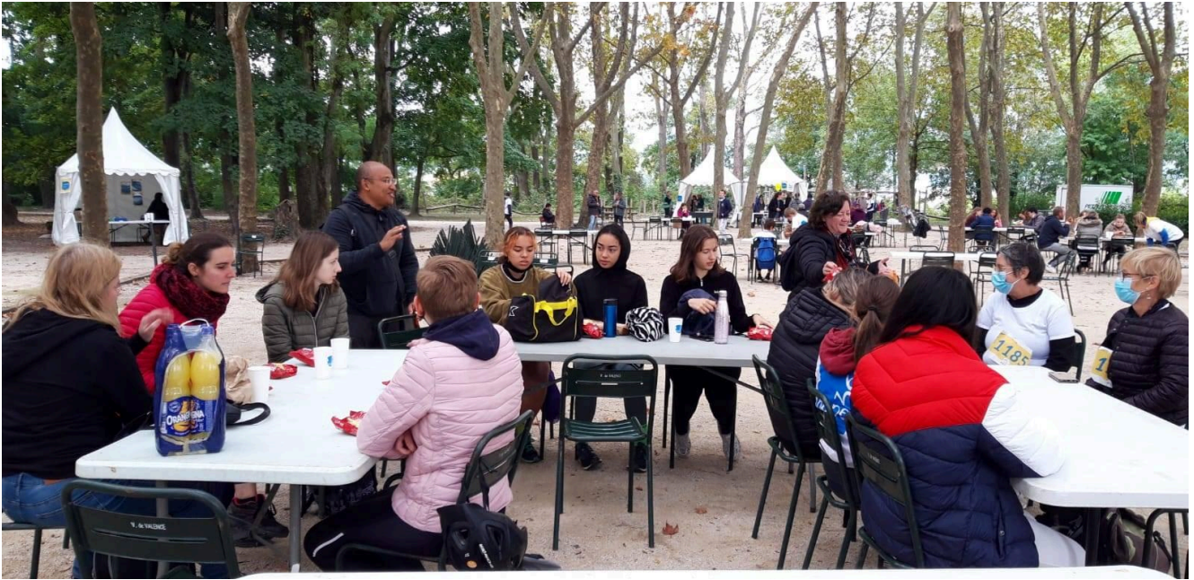
Présentation du projet « Microcrédits à Bukavu » sur le stand du Défap à Valence

Bilan global en quelques chiffres : pas loin de 45.000 euros collectés en faveur des divers projets (somme qui n'inclut pas les frais d'inscription des coureurs), près de 37.000 km parcourus à l'occasion du « défi connecté » qui fixait comme objectif de « faire le tour de la Terre » (soit 40.000 km)... et au-delà des nombreux projets qui ont pu mieux se faire connaître, la mise en place de multiples rencontres et dynamiques locales. Car c'est là un aspect dont les chiffres ne peuvent rendre compte : les liens qui se tissent lors de telles opérations dépassent les cadres des institutions participantes et les frontières confessionnelles. Asah, réunissant des acteurs chrétiens engagés dans la solidarité, participe d'un mouvement œcuménique dans lequel s'unissent les efforts d'organisations, de bénévoles et de coureurs issus de milieux qui entretiennent généralement peu de liens. Valence a d'ailleurs été choisie pour cette même raison – pour la dynamique œcuménique qui existe déjà dans cette ville. Et comme il s'agissait de la deuxième édition de Hope 360 dans cette ville, la municipalité a témoigné elle aussi d'un engagement inédit, allant jusqu'à participer aux épreuves avec sa propre équipe de coureurs.