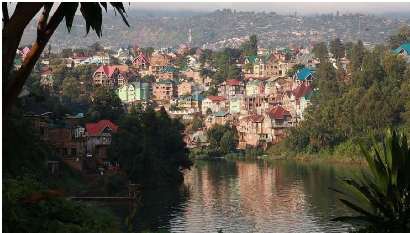
Vue de Bukavu

Le Kivu, dans l'Est de la République démocratique du Congo, a connu des périodes de guerre successives. Les populations appauvries luttent à la fois contre la malnutrition et contre une prolifération des maladies chroniques et épidémiques telles que le paludisme, le choléra ou la fièvre typhoïde.