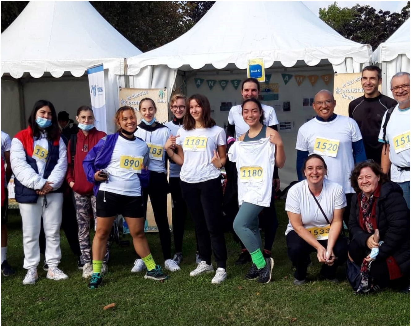
Sur le stand du Défap à Valence lors de la deuxième édition de Hope 360

Hope 360 est plus qu'une course, plus qu'un événement solidaire : c'est un agrégateur de volontés de changement. Celles des membres des ONG qui s'engagent dans son organisation et sont présentes sur leurs stands lors de la journée où se déroulent les épreuves ; celles des coureurs et bénévoles qui s'investissent, chacun à son niveau, soit pour courir, soit pour aider aux préparatifs ; celles de toutes les personnes qui découvrent le concept et décident d'y adhérer, que ce soit par un don ou en décidant de s'informer sur les manières de s'investir... Pour cette année 2021, Hope 360 a réuni au parc de l'Épervière, à Valence, environ 1200 personnes lors d'une journée combinant rencontres festives, courses solidaires et points d'information sur les possibilités d'engagement. Et en tout, environ 800 coureurs