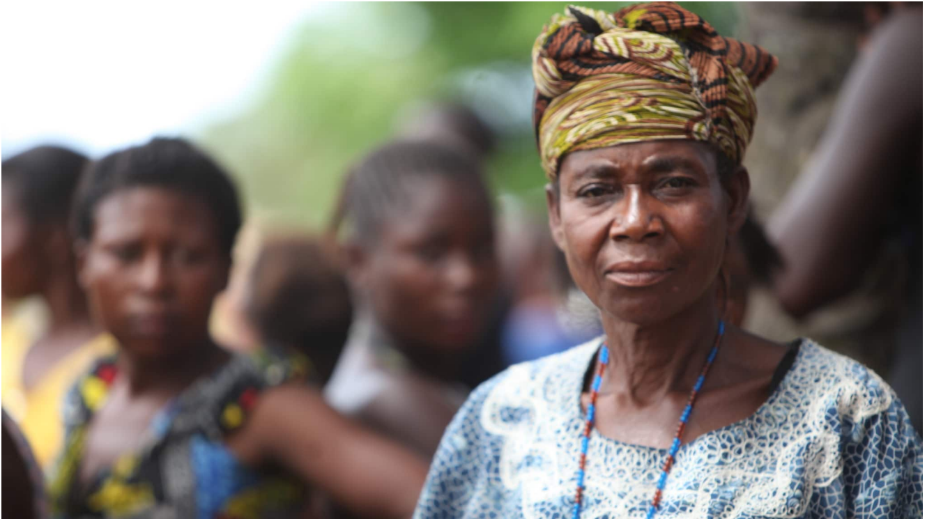
Un groupe de femmes congolaises dans la province du Kasai

Le Défap propose donc des bourses pour permettre à des jeunes femmes de poursuivre des études supérieures en théologie à l'Université Libre du Pays des Grands Lacs de Bukavu, de manière à former de futures cadres de l'Église du Christ au Congo. Il s'agit d'un pôle universitaire accueillant chaque année près de 800 étudiants au sein de sept facultés : théologie, droit, sciences économiques et gestion, santé et développement communautaires, psychologie et sciences de l'éducation, sciences et technologies appliquées. Au sein de la faculté de théologie, seules une quinzaine d'étudiants sont des étudiantes. Le Défap envisage de quasiment doubler ce nombre en proposant une douzaine de bourses, permettant de payer les frais liés aux études d'une douzaine de jeunes femmes.