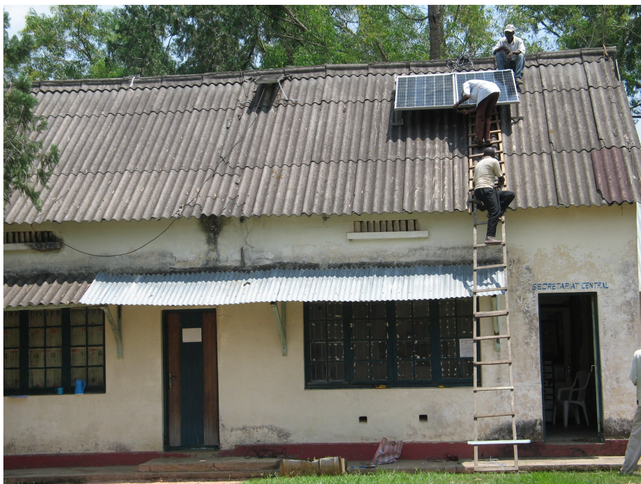
Un des bâtiments de l'UPRECO équipé de panneaux photovoltaïque – projet soutenu par le Défap

d'une province volontairement négligée par les autorités de République Démocratique du Congo, le Défap s'efforce d'améliorer les conditions de travail des étudiants de l'UPRECO. Une université dont la qualité des enseignements est largement reconnue, et qui ambitionne de former des cadres mieux à même de lutter contre les maux de la société congolaise. Le Défap soutient l'UPRECO à travers l'électrification de bâtiments universitaires, notamment d'un amphithéâtre, mais aussi par des bourses ; et sa bibliothèque a reçu un soutien via la Centrale de Littérature Chrétienne Francophone.