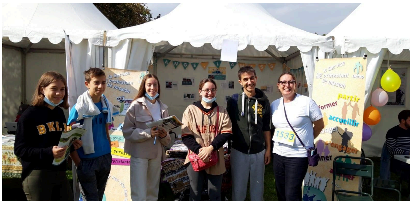
Sur le stand du Défap à Valence lors de la deuxième édition de Hope 360

Hope 360, c'est fini pour 2021... et c'est maintenant que tout commence pour la suite ! Retrouvez en images le reportage concocté par Asah sur cette journée de courses sportives et solidaires, en attendant GO 360 en 2022 et la troisième édition de Hope 360 en 2023 !