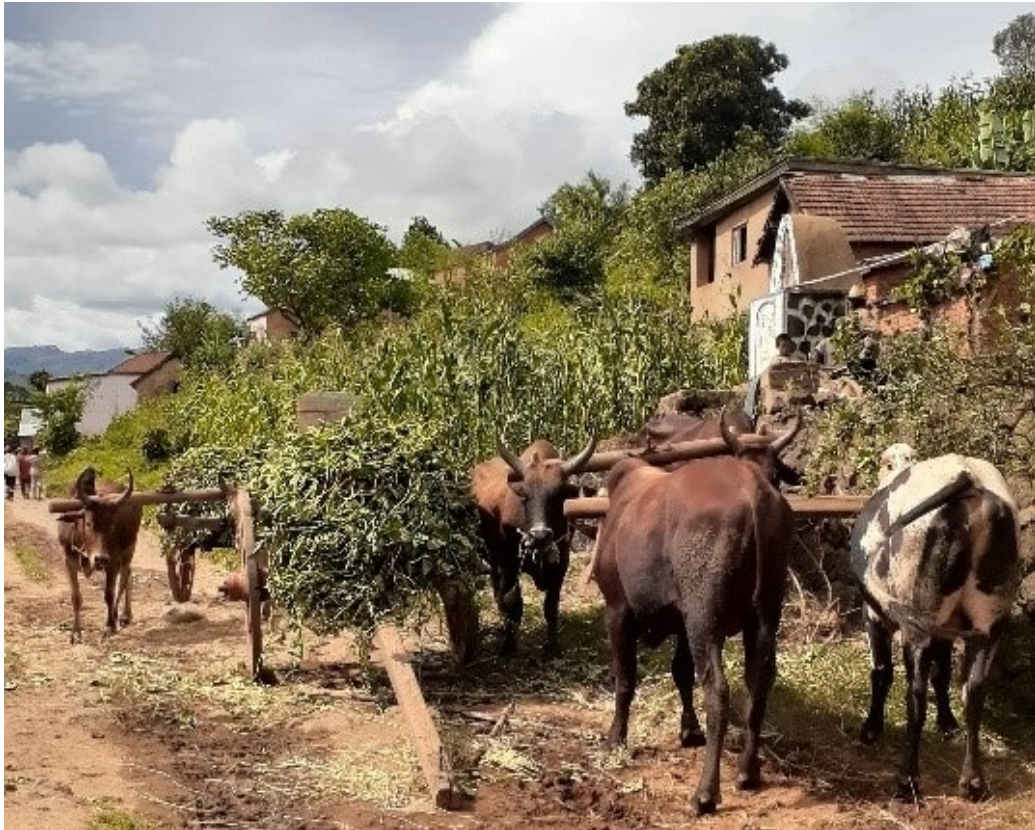
Zébus dans les rues de Betafo

Et parfois j'aimerais pouvoir prêter mes yeux pour partager des scènes de vie. 5h30 le matin, la lune brille encore, la pluie a transformé l'île rouge en une palette de multiples verts. Je sillonne les rizières, je traverse des villages qui s'éveillent, je cours, ça monte et je souris face à la beauté des montagnes. Les rayons du soleil qui font briller les champs, les paysans à vélo qui transportent le lait, les élèves qui prennent le chemin de l'école, les zébus qui tirent les charrettes, l'odeur du café. Mais très vite, il est temps de rentrer j'ai cours à 8h !