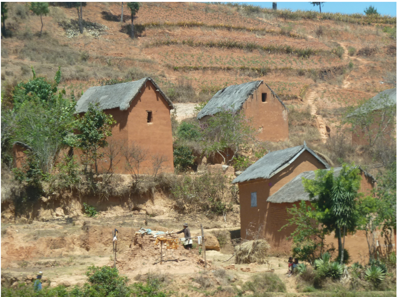
Un pays qui reste à plus de 80% rural : maisons traditionnelles malgaches