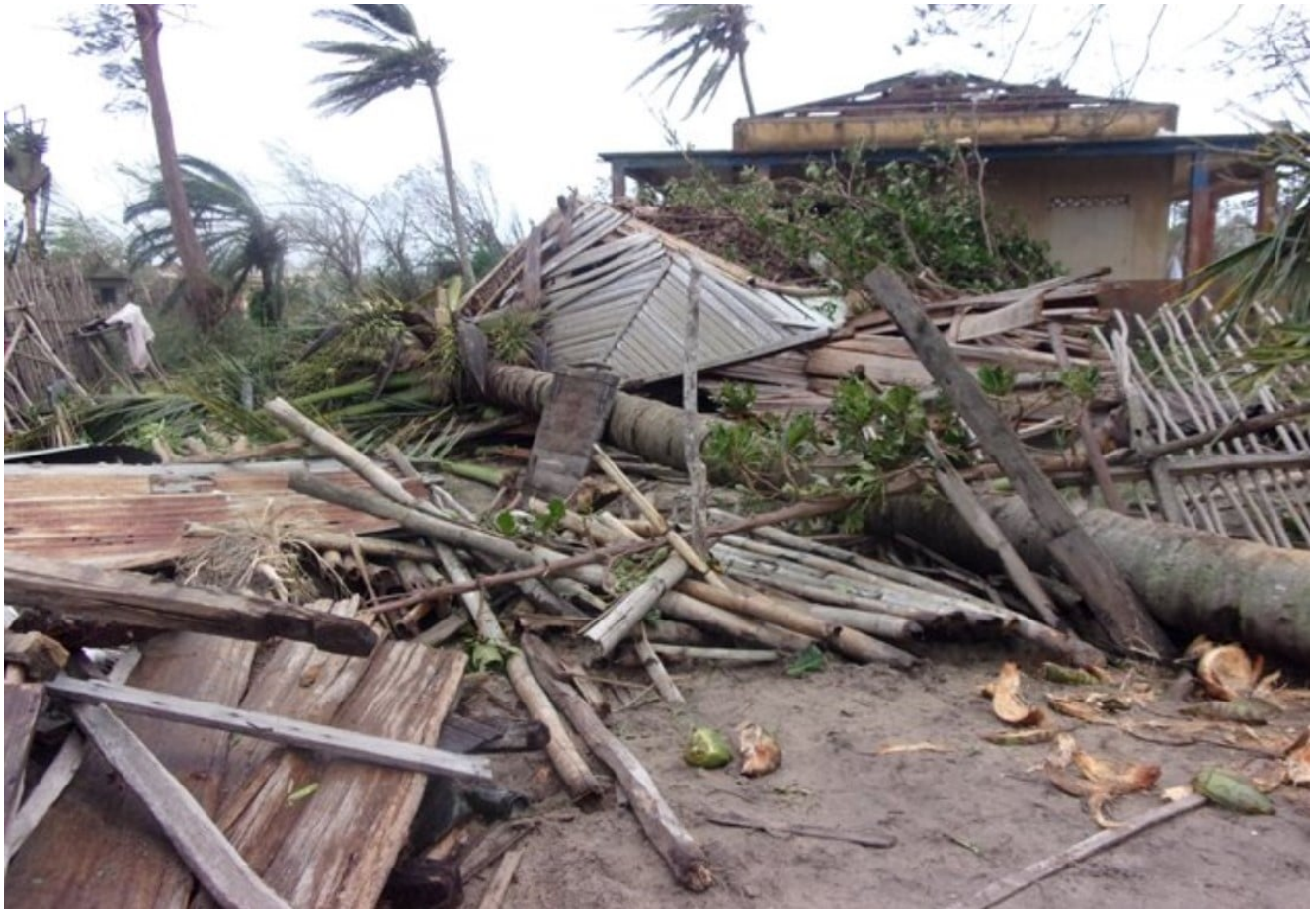
Vue des dégâts après le passage du cyclone Batsirai au centre Akany Fanantenana

Bien que disposant de ressources naturelles considérables, Madagascar a un taux de pauvreté parmi les plus élevés au monde. Le pays est classé au quatrième rang des pays avec les taux les plus élevés de malnutrition chronique, et près d'un enfant de moins de cinq ans sur deux souffre d'un retard de croissance. Environ 97% des enfants malgaches âgés de 10 ans ne peuvent pas lire et comprendre un texte court et adapté à leur âge. Et 4 enfants sur 10 abandonnent l'école primaire avant la dernière année. La pandémie de Covid-19 a en outre annulé plus d'une décennie de progrès en termes de revenu par habitant et de réduction de la pauvreté.