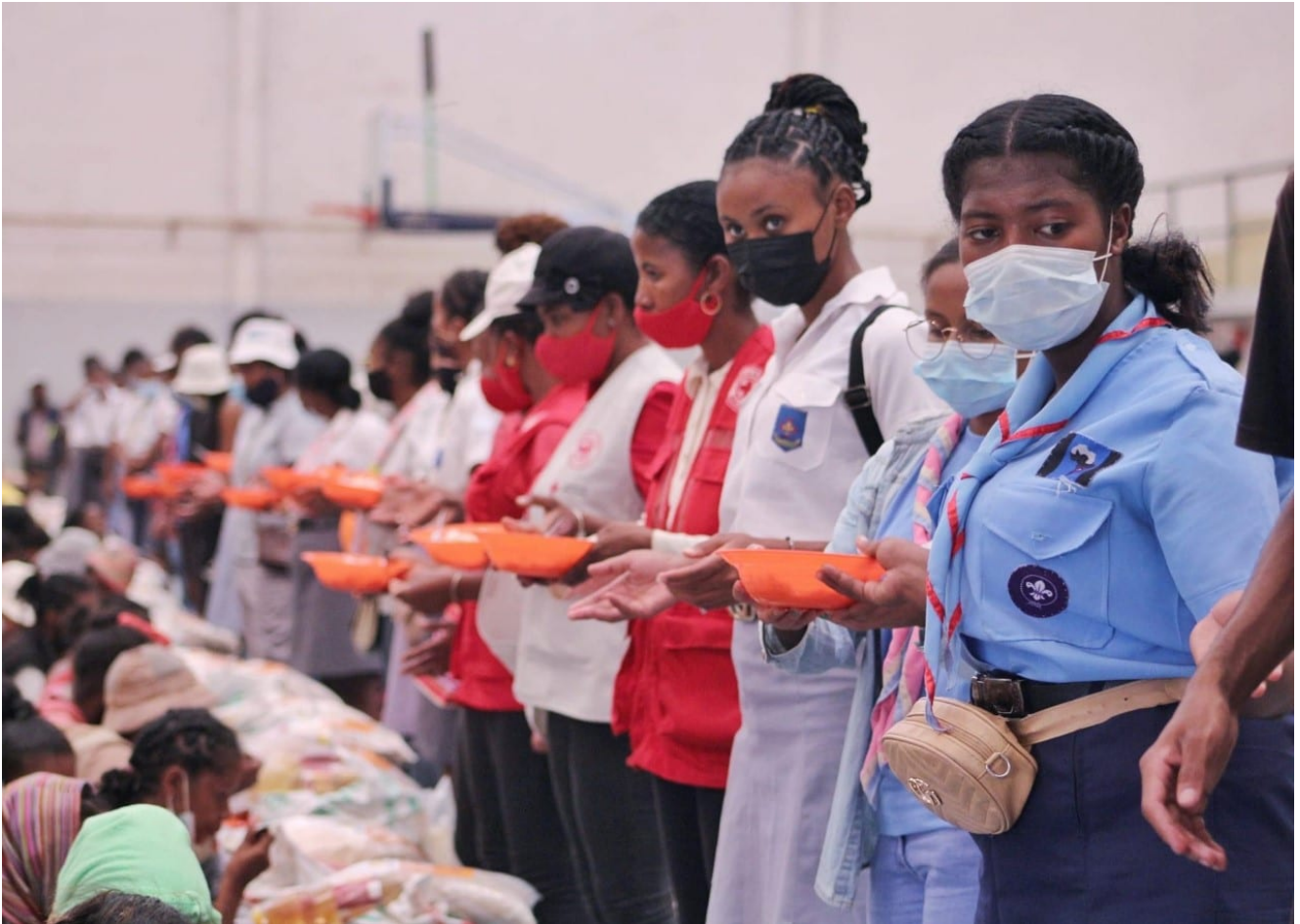
Jeunes mobilisés à Fianarantsoa pour venir en aide aux victimes du cyclone Batsirai, photo envoyée par Michel Brosille © DR

Ce pourraient être des images envoyées par une organisation humanitaire : des jeunes portant des sacs de denrées, une distribution de nourriture organisée dans un gymnase... À ceci près que ces volontaires intervenant après la catastrophe représentée par le cyclone Batsirai sont, non pas des membres d'ONG, mais des scouts malgaches. Les dégâts provoqués par la tempête dans tout le sud-est de Madagascar ont généré un élan de solidarité dans les villes moins touchées, comme ici, à Fianarantsoa, où de nombreux jeunes ont répondu à l'appel au volontariat pour aider et prendre en charge les victimes au gymnase Ambatomena. Environ 1700 personnes ont ainsi pu être reçues et soignées. De tels témoignages de solidarité, le Défap en reçoit régulièrement de la part de ses volontaires présents dans la grande île, qui ont eu la chance de travailler dans des régions (situées entre Antsirabé et