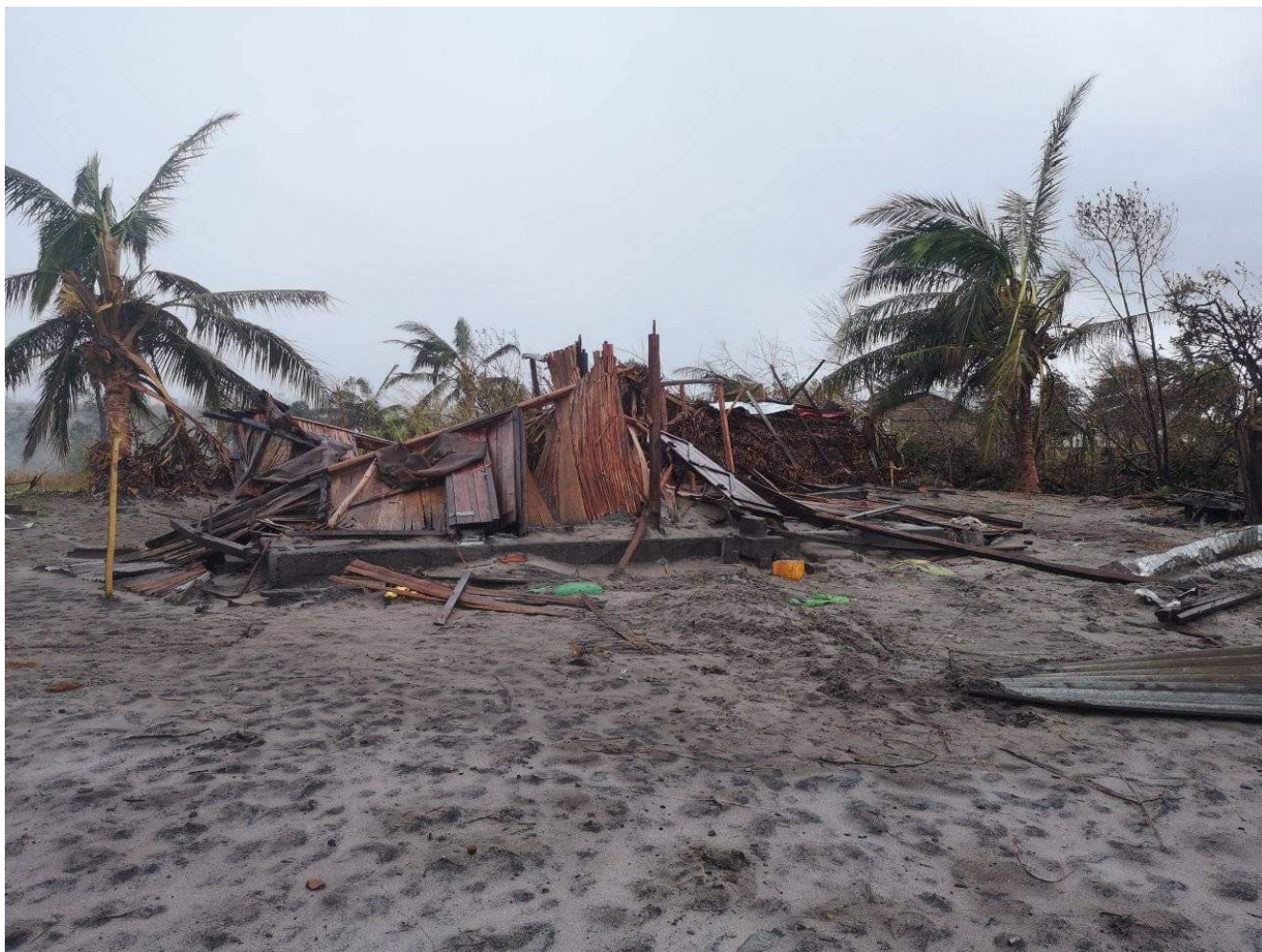
Dégâts du cyclone Batsirai

Tananarive) et avec des partenaires ayant échappé au plus gros de la tempête.