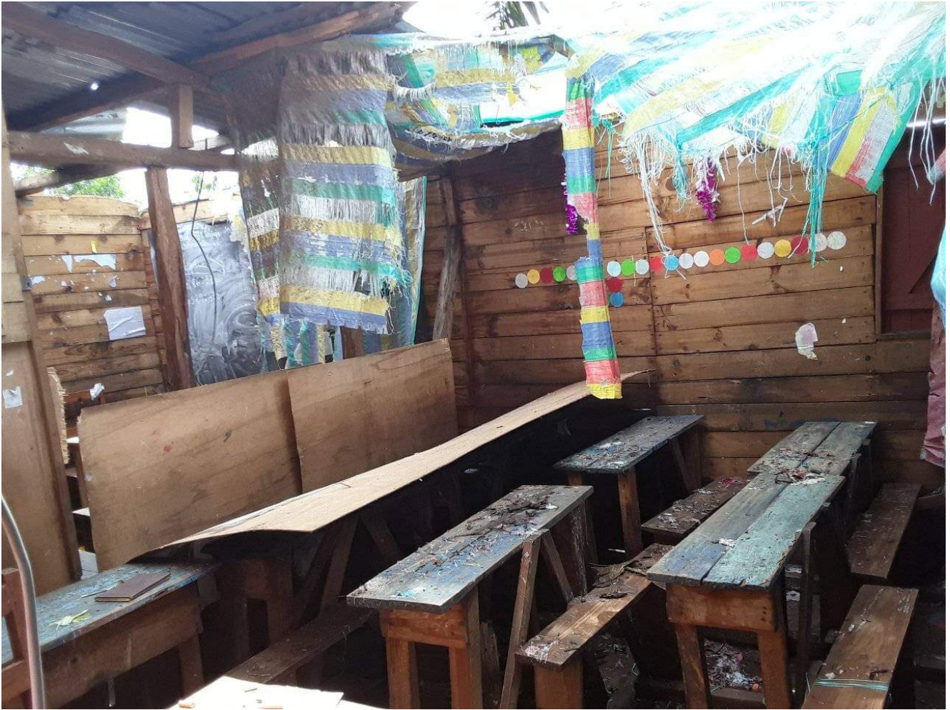
Vue des dégâts après le passage du cyclone Batsirai

Les premières étapes ont consisté à apporter des biens de première nécessité, notamment alimentaires. La suite – l'évaluation des besoins en termes de renforcement ou de reconstruction des bâtiments – prendra nécessairement du temps. Les partenaires de l'opération – La Cause, le Défap, ADRA et les Amis du Catja – se répartiront ensuite le financement des divers besoins qui auront été identifiés sur place par les ingénieurs d'ADRA. Mais pour l'instant, dans tout le district de Mananjary – et pas seulement dans la ville elle-même – les habitants ont dû reconstruire de manière fragile et provisoire, en utilisant ce qu'ils pouvaient récupérer des matériaux abandonnés sur place par la tempête. Même des bâtiments « en dur » ont parfois perdu leur toiture ; quant aux fragiles habitations en toit de tôles, elles ont souvent été réduites en pièces. Pour avoir une idée de l'ampleur des dégâts, et du temps qu'il faudra pour effacer