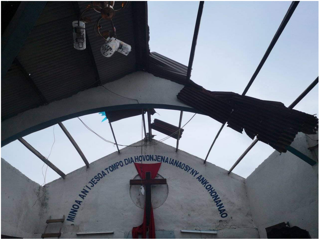
Dégâts du cyclone Batsirai

Les ravages sur les bâtiments, mais aussi sur les infrastructures (routes et ponts) ont été d'autant plus importants que le cyclone Batsirai a frappé Madagascar très peu de temps après la tempête Ana : moins violente, elle avait toutefois provoqué d'importantes inondations et s'était traduite par 55 morts. Et une autre menace se profile déjà : celle de Dumako, tempête tropicale qualifiée de « modérée », mais qui va toucher toute la côte nord-est de l'île alors que les sols sont saturés d'eau, les terres et les routes fragilisées.