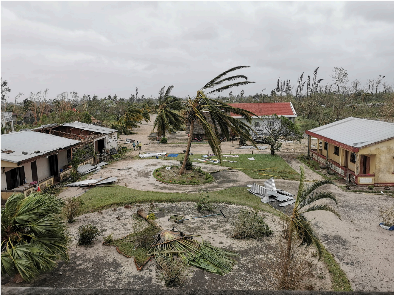
Dégâts du cyclone Batsirai au Catja, à Mananjary

Au Catja (Centre d'Accueil et de Transit des Jumeaux Abandonnés), même scène de désolation. Voici la manière dont les quelques heures durant lesquelles le cyclone s'est acharné sur Mananjary y ont été vécues, telles que racontées par les « Amis du Catja », association regroupant notamment des familles d'enfants adoptés ou parrainés sur place, et dont les responsables ont pu rejoindre le centre peu après la tempête :