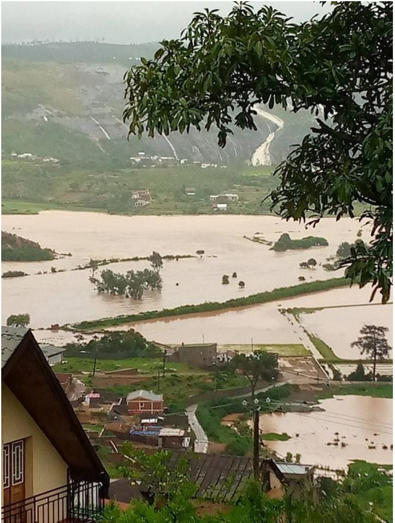
Image des effets du cyclone Batsirai, envoyée par Michel Brosille © DR

Les informations les plus complètes sur les conséquences du