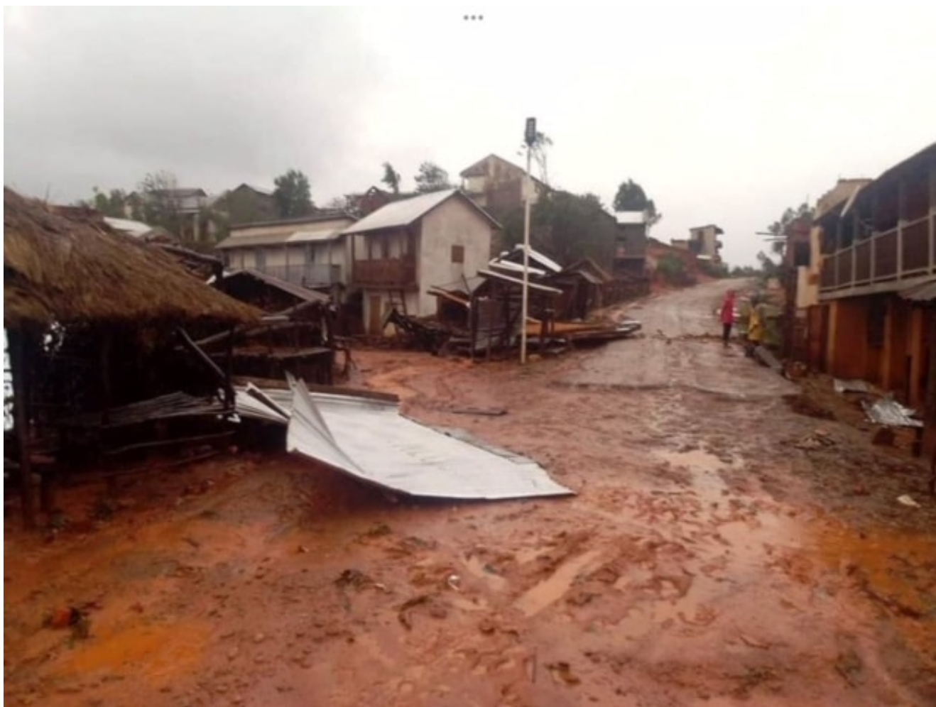
Image des effets du cyclone Batsirai, envoyée par Michel Brosille © DR

Si les villes où se déroulent les missions des envoyés du Défap ont été relativement épargnées, celles de la région côtière sont en grande partie détruites. À Mananjary, la rue principale ressemble à un champ de ruines, encombrée de débris d'arbres et bordée de frêles constructions dont les toitures en tôle se sont envolées. Seules quelques bâtisses en béton ont résisté. Les habitants traumatisés ne savent ni où dormir,