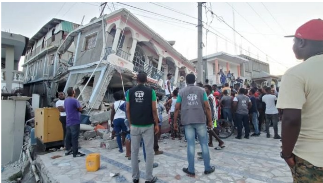
Haïti : membres d'ADRA dans la zone frappée par le séisme d'août 2021

Nazaréen, le journal Réforme. Tous ces acteurs entretiennent depuis des années des liens privilégiés en soutenant des institutions (la Fédération Protestante d'Haïti), des écoles (via la FEPH, la Fédération des Écoles Protestantes d'Haïti, qui grâce à son réseau de 3000 écoles, revendique la scolarisation de 300.000 enfants), des orphelinats (à travers La Cause)... ADRA-Haïti, pour sa part, est impliquée dans un projet de reboisement crucial dans un pays où 95% des forêts ont disparu en 200 ans, provoquant érosion des sols, glissements de terrain et aggravant la fragilité du pays face aux intempéries. Autant de relations et de projets qui se sont poursuivis, au-delà des catastrophes et des aléas politiques.