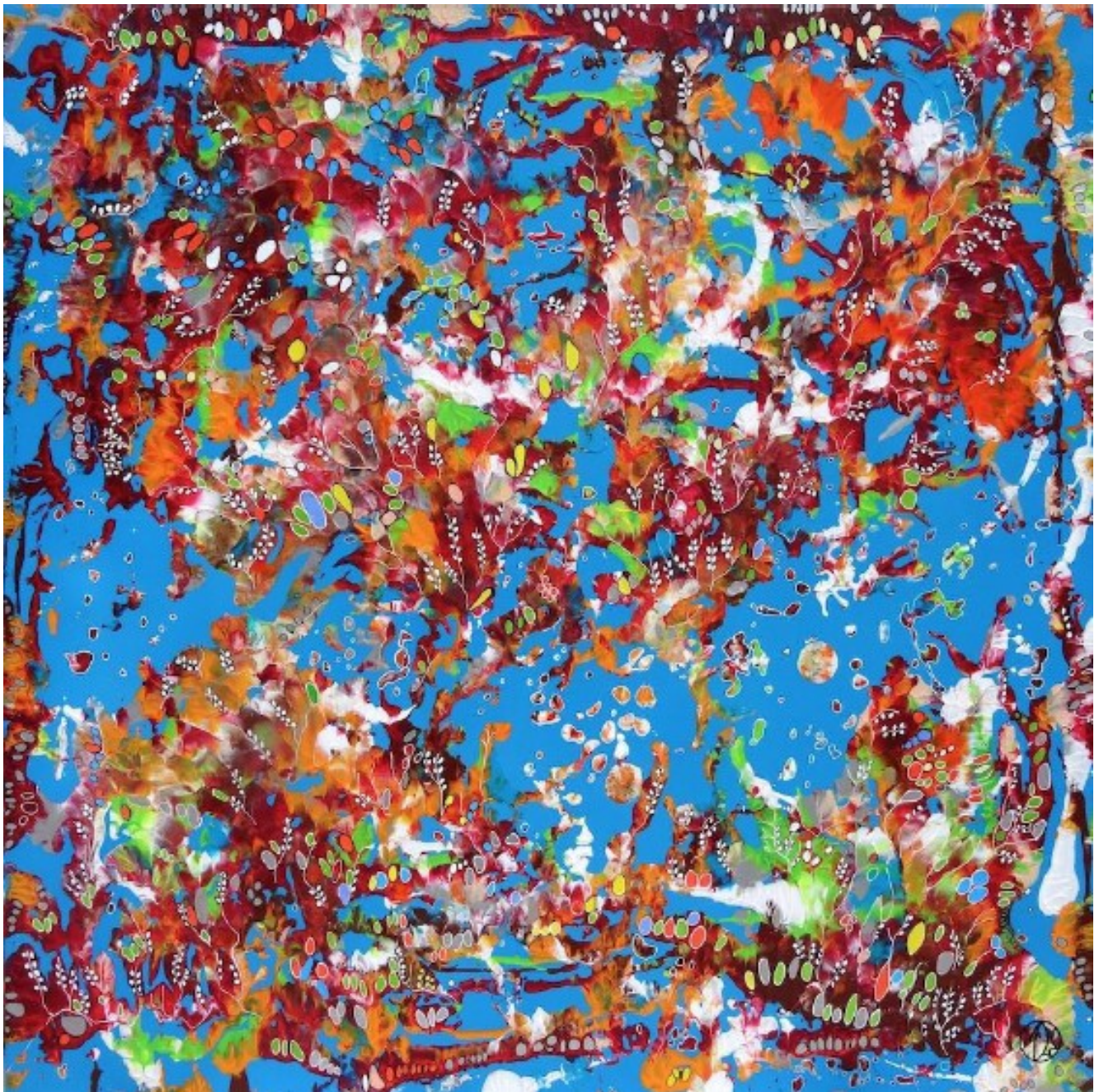
« Evanescence » acrylique sur toile de 2018 © Marie-Dominique Willemot

de la fondation La Cause à Mananjary pour la reconstruction des centres détruits par le cyclone. Ce tableau magnifique, exposé par l'artiste lors du concert, sera mis en vente le même soir au prix exceptionnel de 500 euros minimum (cotation du tableau 1500 euros). Pour le réserver, merci de vous adresser aux représentants de la Chorale Huit de Chœur. Le paiement peut être effectué par chèque bancaire à l'ordre de la Fondation La Cause.