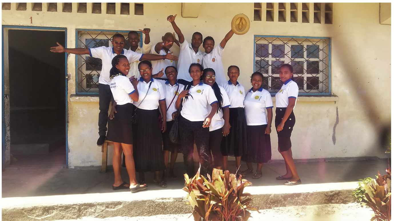
Élèves de Mahanoro

En dépit des contraintes liées à la situation sanitaire, il y a des projets qui avancent. À Mahanoro, ville de la côte orientale de Madagascar, le collège-lycée géré par la FJKM, l'Église réformée malgache, compte désormais une nouvelle salle de classe, construite avec le soutien financier du Défap.