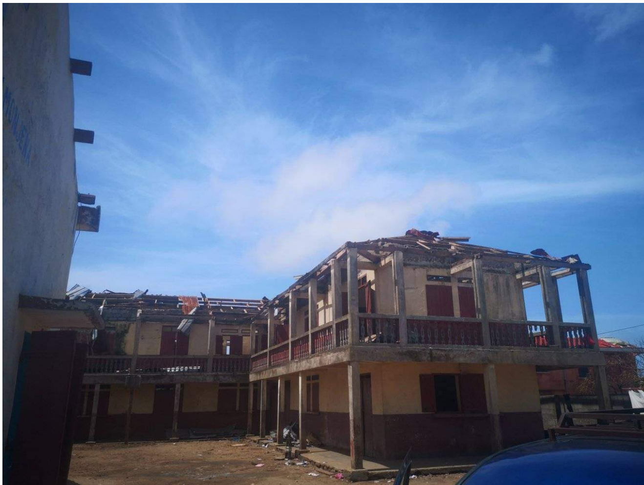
Dégâts du cyclone Batsirai

« Alors que des rapports continuent d'arriver, il est déjà évident que de nombreuses écoles et églises ont subi des dommages structurels majeurs (toits arrachés, bâtiments effondrés) » , indique le président de la FJKM, le pasteur Ammi Irako Andriamahazosa, dans une lettre envoyée au Défap. « La FJKM lancera un appel aux Églises et aux individus (...) pour qu'ils contribuent à l'aide aux familles touchées et aux efforts de reconstruction (...). Toute contribution possible pour aider à ces efforts de reconstruction serait très appréciée. »