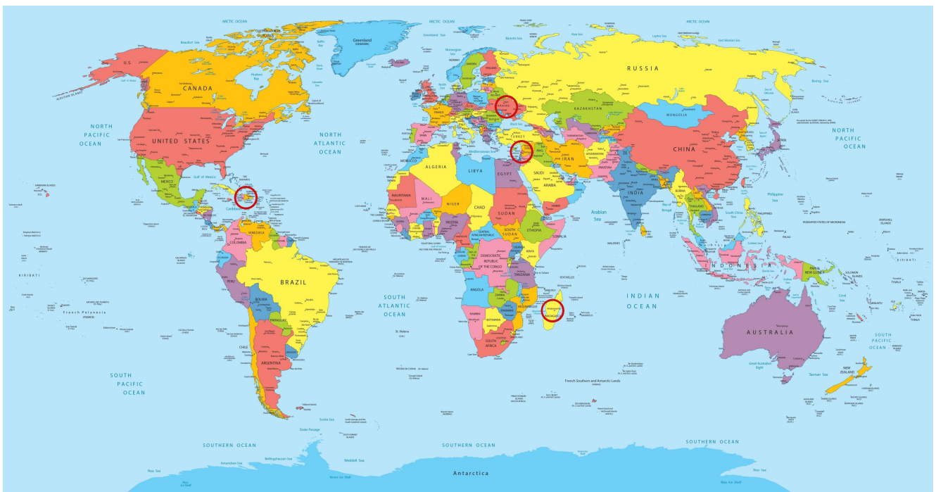
Carte de quelques crises en cours dans le monde : l'Ukraine, le Liban, Madagascar, Haïti

Alors que la réponse humanitaire à la guerre en Ukraine se traduit par des niveaux de financement record, nombre d'ONG craignent que cet afflux ne se fasse au détriment d'autres crises qui reçoivent peu d'attention et restent gravement sous-financées. Quelques exemples de ces crises dans lesquelles le Défap est directement impliqué : Haïti, le Liban et Madagascar.