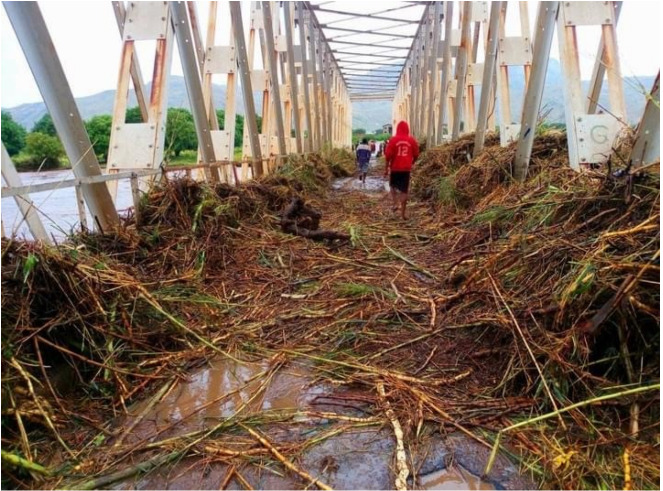
Image des effets du cyclone Batsirai, envoyée par Michel Brosille © DR

Les organisations humanitaires présentes notamment dans le sud de l'île redoutent une nouvelle crise humanitaire. Entre les inondations qui ont frappé le centre du pays lors du passage de la tempête Ana, les dégâts de Batsirai et la sécheresse qui provoque la famine dans le sud, c'est une grande partie de l'île qui est désormais concernée. Le Coordonnateur humanitaire de l'ONU pour Madagascar n'hésite pas à lier directement cette succession de catastrophes au changement climatique.