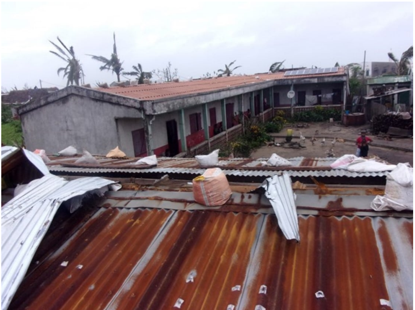
Dégâts du cyclone Batsirai au niveau de la nurserie du centre Akany Fanantenana, à Mananjary

n'oublions pas Madagascar ! Les dégâts dans la ville de Mananjary, détruite à 90% par le passage du cyclone Batsirai, contraignent toujours plusieurs dizaines de milliers d'habitants de la région à vivre dans les conditions les plus précaires. Le Défap s'est associé à la fondation La Cause, qui gère deux orphelinats sur place, ainsi qu'à ADRA et aux Amis du Catja, pour aider les centres d'accueil d'enfants abandonnés à retrouver une autonomie. Votre aide est essentielle ! La Cause organise un concert de soutien vendredi prochain : rendez-vous à 20 heures à l'Église américaine de Paris, 65 Quai d'Orsay, pour écouter les 80 choristes et musiciens de la Chorale Huit de Chœur de Versailles chanter pour Madagascar.