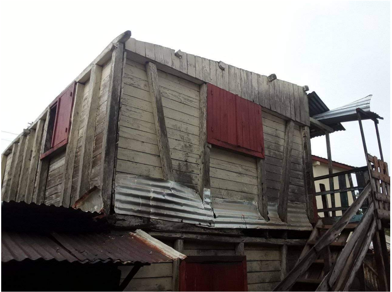
Dégâts du cyclone Batsirai

La fondation La Cause, proche du Défap et qui soutient des centres d'accueil d'enfants à Mananjary, région ayant subi les plus gros dégâts, a déjà lancé un appel aux dons pour aider à la reconstruction du Catja (Centre d'Accueil et de Transit des Jumeaux Abandonnés) et du centre Akany Fanantenana. Vous pouvez obtenir plus de détails et découvrir comment aider ici . Le Défap soutient pour sa part un projet de reconstruction lancé par ADRA-Madagascar , en lien avec ADRA-France ; le Défap et ADRA sont en partenariat via la plateforme Solidarité Protestante.