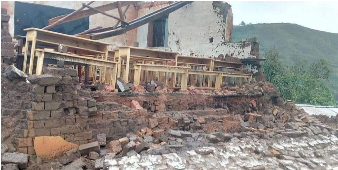
Image des effets du cyclone Batsirai, envoyée par Michel Brosille © DR

maisons, submergeant les cultures et coupant les routes. Si les envoyés du Défap étaient dans des villes qui sont restées relativement épargnées, ils donnent des nouvelles des dégâts dans les régions directement impactées.