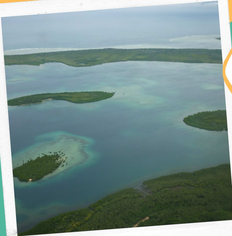
Sara Enseignante de français envoyée au Vanuatu