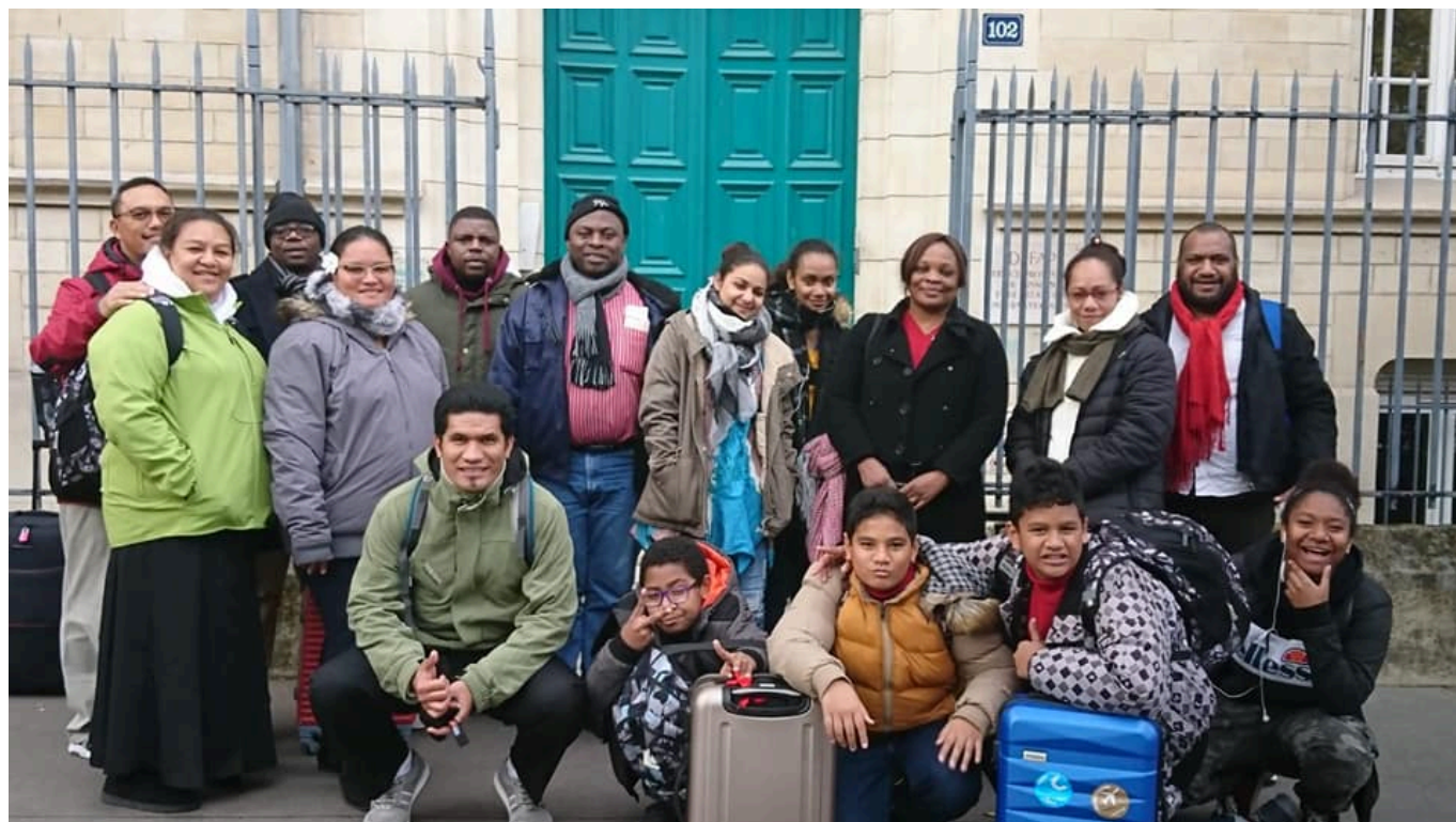
Le groupe des boursiers du Défap posant devant le 102 boulevard Arago, novembre 2019