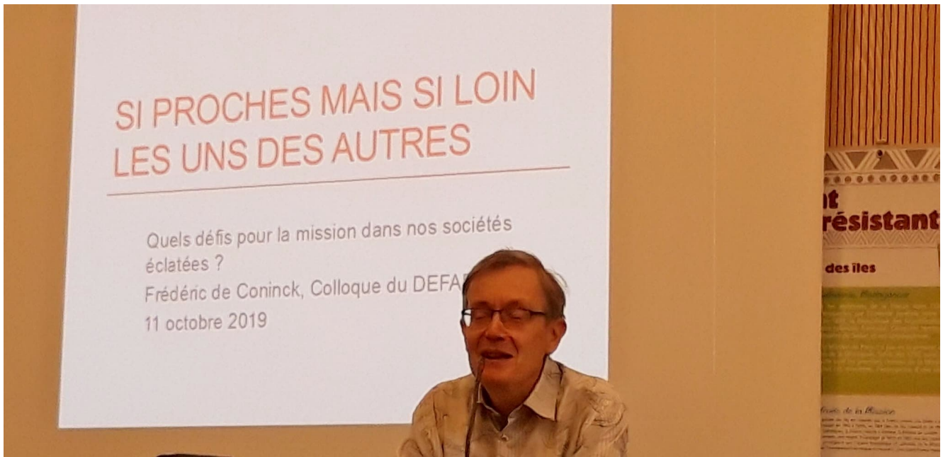
Intervention de Frédéric de Coninck