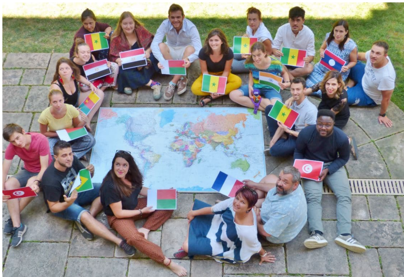
Photo de groupe des envoyés du Défap, lors de la session de formation de juillet 2019