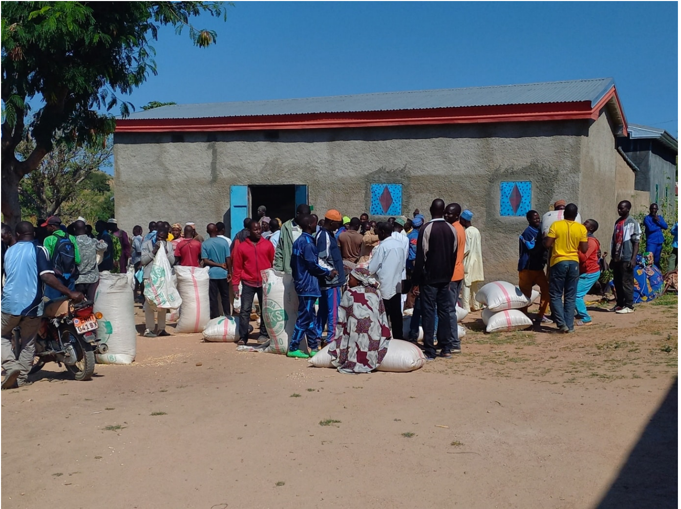
Distribution de vivres après les intempéries dans le nord du Cameroun : un projet présenté par l'EFLC et financé par le Défap et la Fondation du protestantisme