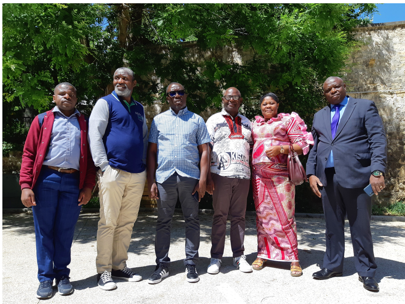
Groupe de chercheurs en congé-recherche dans le jardin du 102 boulevard Arago lors de la rencontre annuelle organisée en juin 2023