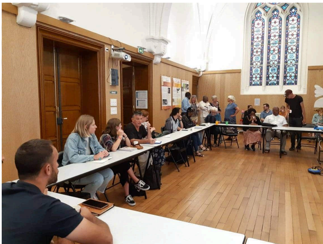
Session 2023 de la formation des envoyés du Défap : les participants s'installent avant la présentation de l'équipe du Défap...

formation et du suivi des volontaires du Défap (les « envoyés »). Elle a rejoint l'équipe au cours du premier trimestre 2023. Au micro de Guylène Dubois, elle évoque pour Fréquence protestante son parcours, qui l'a amenée de la Cevaa (la Communauté d'Églises en mission) au Défap, deux institutions proches qui s'occupent, chacune à sa manière, d'envoi de volontaires. Elle fait aussi le point sur les spécificités du Défap, sur la formation qui est dispensée aux « envoyés » avant leur départ, et sur l'évolution des profils et des missions.