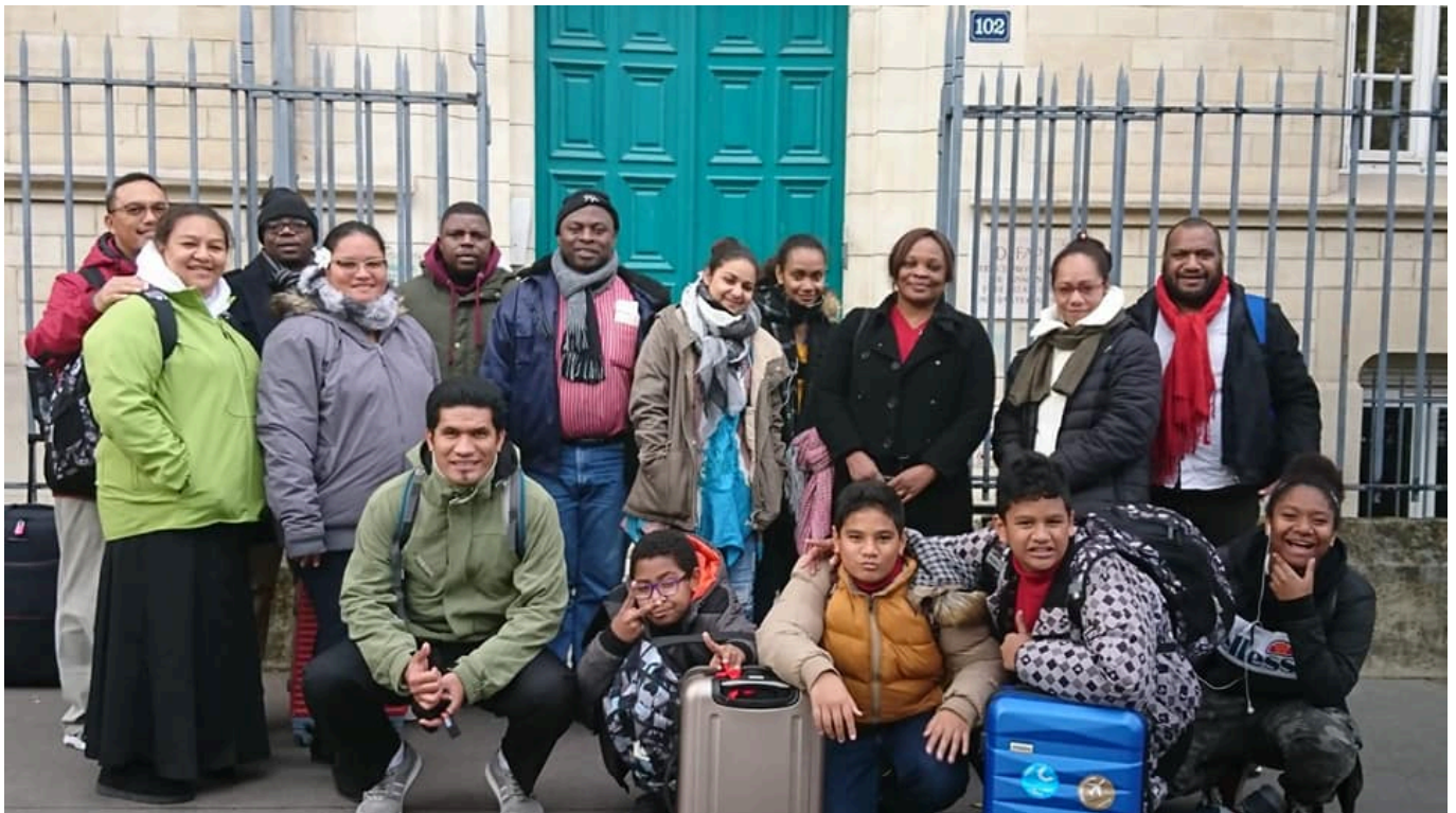
Groupe de chercheurs en congé-recherche, posant avec leurs