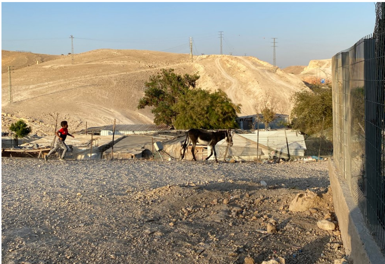
Vue du camp de bédouins de Khan Al Ahmar

place en 2022 par le Conseil œcuménique des Églises, viennent d'une vingtaine de pays ; en France, leur suivi administratif est assuré par le Défap. Décrire à leur retour ce qu'ils ont vécu, à travers des lettres ou des cycles de conférences, fait partie de leur engagement.