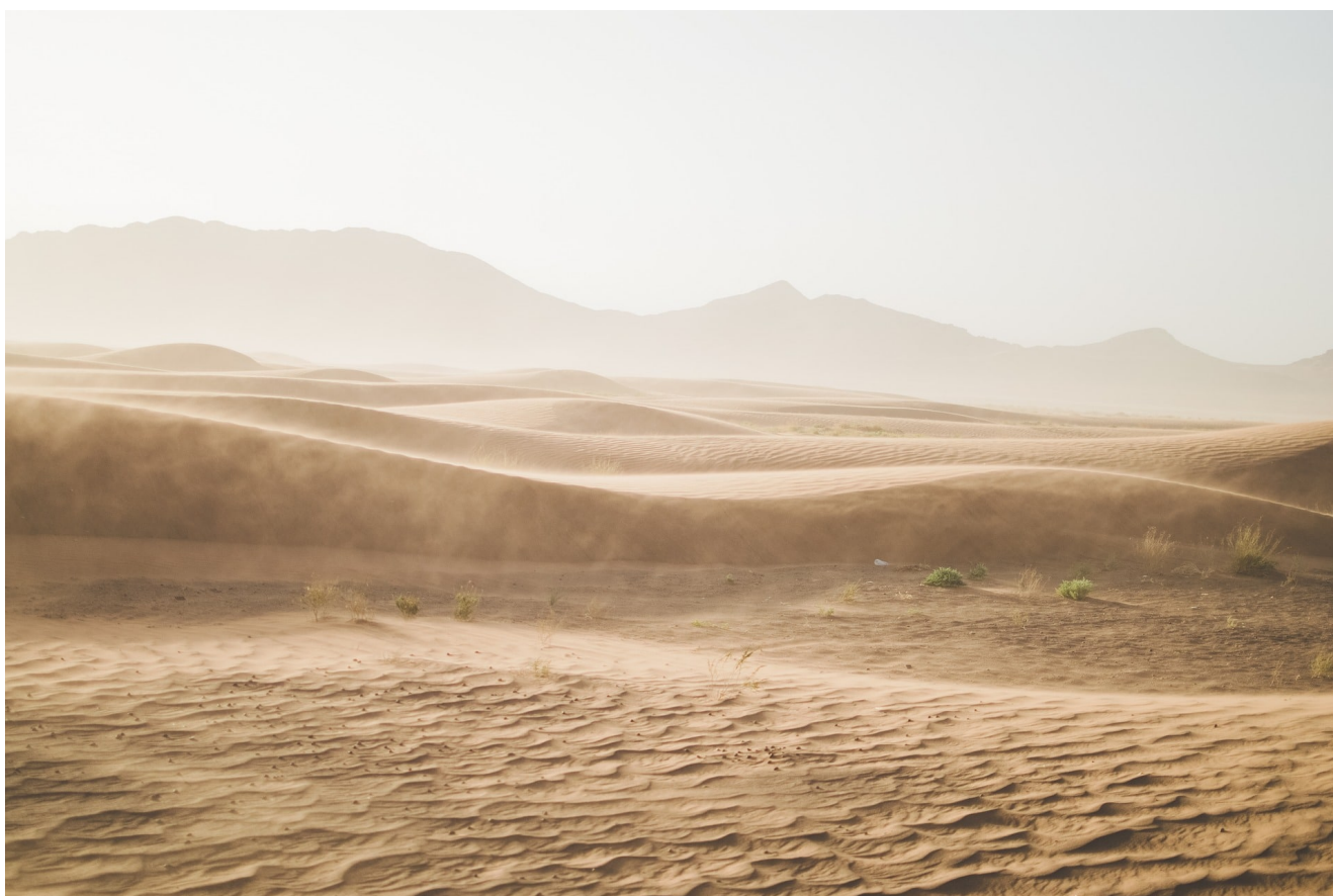
Désert de sable

Que nous soyons d'Orient ou d'Occident, du Nord ou du Sud, le désir de pouvoir sur la matière – pouvoir magique, technique, scientifique, informatique – quand il s'empare totalement de nous, peut nous conduire à la défiguration de la vie et du monde.