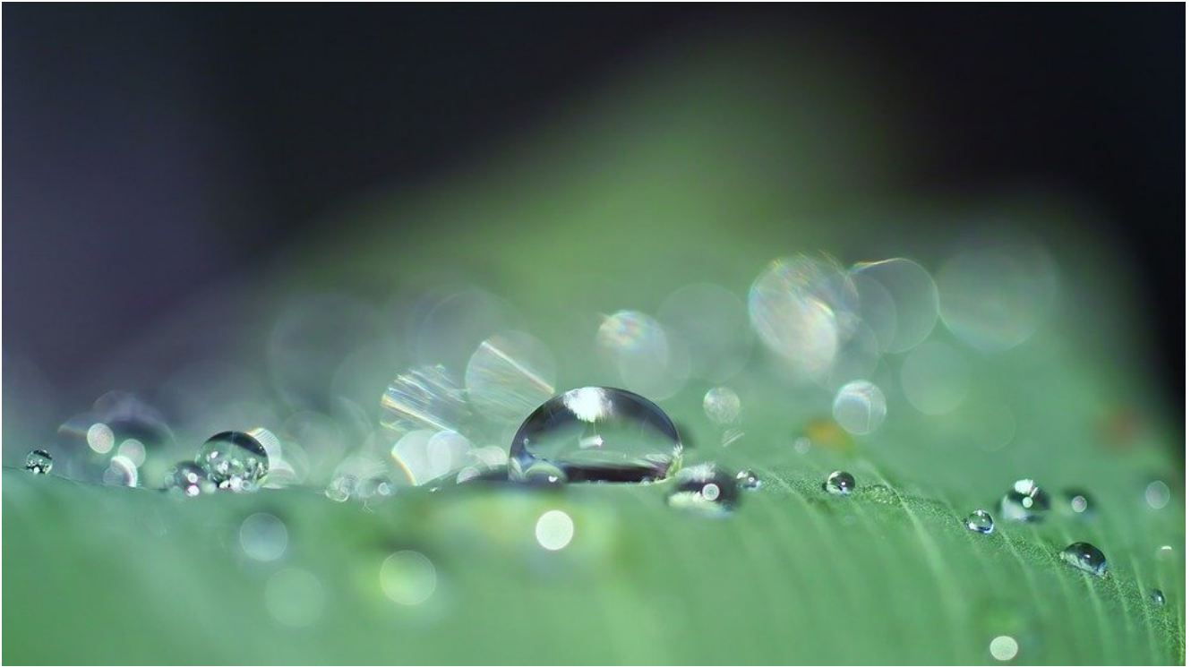
Goutte d'eau

Qu'entendre de la prière de Jésus à Gethsémané ?