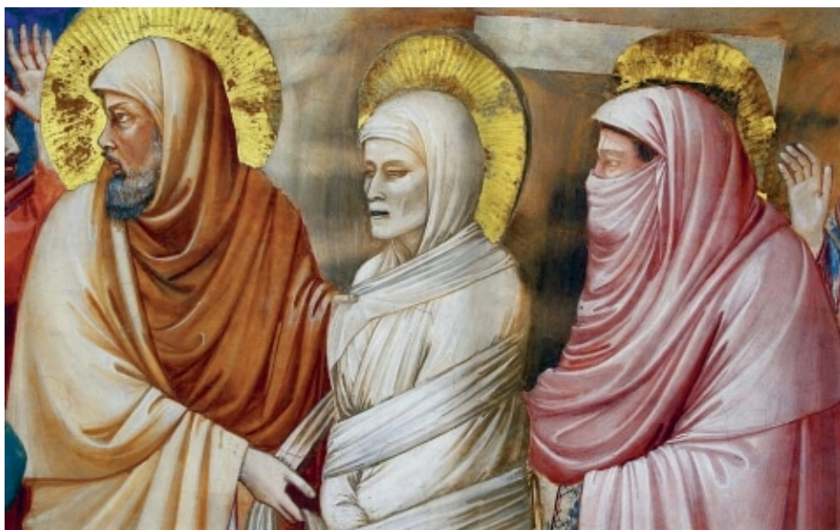
La résurrection de Lazare, Giotto, chapelle de l'Arena, Padoue, 1303

A travers ce long récit un homme, Lazare, entre dans la maladie, meurt, est enseveli selon le rituel, demeure quatre jours au tombeau, puis est réveillé de la mort à l'appel de