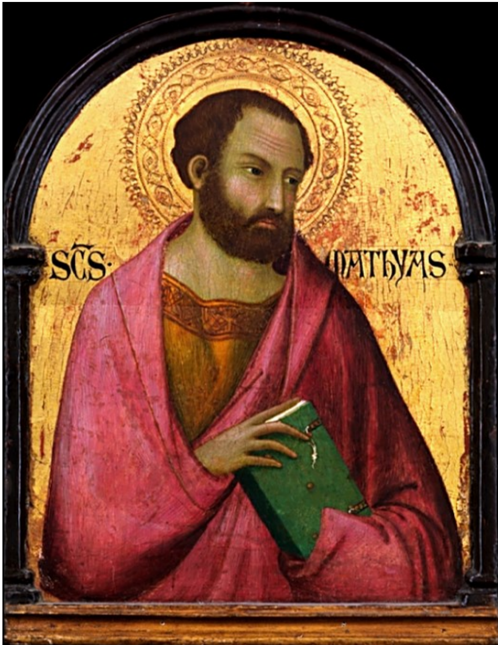
L'apôtre Matthias par l'atelier de Simone Martini (1319), Met, New York, États-Unis.