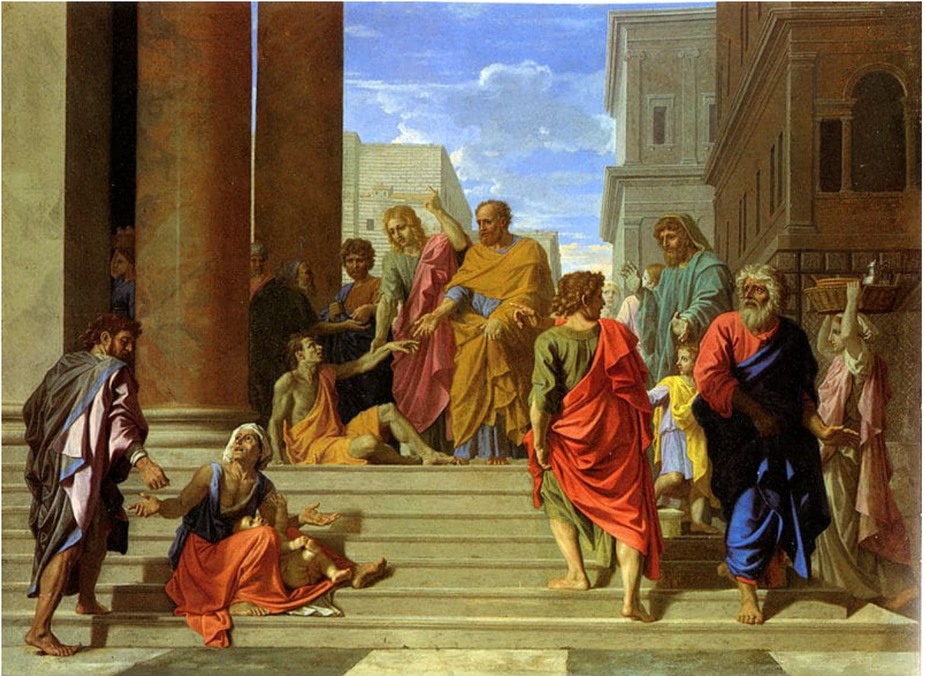
« Saint Pierre et Saint Jean guérissant le boiteux », par Nicolas Poussin – Metropolitan Museum of Art – reproduction : Wikimedia Commons

Dans les Évangiles, les rencontres personnelles de Jésus tiennent une grande place, et sont toujours porteuses de vie, de guérison, d'espérance. La rencontre de Pierre et Jean avec l'homme handicapé s'inscrit dans la suite et montre deux choses : les apôtres ont vraiment compris qu'il n'y avait pas d'enseignement de l'évangile sans manifestation concrète de l'évangile au niveau du corps ; en leur envoyant son Esprit, Jésus leur a transmis sa « puissance » de guérison.