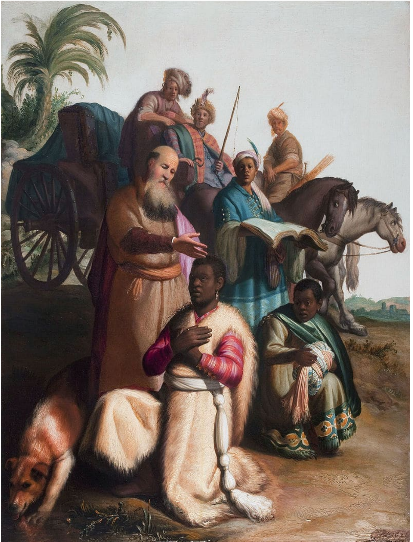
L'eunuque éthiopien. Rembrandt, 1620 – Wikimedia Commons Le diacre Étienne vient d'être lapidé sous les yeux de Saul de Tarse, qui approuve ce meurtre et participe à la persécution