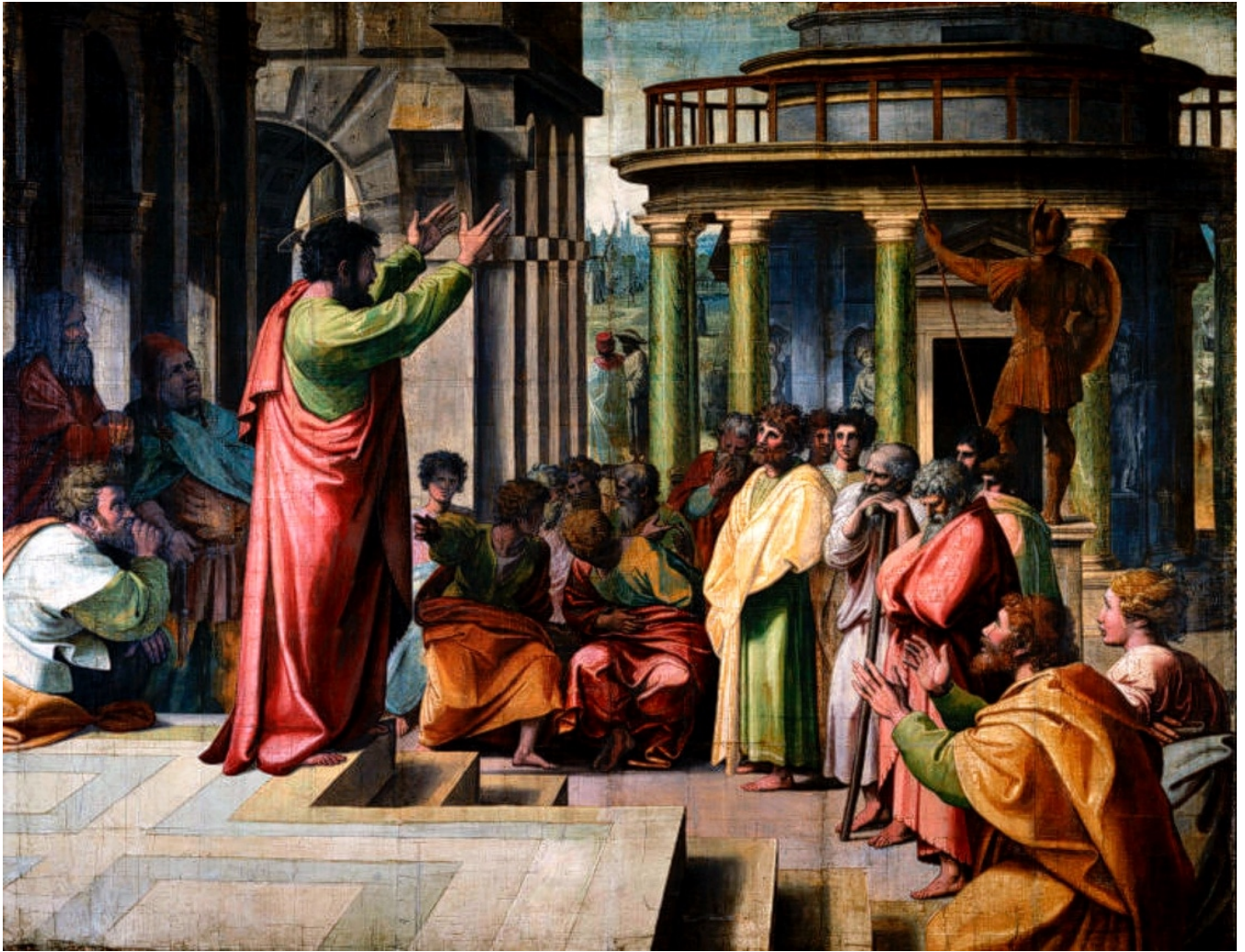
Raphaël : Saint-Paul prêchant à Athènes, Victoria and Albert Museum

Déchaîner les foules, c'est bien... les déchaîner contre soi, c'est plus problématique.