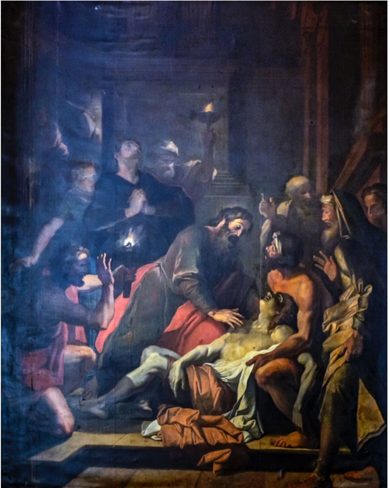
Jacques François Courtin, Saint Paul ressuscitant Eutyque, cathédrale Saint-Étienne de Toulouse

Le chapitre 20 nous présente pour la première fois une liste des noms de ceux qui accompagnent Paul et qui viennent de