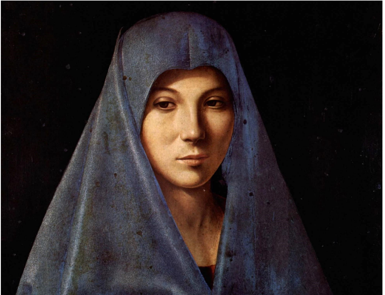
La Vierge de l'Annonciation – Antonello de Messine, vers 1475 – Galleria Regionale della Sicilia (Palermo)

Au sixième mois, l'ange Gabriel fut envoyé par Dieu dans une ville de Galilée du nom de Nazareth, chez une vierge fiancée à un homme du nom de Joseph, de la maison de David ; le nom de la vierge était Marie. Il entra chez elle et dit : Réjouis-toi, toi qui es comblée par la grâce ; le Seigneur est avec toi. Très troublée par cette parole, elle se demandait ce que pouvait bien signifier une telle salutation. L'ange lui dit : N'aie pas peur, Marie ; car tu as trouvé grâce auprès de Dieu. Tu vas être enceinte ; tu mettras au monde un fils et tu l'appelleras du nom de Jésus. Il sera grand et sera appelé Fils du Très-Haut, et le Seigneur Dieu lui donnera le trône de David, son père. Il régnera pour toujours sur la maison de Jacob ; son règne n'aura pas de fin.