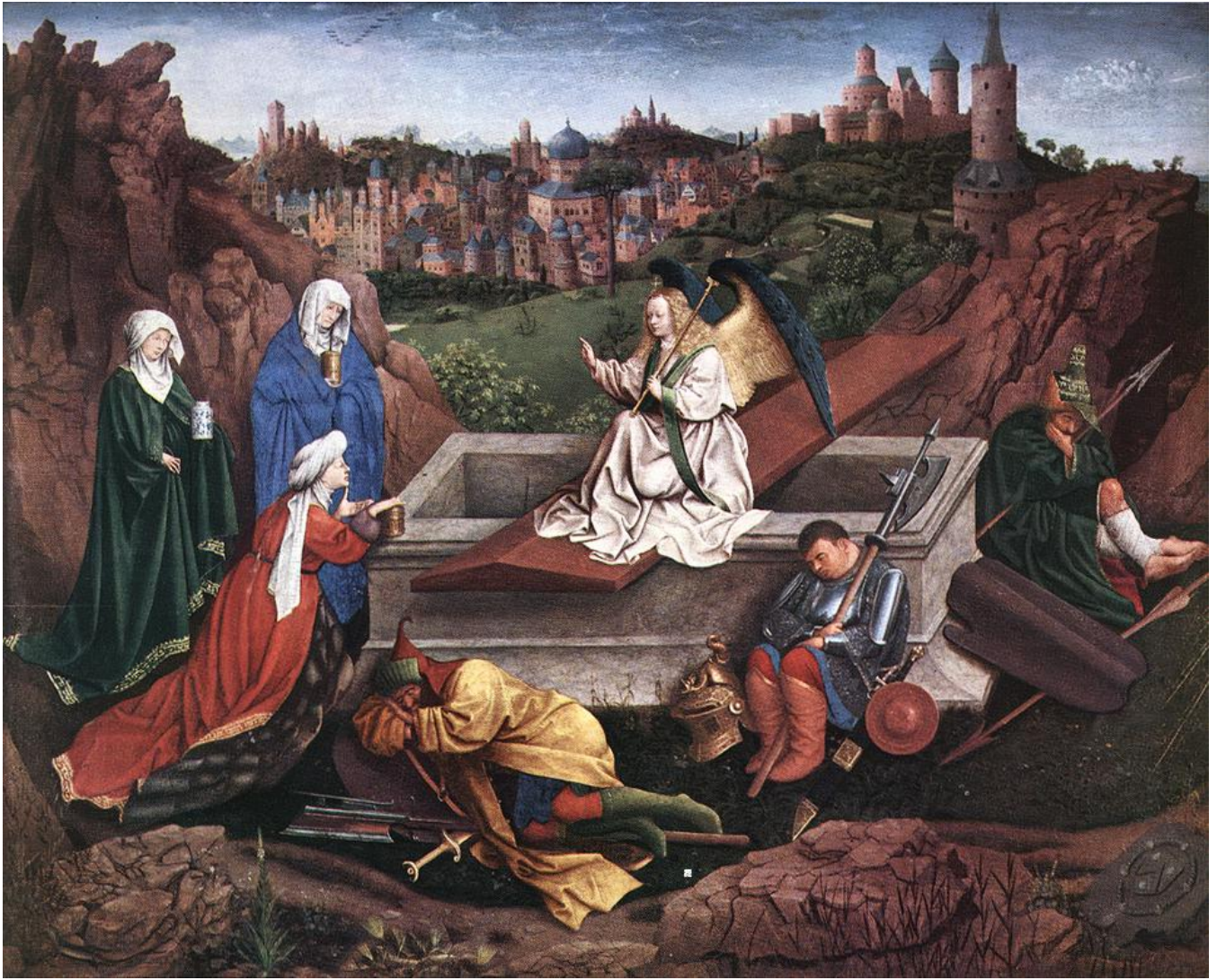
Les trois Marie devant le tombeau vide, par Jan van Eyck et Hubert van Eyck – vers 1425-1435 – Museum Boijmans Van Beuningen

«Quand le sabbat fut passé, Marie de Magdala, Marie, mère de Jacques, et Salomé achetèrent des aromates pour aller l'embaumer. Et de grand matin, le premier jour de la semaine, elles vont à la tombe, le soleil étant levé. Elles se disaient entre elles : « Qui nous roulera la pierre de l'entrée du tombeau ? » Et, levant les yeux, elles voient que la pierre est roulée ; or, elle était très grande. Entrées dans le tombeau, elles virent, assis à droite, un jeune homme, vêtu d'une robe blanche, et elles furent saisies de frayeur. Mais il leur dit : « Ne vous effrayez pas. Vous cherchez Jésus de Nazareth, le crucifié : il est ressuscité, il n'est pas ici ; voyez l'endroit où on l'avait déposé. Mais allez dire à ses