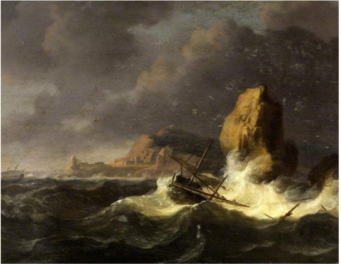
Ludolf Bakhuizen : A shipwreck (Un naufrage) – Fitzwilliam Museum © Wikimedia Commons

Ce très beau et très dense chapitre 27 des Actes des apôtres évoque avec force détails les pérégrinations de Paul et de ses compagnons au cours d'un voyage en mer pour le moins dangereux. On pourrait faire de ce chapitre une lecture allégorique : les tempêtes de la vie, la navigation dangereuse, le parcours inattendu vers des rencontres improbables qui ouvrent à une vie renouvelée... et ce ne serait pas faux : il est souvent d'une grande aide, dans les grandes étapes de nos vies, d'évoquer ces grands récits qui nous parlent de courage et d'endurance pour faire face aux épreuves.