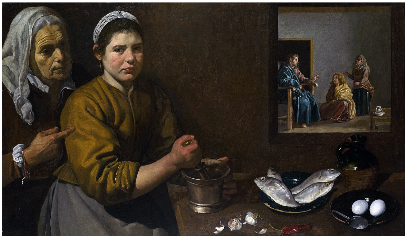
Diego Vélasquez : « Christ dans la maison de Marthe et Marie » (1618) – National Gallery de Londres

Méditation du jeudi 21 octobre. Nous prions cette semaine avec nos envoyés en Tunisie.