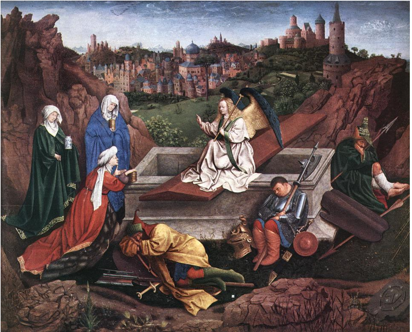
Jan et Hubert van Eyck, Les trois Marie devant le tombeau vide

« Après la fin du sabbat, Marie Madeleine, Marie mère de Jacques, et Salomé achètent des aromates pour embaumer le corps de Jésus. Tôt le matin, en ce premier jour de la semaine, au lever du soleil, elles viennent au tombeau. Elles discutent et se disent : Qui roulera la pierre pour nous, de devant l'entrée du tombeau ? Alors, levant les yeux, elles constatent que la pierre a déjà été roulée, pourtant elle était très grande. Elles entrent dans le tombeau et voient un jeune homme, assis à droite, vêtu d'un vêtement blanc. Elles sont saisies de stupeur. Il leur dit : N'ayez pas peur. Vous cherchez Jésus, celui qui vient de Nazareth, le crucifié. Mais il n'est pas là, il s'est réveillé. Regardez, voici où il avait été déposé. Mais