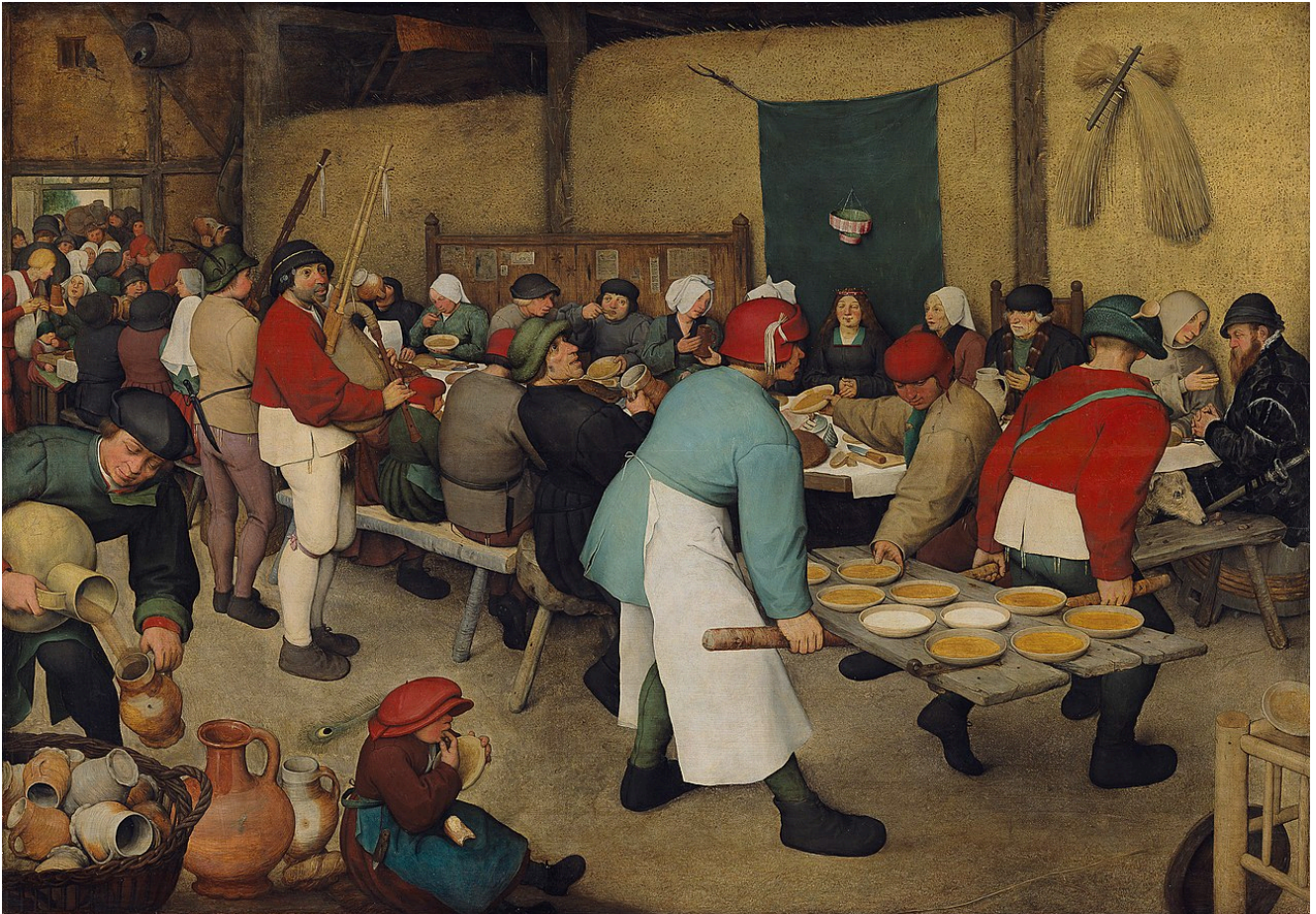
Pieter Brueghel l'Ancien : « Le Repas de noce » ou « La Noce paysanne » (1567/68)

Peut-on forcer quelqu'un à écouter ? Peut-on forcer quelqu'un à se convertir ? Un texte du Nouveau Testament, chez l'évangéliste Luc, pourrait le laisser croire. C'est ainsi, en tout cas, que Saint Augustin en a interprété une phrase énigmatique.