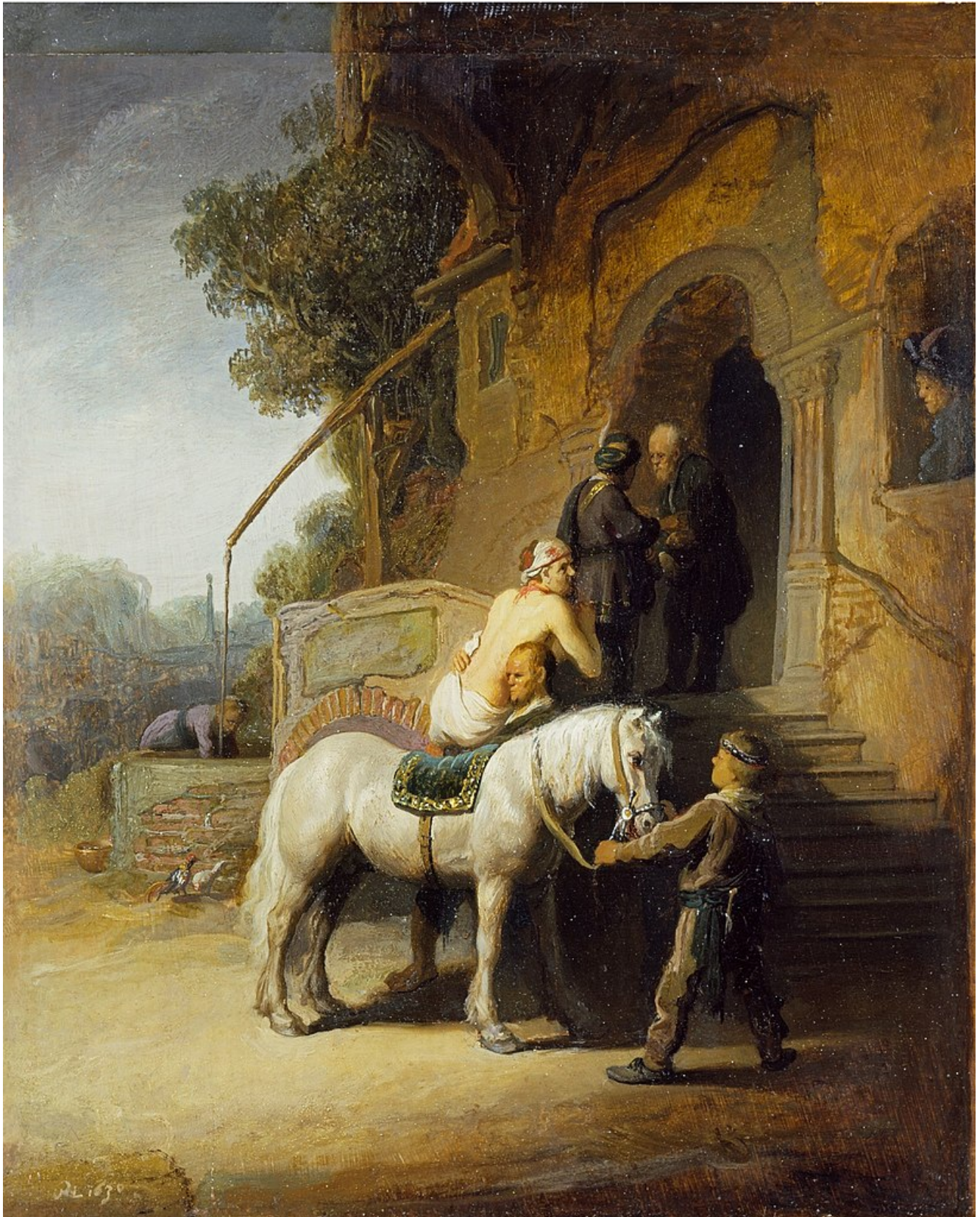
Rembrandt, Le bon Samaritain

« Le commandement le plus important, c'est : « Toi dois aimer le Seigneur ton Dieu de tout ton cœur, de tout ton être et de toute ton intelligence. » C'est le plus