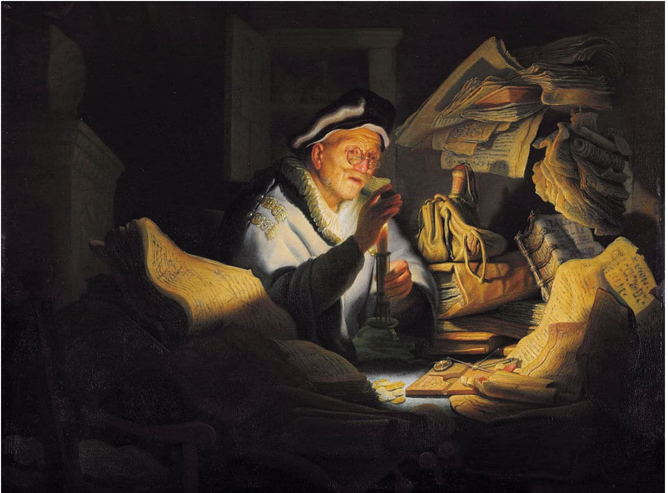
Rembrandt, La parabole de l'homme riche

Jésus vient de finir un enseignement. Ses derniers mots résonnent comme une consolation et un encouragement immense : même si vous êtes traînés devant les autorités pour votre foi, « l'Esprit saint vous enseignera au moment même ce qu'il faudra dire » (Lc 12,12). C'est dire que la parole est donnée à ceux qui croient et qu'ils peuvent faire confiance à cette parole donnée pour vivre joyeusement.