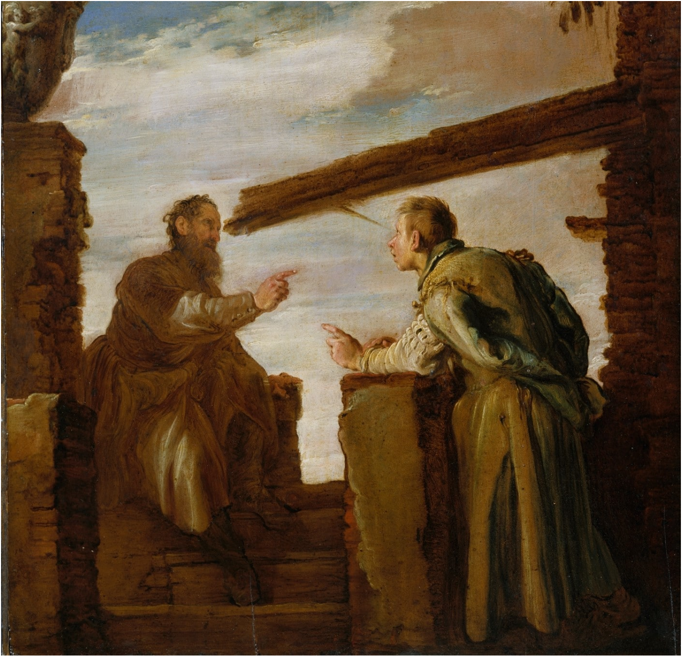
La parabole de la paille et de la poutre par Domenico Fetti (Metropolitan Museum of Art)

Pourquoi regardes-tu la paille qui est dans l'œil de ton frère, et ne remarques-tu pas la poutre qui est dans ton œil à toi ? Comment peux-tu dire à ton frère : « Mon frère, laisse-moi ôter la paille qui est dans ton œil », toi qui ne vois pas la poutre qui est dans ton œil ? Hypocrite, ôte d'abord la poutre de ton œil ! Alors tu verras comment ôter la paille qui est dans l'œil de ton frère.