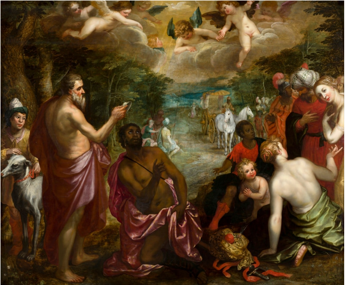
« Le baptême de l'eunuque », attribué à Brueghel le jeune © Wikimedia Commons

nous fait vivre de souffle et de liberté.