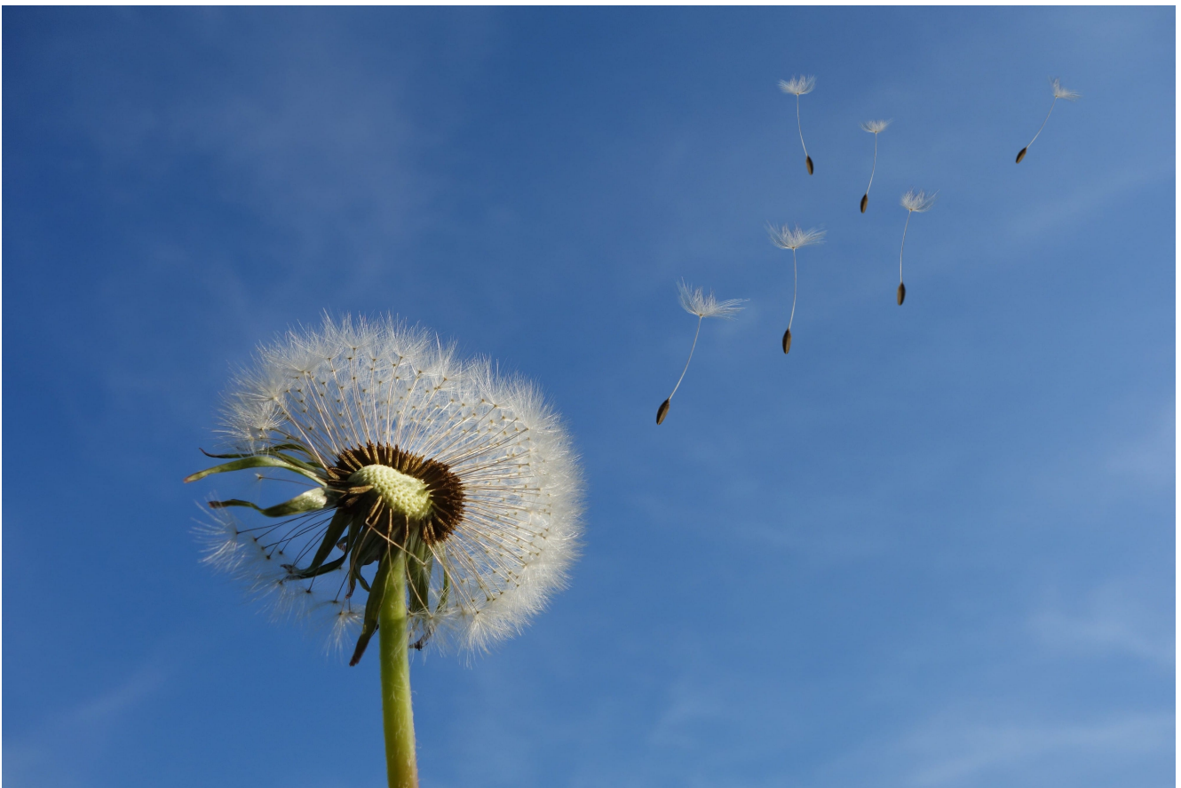
Fleur de pissenlit

Méditation du jeudi 6 janvier. Comment peut-on parler de l'universalité de l'Église, alors même qu'elle est « mise à part », sainte, distincte du monde ? Et comment vivre en témoins de cette preuve d'une autre réalité que notre réalité ordinaire – celle de la grâce de Dieu manifestée en Jésus-Christ ?