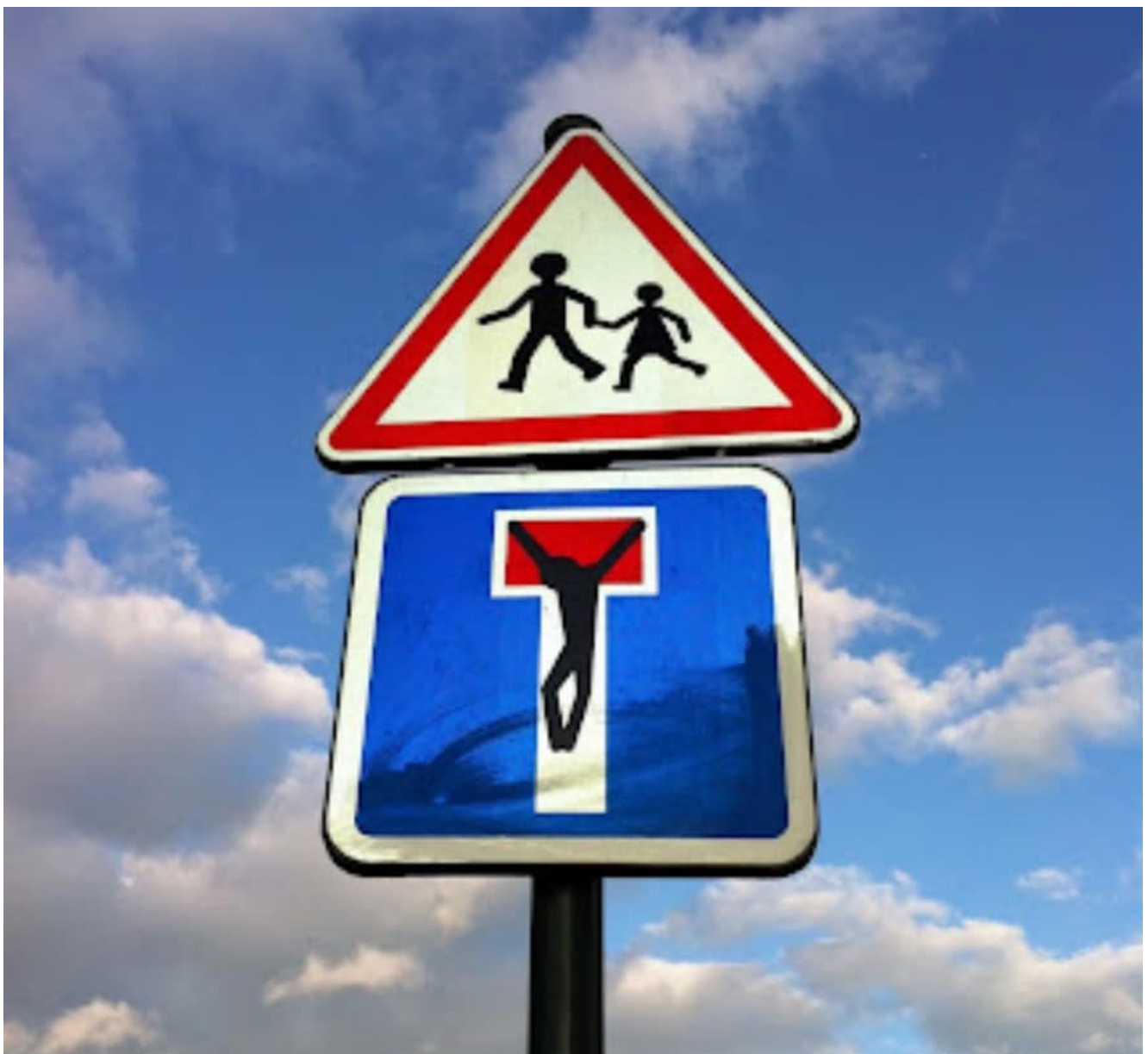
Artiste Clet Abraham

Méditation du jeudi 30 juin 2022. L'important dans la loi, dans toute loi, ce n'est pas à quoi elle nous oblige : c'est à qui elle renvoie. Celui sur qui se fonde toute confiance, celui à qui nous sommes liés par une relation de confiance. C'est cela qui nous permet d'aller chercher, dans des mots de papier, dans une loi devenue morte, le souffle d'une parole vivante.