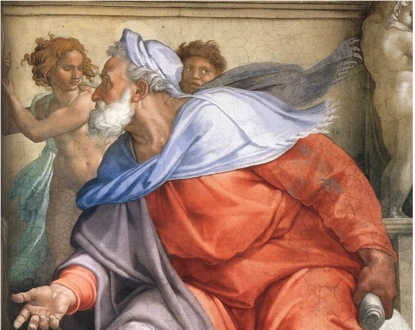
Le prophète Ézéchiel, par Michel-Ange, dans la chapelle Sixtine

Il y a une façon tout à fait étrange de traiter la Bible : c'est de la manger ! Tenez, par exemple, le prophète Ezéchiel... N'allons pas trop vite cependant pour en tirer la conclusion que Dieu nous appelle à manger nos bibles, il faut faire le détour par l'histoire du bonhomme pour comprendre de quoi tout cela retourne.