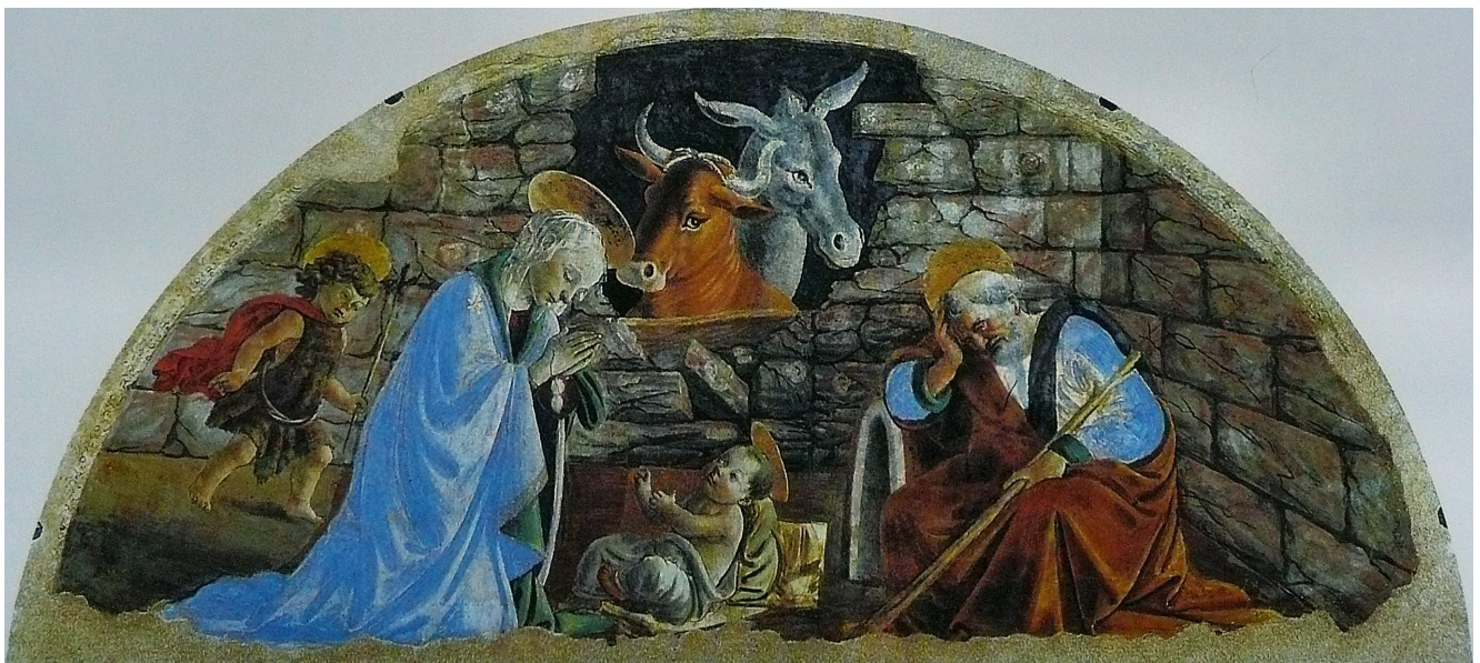
« La Nativité », fresque de Sandro Botticelli (vers 1476-1477)

Méditation du jeudi 16 décembre. En ce temps d'avant Noël, évitons le trop-plein : conservons du vide, de l'espace que Dieu puisse remplir. Noël, c'est Dieu qui vient, mais ni de la manière, ni là où nous l'attendions.