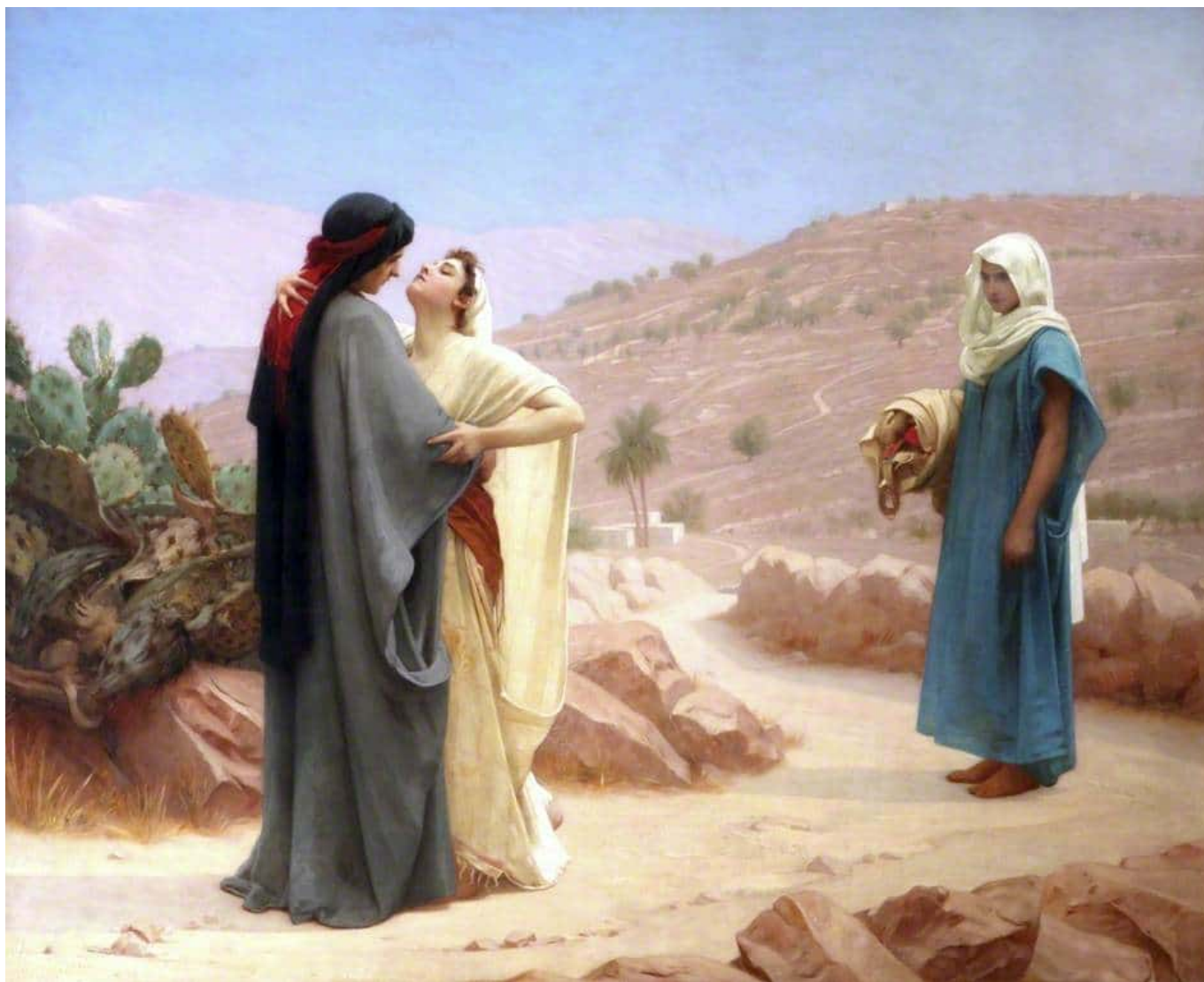
Ruth et Naomi, peinture de Philip Hermogenes Calderon (1886)

Dans notre société de migrations, où les mariages mixtes sont nombreux, l'exemple de Ruth la Moabite nous parle d'une intégration couronnée de succès. Ruth appartient à un peuple considéré comme étranger par Israël, mais qui résulte de l'inceste du patriarche Lot avec une de ses filles au temps de Sodome. Or elle a épousé un des deux fils de Naomi et d'Elimélec, venus de Bethléem à Moab pour cause de famine. Une certaine Orpa a épousé l'autre fils.