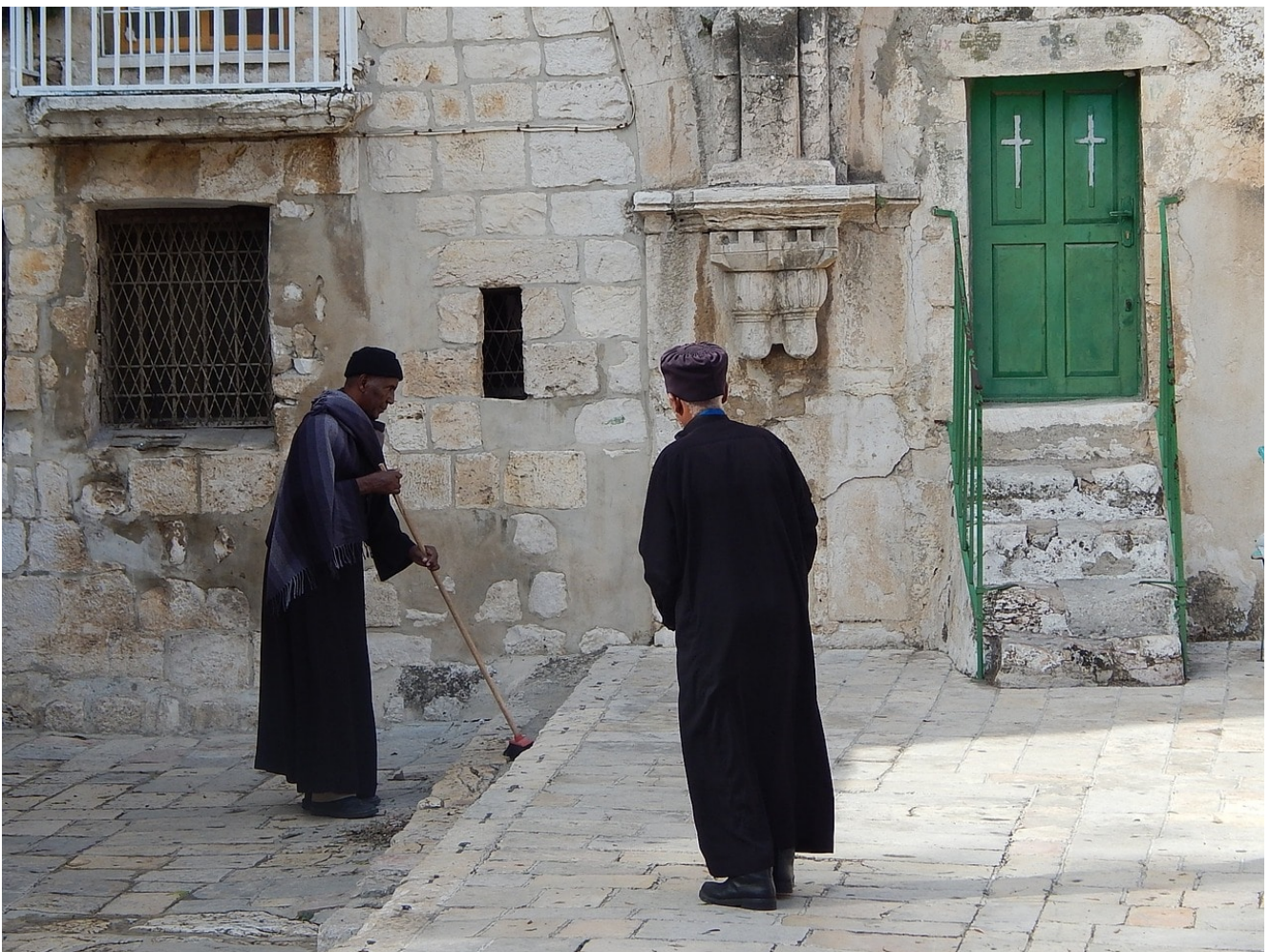
Coptes à Jérusalem

Méditation du jeudi 11 avril 2019. En cette semaine de la passion nous prions pour nos envoyés au Burkina Faso.