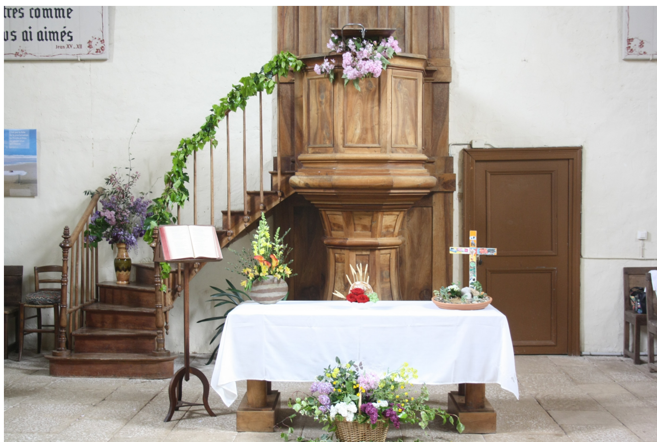
Temple de l'Église Protestante Unie de Lezay