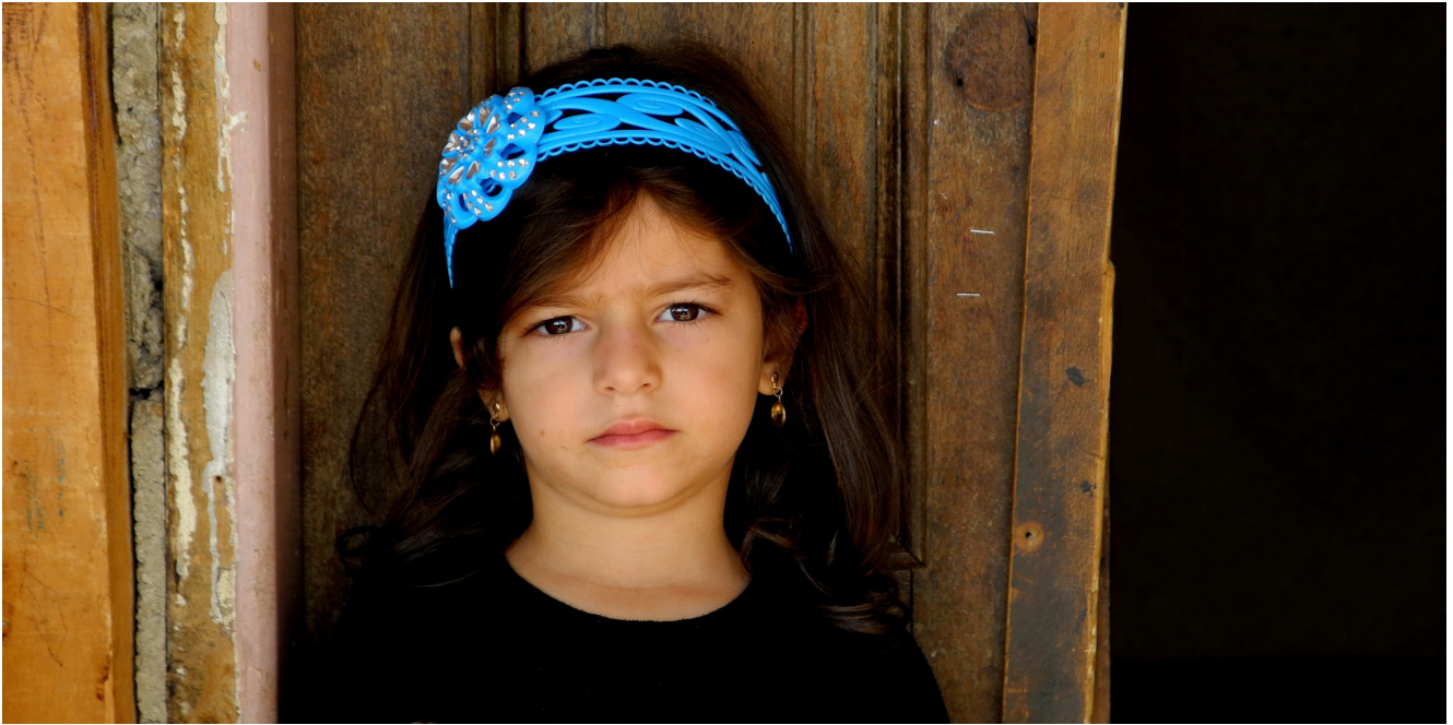
Photo d'ouverture : cette fillette fait partie d'une famille chrétienne qui a dû fuir la Syrie vers le Liban – octobre 2015