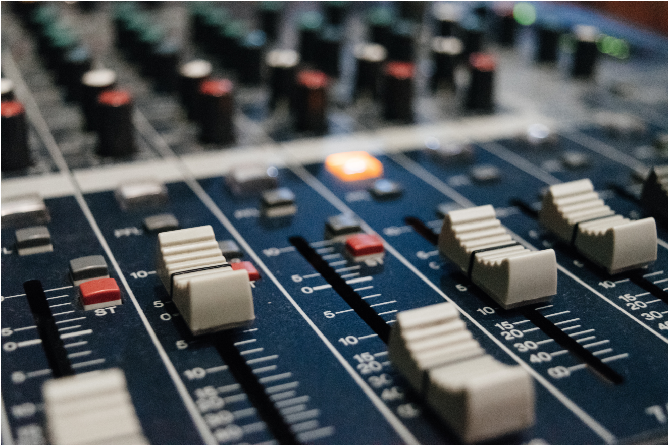
Illustration pour Carême Protestant © EPUdF

Carême et protestantisme semblent ne pas vraiment aller ensemble, si on l'envisage de manière stricte et sous la forme d'un jeûne, et associer les deux termes comme le fait Carême protestant dans une série de conférences diffusées chaque année sur France Culture ne peut qu'impliquer une pratique bien différente.