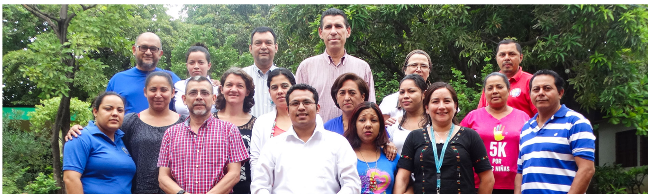
L'équipe du CIEETS

De la révolution sandiniste qui renversa la dictature jusqu'à l'actuelle dérive autoritaire du président Ortega, l'aventure du réseau d'Églises dont est issu le CIEETS s'est forgée à travers les aléas de l'histoire du Nicaragua. Avec dès le début des relations étroites avec les protestants de France, à travers la figure de Georges Casalis, et une constante : être auprès des plus démunis, en faisant de la théologie un instrument de libération spirituelle et sociale.