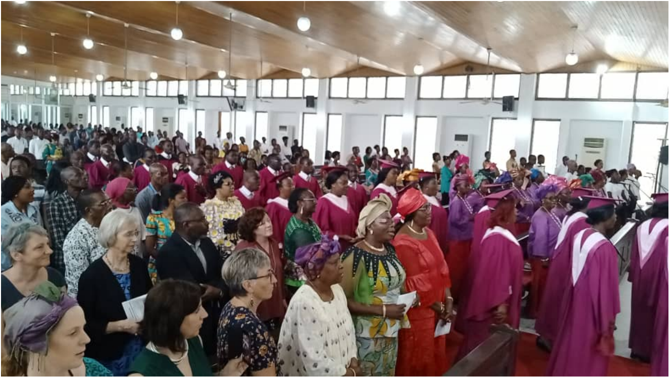
Culte de clôture des Coordinations Cevaa