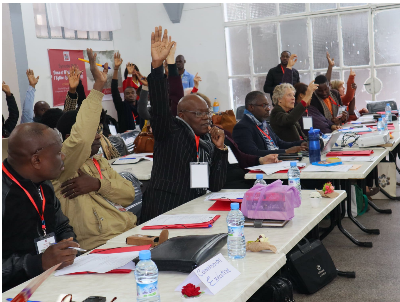
Vue du synode national 2019 de l'EEAM, Casablanca, novembre 2019

en plein essor, dans un pays lui aussi en plein développement, notamment en matière de démographie. En effet, pour tout un ensemble de raisons, le Maroc est passé de 8 millions d'habitants en 1957 à 38 millions en 2018. Les défis sont multiples, et l'un d'entre eux, non des moindres, est l'accueil des migrants, lesquels sont en croissance exponentielle ces dernières années.