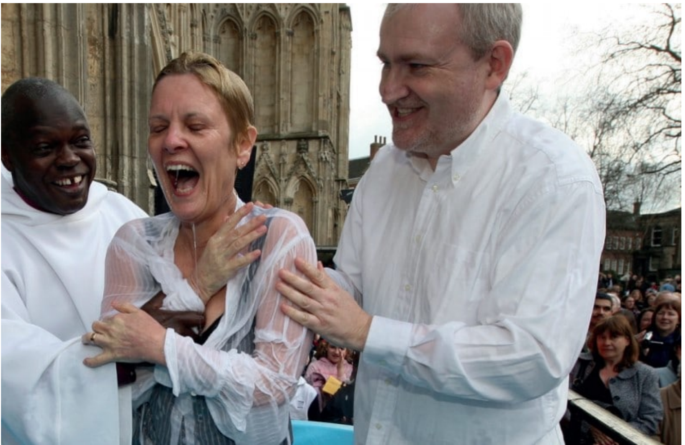
Photo de couverture du n°80 de Perspectives Missionnaires « Que signifie l'expression tant débattue des « racines chrétiennes de l'Europe » ? Quel regard peuvent porter des missionnaires étrangers sur le contexte européen que l'on dit « déchristianisé » ? Et cette prétendue « déchristianisation », ne serait-elle pas l'envers d'une christianisation largement fantasmée ? Quelles nouvelles voies la mission devrait-elle emprunter en France et en Europe et quel public «