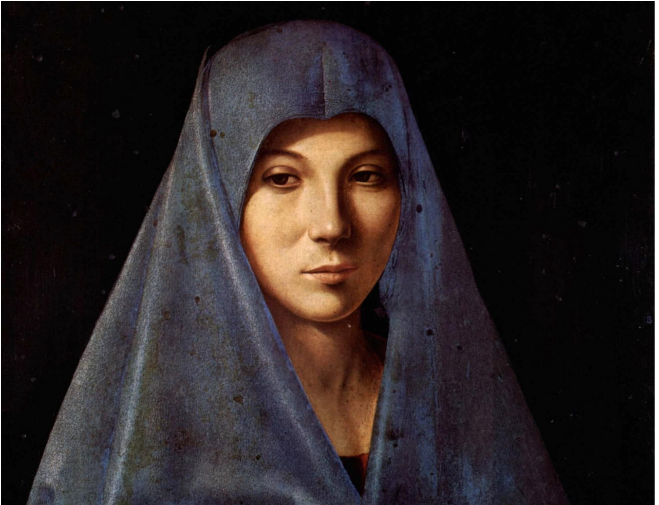
La Vierge de l'Annonciation – Antonello de Messine, vers 1475 – Galleria Regionale della Sicilia (Palermo)

Au sixième mois, l'ange Gabriel fut envoyé par Dieu dans une ville de Galilée du nom de Nazareth, chez une vierge fiancée à un homme du nom de Joseph, de la maison de David ; le nom de la vierge était Marie. Il entra chez elle et dit : Réjouis-toi, toi qui es comblée par la grâce ; le Seigneur est avec toi. Très troublée par cette parole, elle se demandait ce que pouvait bien signifier une telle salutation. L'ange lui dit : N'aie pas peur, Marie ; car tu as trouvé grâce auprès de Dieu. Tu vas être enceinte ; tu mettras au monde un fils et tu l'appelleras du nom de Jésus. Il sera grand et sera appelé Fils du Très-Haut, et le Seigneur Dieu lui donnera le trône de David, son père. Il régnera pour toujours sur la maison de Jacob ; son règne n'aura pas de fin.