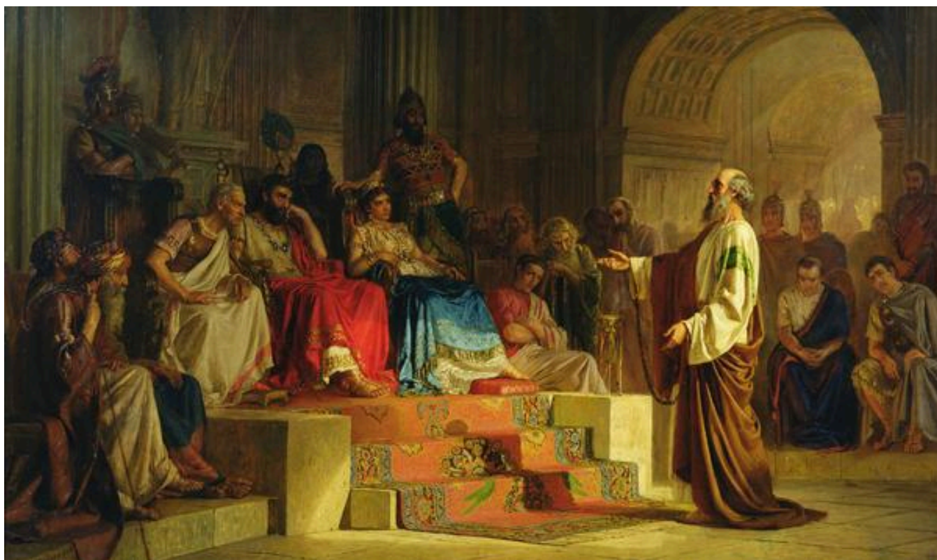
Nikolai Bodarevsky, Le procès de Paul (1875), musée ukrainien

Une année avec les Actes des apôtres : méditation du jeudi 25 avril 2021. Cette semaine, nous prions avec notre envoyée au Burundi.