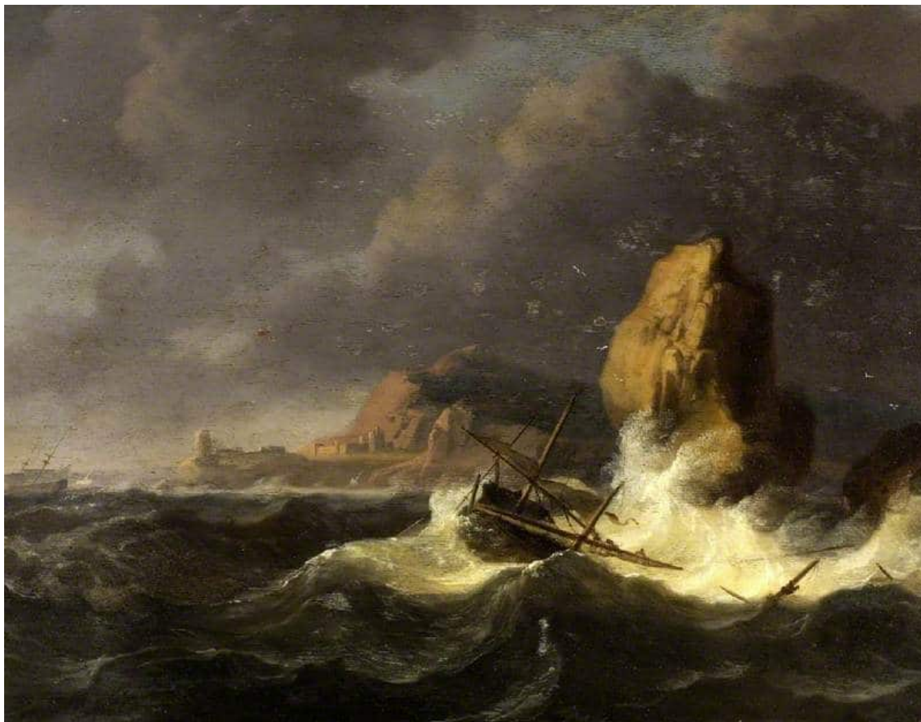
Ludolf Bakhuizen : A shipwreck (Un naufrage) – Fitzwilliam Museum

Une année avec les Actes des apôtres : méditation du jeudi 6 mai 2021. Cette semaine, nous prions avec nos envoyés à Madagascar.