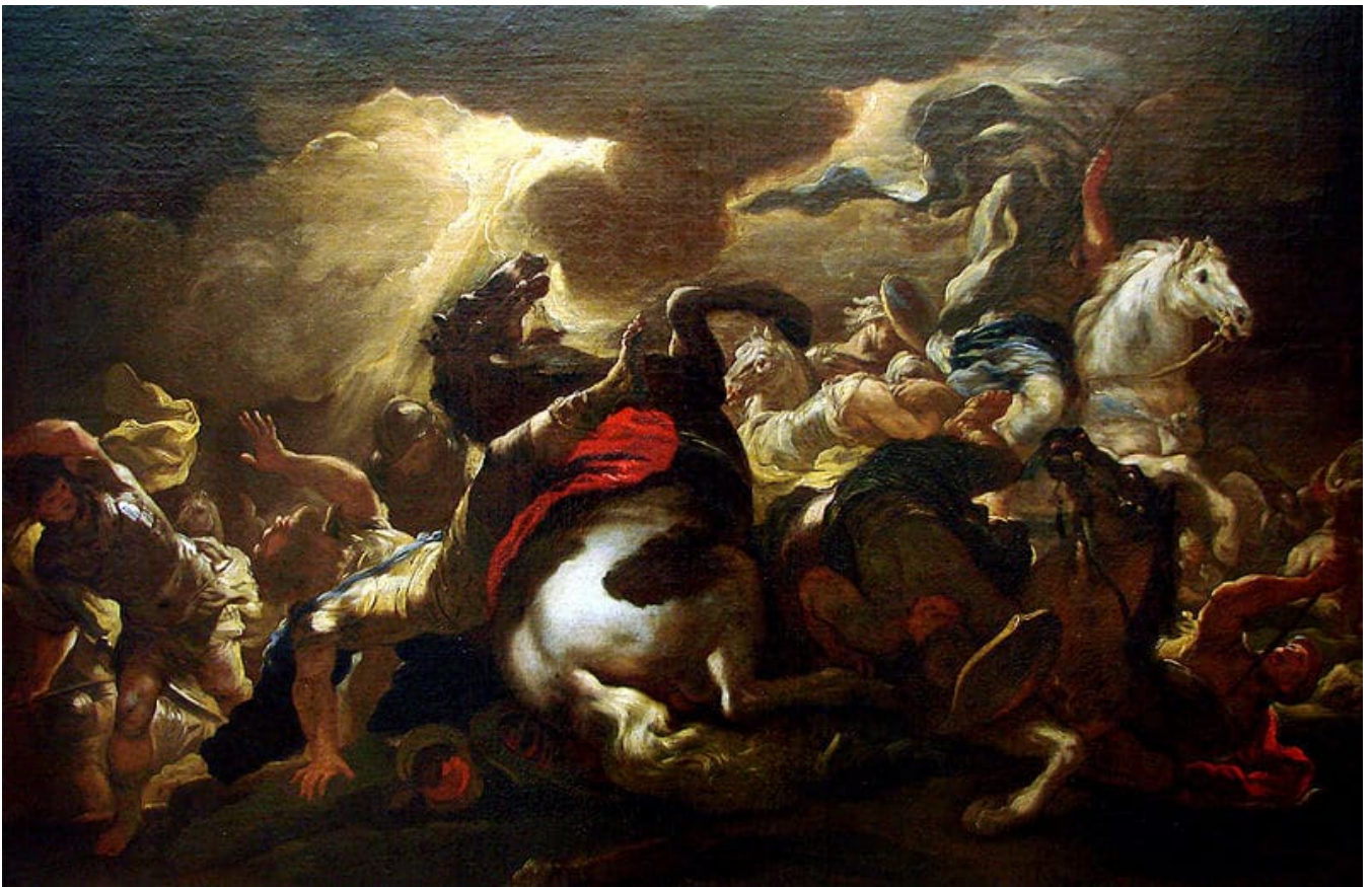
La Conversion de Saint Paul sur le chemin de Damas par Luca Giordano (vers 1690)

Une année avec les Actes des apôtres : méditation du jeudi 18 mars 2021. Cette semaine, nous prions avec nos envoyés au Brésil.