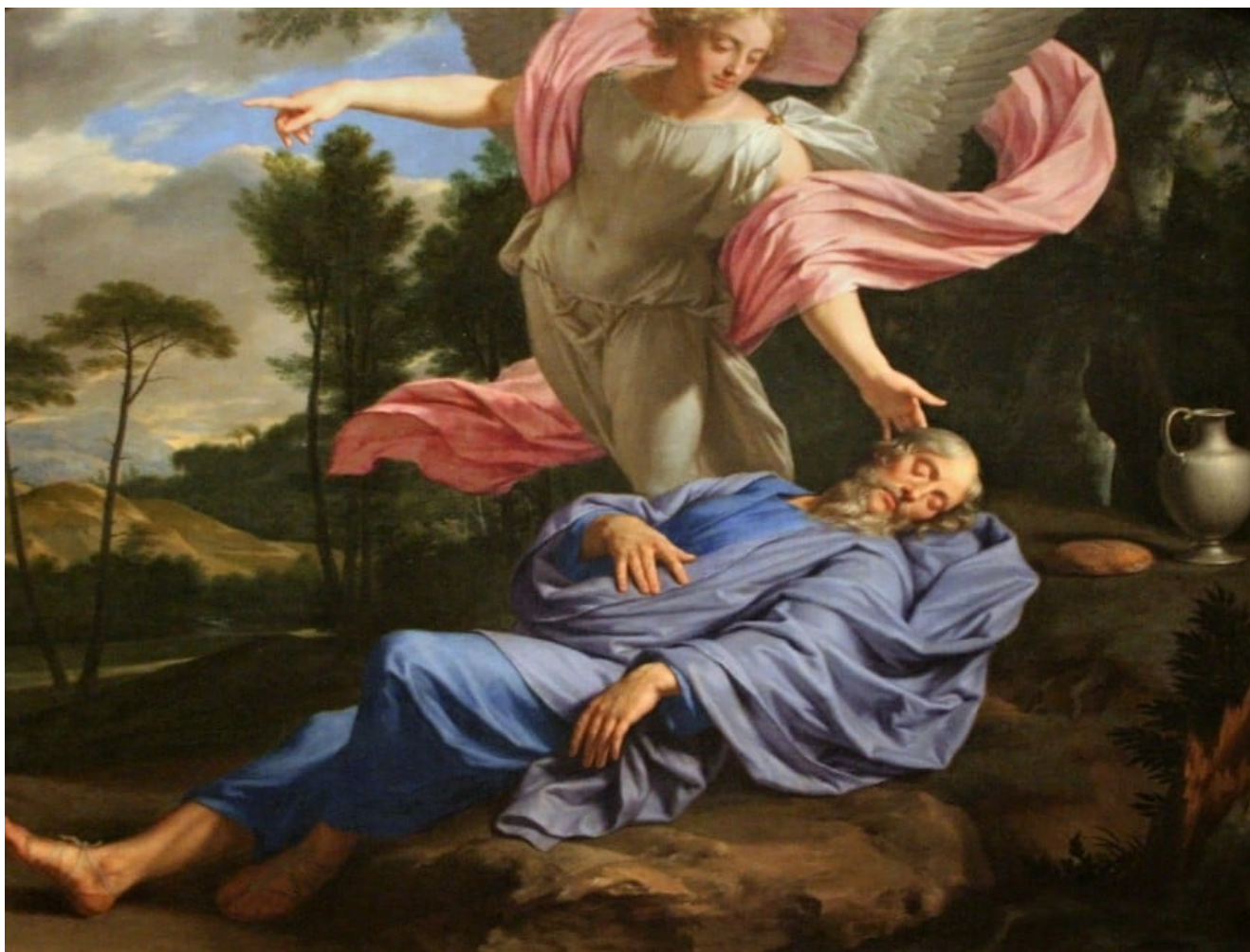
Philippe de Champaigne : « Le sommeil d'Élie »

Méditation du jeudi 13 janvier. Comment nous sentirions-nous à la place d'Élie, qui après avoir agi avec zèle, puis avoir dû fuir ses ennemis dans le désert, se sent si désespéré qu'il veut mourir... et à qui Dieu répond : « Lève-toi et mange, car tu devras faire un long voyage ! » Et si ça ne s'arrêtait jamais ? S'il fallait toujours se relever et repartir ?