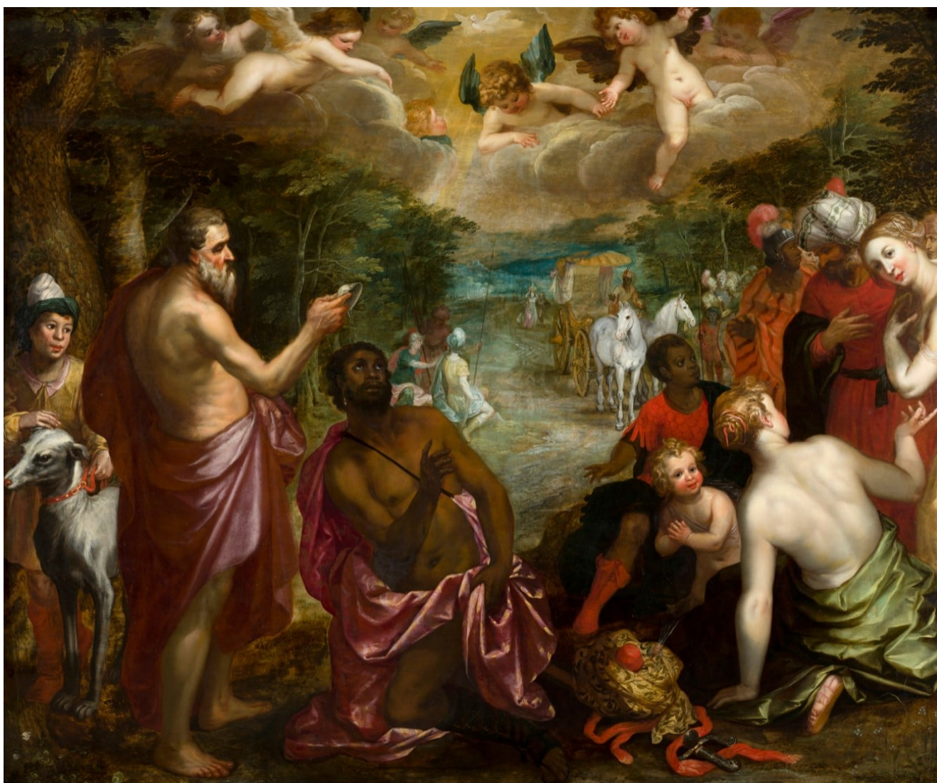
« Le baptême de l'eunuque », attribué à Brueghel le jeune

est donnée, chaque jour, comme ce qui nous anime et nous fait vivre de souffle et de liberté.