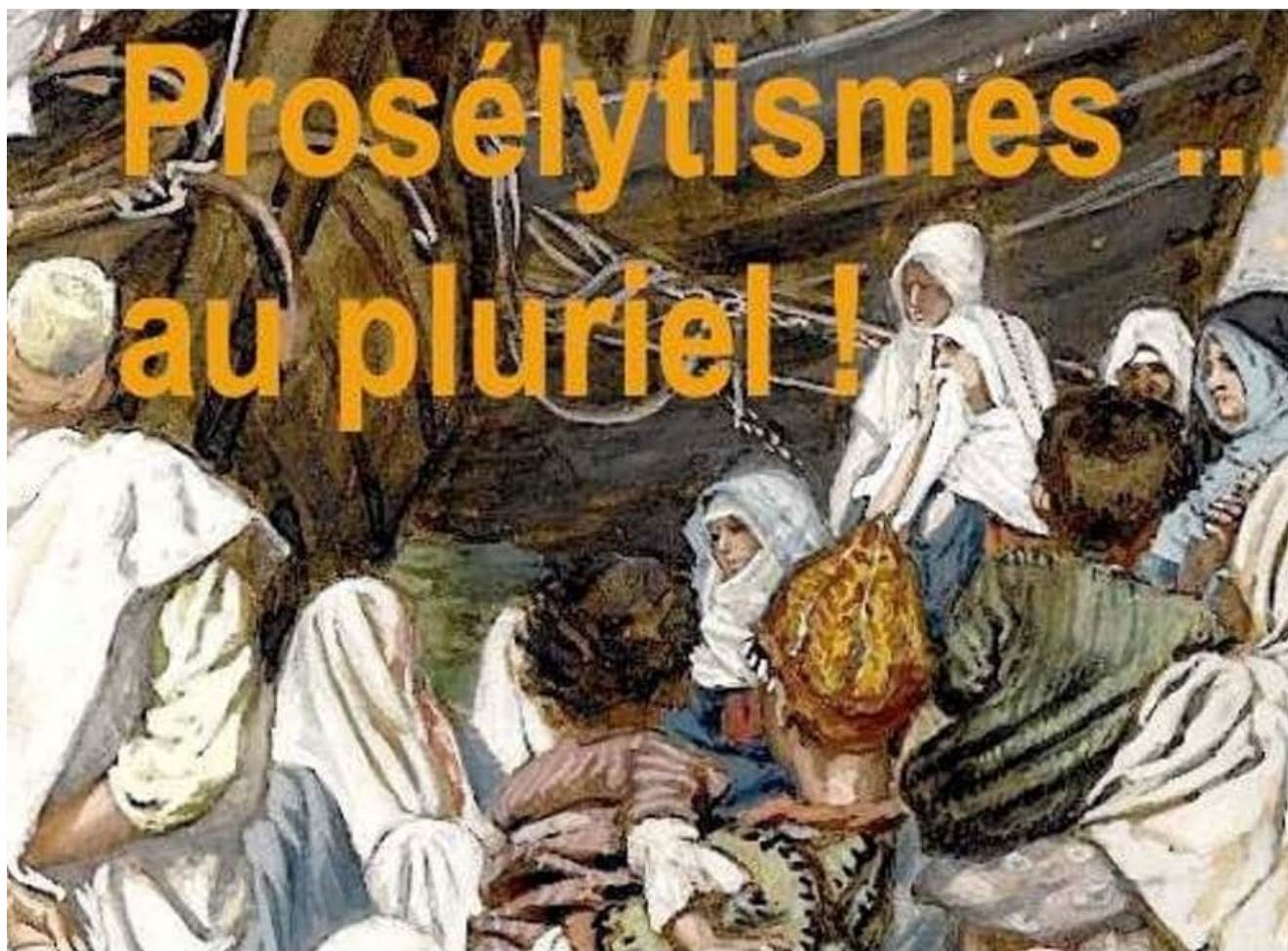
Photo illustrant le dossier « prosélytismes... au pluriel », dans le Cahier d'études missiologiques et interculturelles de Foi & Vie, reprise du n°82 de Perspectives Missionnaires