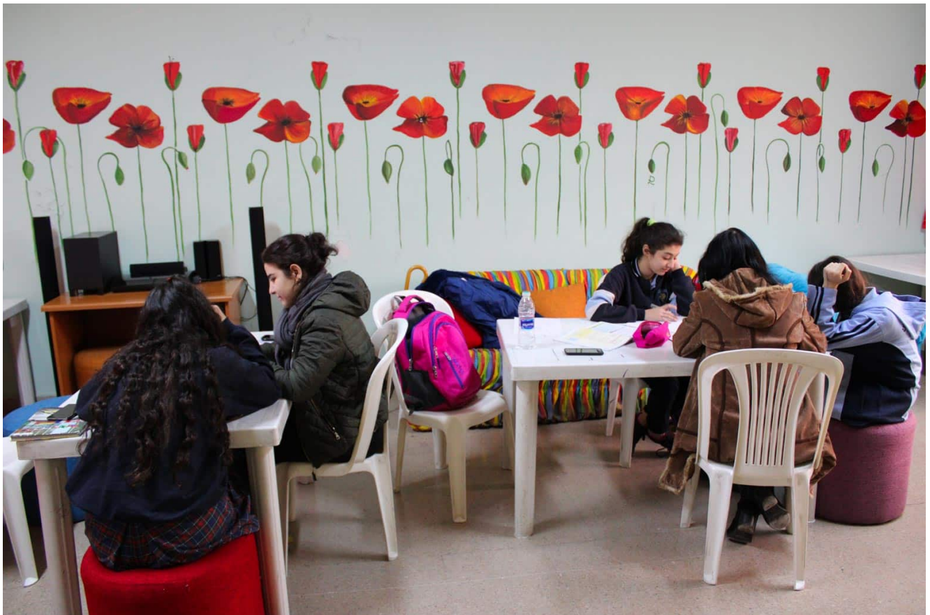
Aide scolaire au Centre d'Action Sociale de Bourj Hammoud

Seigneur, avec espérance nous te remettons tous ceux qui œuvrent pour la paix, la justice et la vérité.