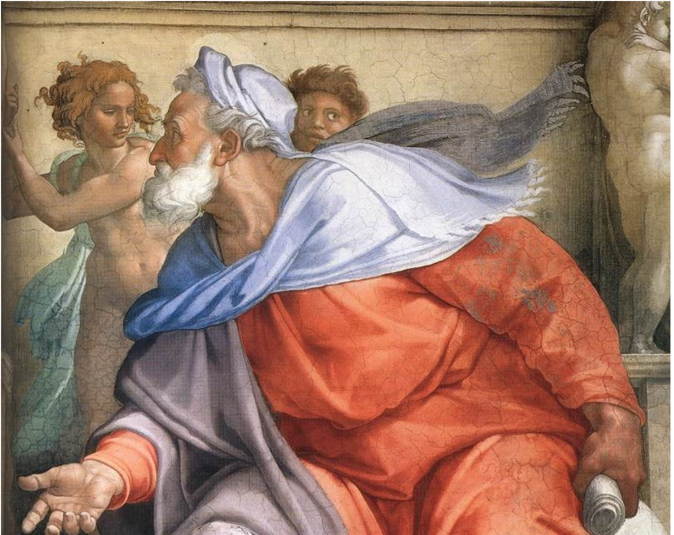
Le prophète Ézéchiël, par Michel-Ange, dans la chapelle Sixtine

Il y a une façon tout à fait étrange de traiter la Bible : c'est de la manger ! Tenez, par exemple, le prophète Ezéchiël... N'allons pas trop vite cependant pour en tirer la conclusion que Dieu nous appelle à manger nos bibles, il faut faire le détour par l'histoire du bonhomme pour comprendre de quoi tout cela retourne.