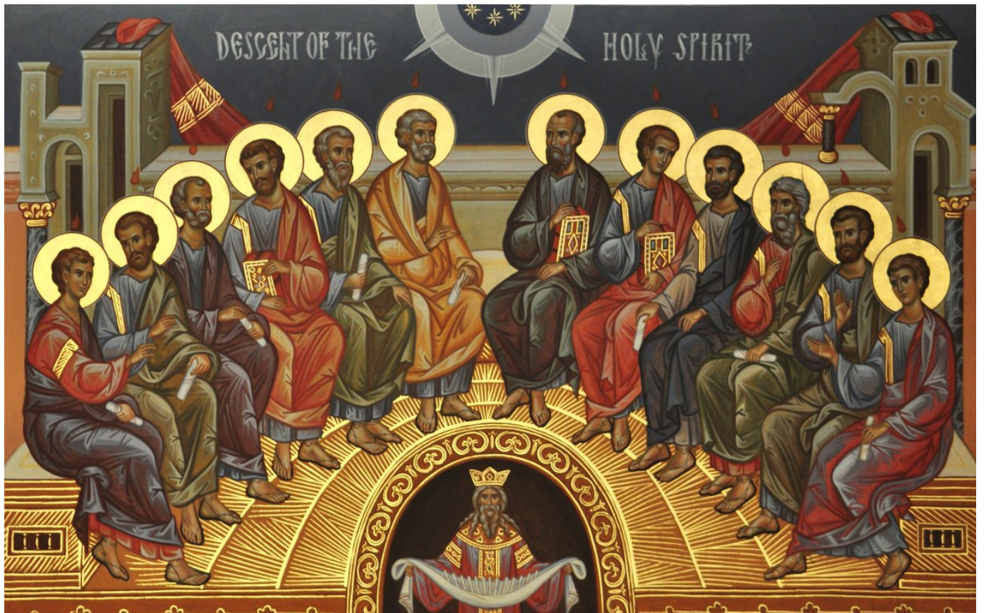
La Pentecôte vue dans l'iconographie orthodoxe : monastère Saint Tikhon, Pennsylvanie

Réunis pour célébrer le don de la Torah à Moïse sur le Mont Sinaï, les disciples vont bénéficier d'un nouveau don, annoncé par Jésus : celui de l'Esprit Saint. Celui-ci est mentionné plusieurs fois dans l'Ancien Testament ; il est comme un souffle, un vent, porteur de la Parole de Dieu. Au moment du baptême de Jésus il s'est manifesté sous forme de colombe. Aux disciples il va octroyer, de manière miraculeuse, le charisme des langues.