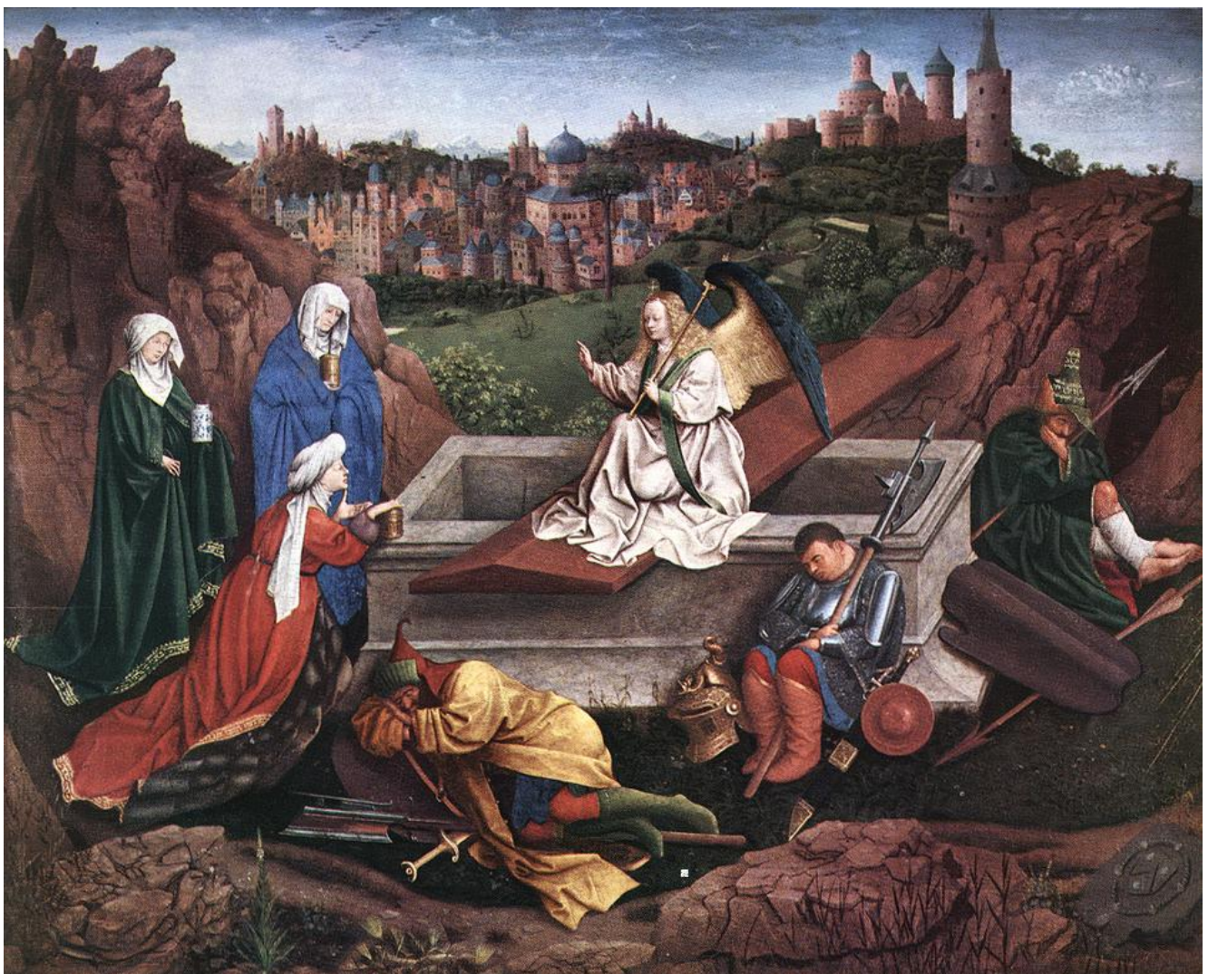
Les trois Marie devant le tombeau vide, par Jan van Eyck et Hubert van Eyck

Elles se souvinrent alors des paroles de Jésus. A leur retour du tombeau, elles annoncèrent tout cela aux onze et à tous les autres. Luc 24,1-9