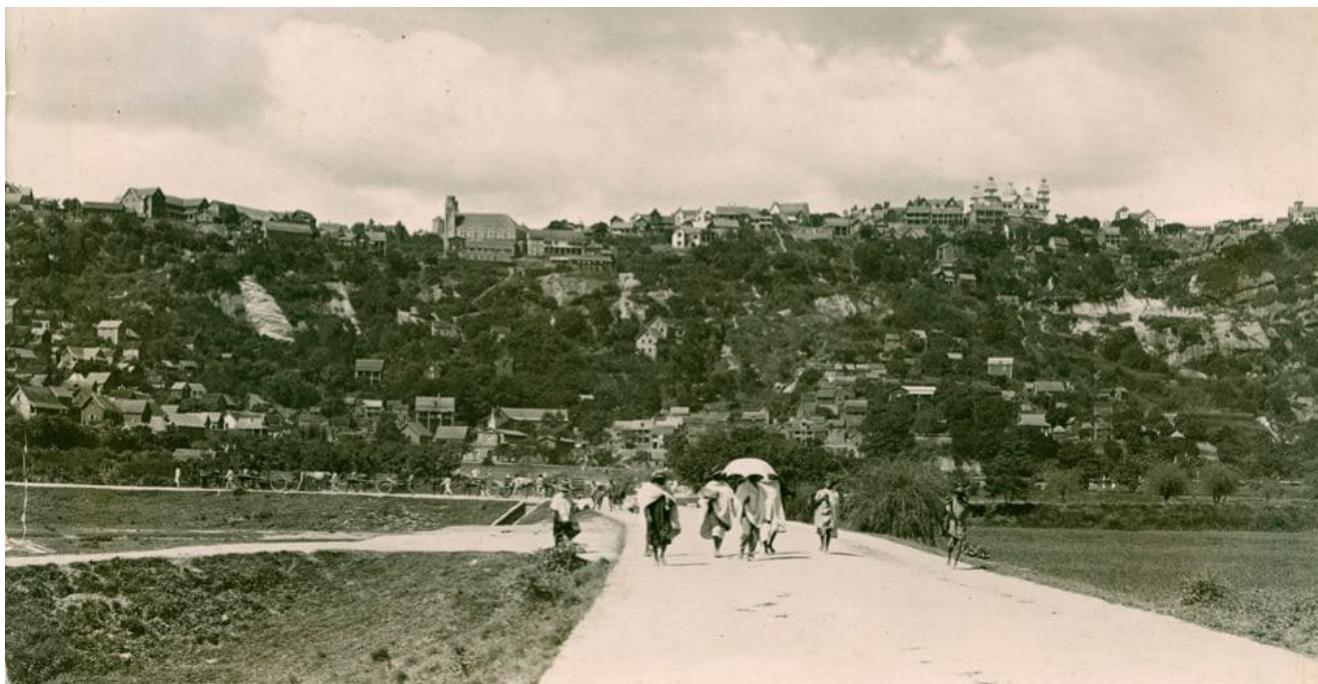
Panorama de Tananarive dans les années 1920 à 1950