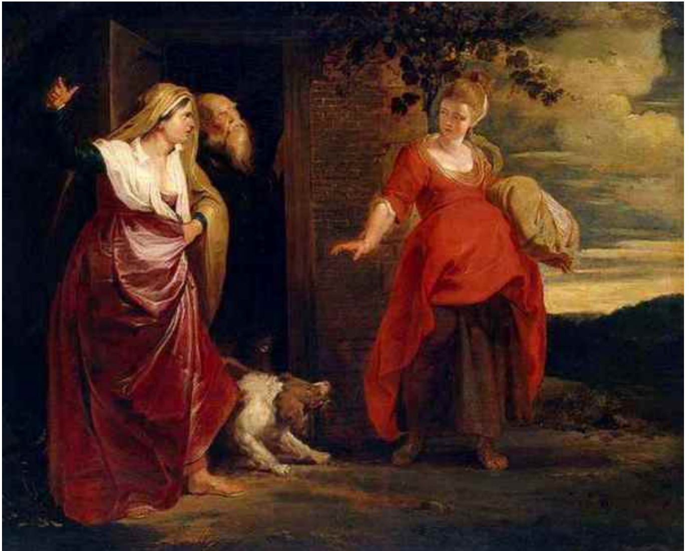
Sara et Hagar. Peinture de Rubens (1577-1640)

Méditation du jeudi 18 juillet 2019. Nous continuons nos rencontres de diverses femmes de la Bible, avec Sara et Hagar.