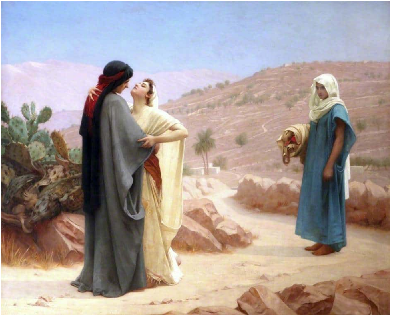
Ruth et Naomi, peinture de Philip Hermogenes Calderon (1886)

loin de toi ! Où tu iras j'irai, où tu demeureras je demeurerai. Ton peuple sera mon peuple, et ton Dieu sera mon Dieu. Où tu mourras je mourrai, et j'y serai enterrée. Ruth 2,16-17