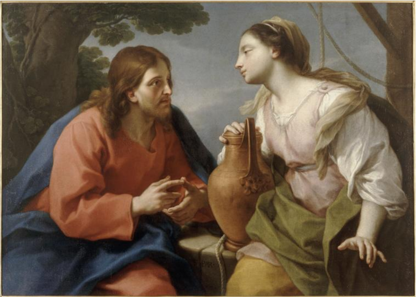
Jésus et la Samaritaine. Peinture d'Étienne Parrocel (1696–1775) © Wikimedia Commons

Laisse-toi trouver par Celui Qui est le visage de ton humanité ! Et tu te sauras à jamais enfant de l'Esprit !