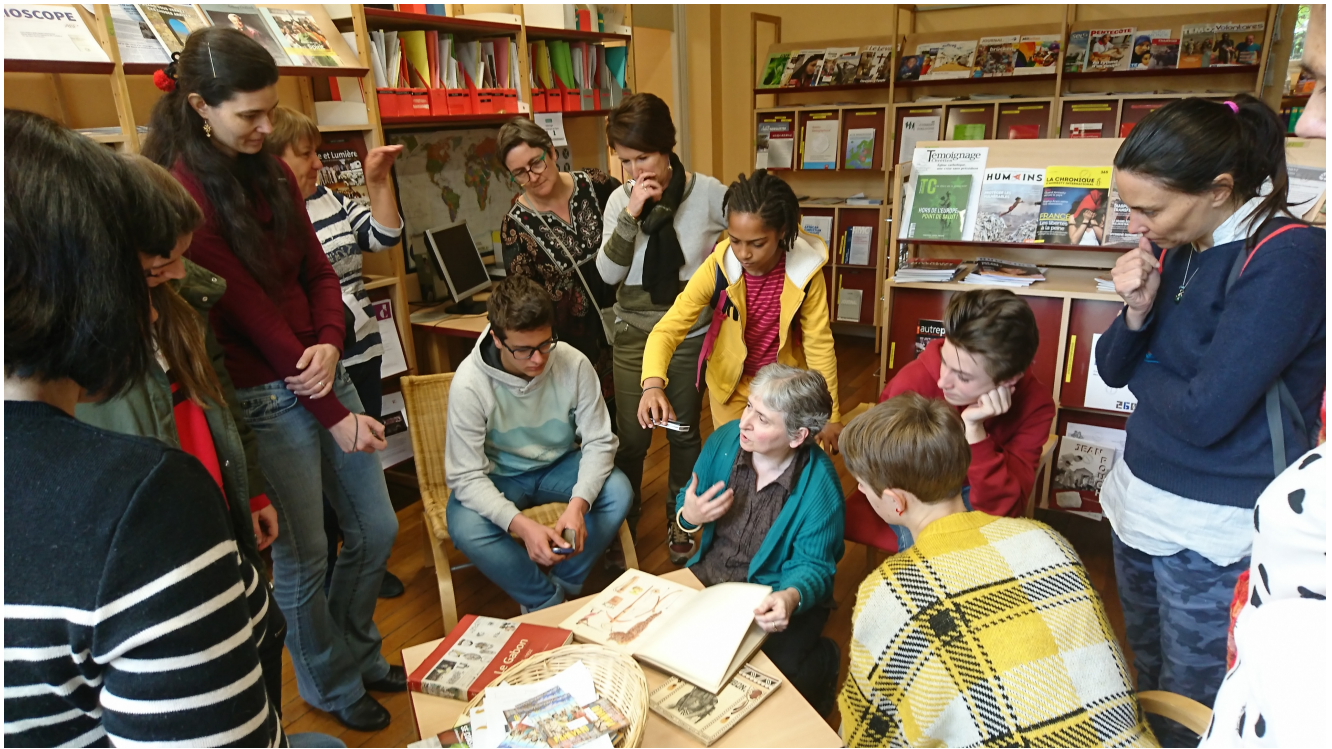
Visite de groupe au Défap en avril 2019 : découverte de la bibliothèque