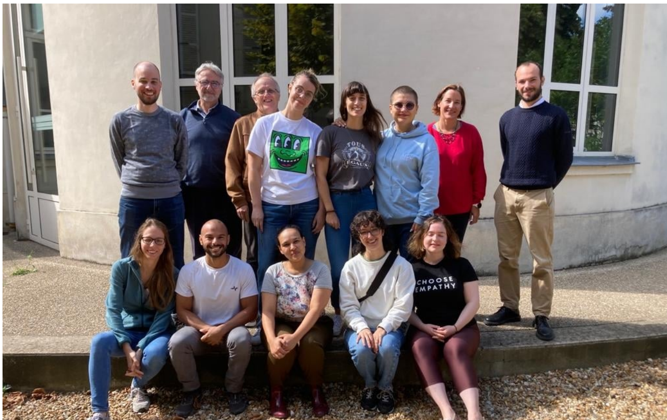
Quelques-uns des participants et intervenants de l'édition 2023 d'Alternative théologie

théologie autrement » s'est déroulée du 25 au 30 août 2023 à Paris sur le thème : « Résister face aux injustices ». Elle était organisée par l'Église protestante unie de France (EPUdF) et l'Institut protestant de théologie (IPT) en collaboration avec le Défap.