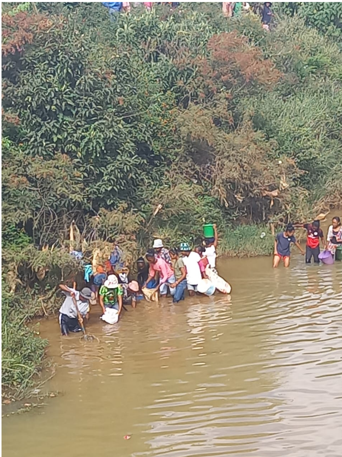
Les habitants d'Andranovelona allant chercher du sable à la rivière pour le mortier destiné aux fondations du dispensaire