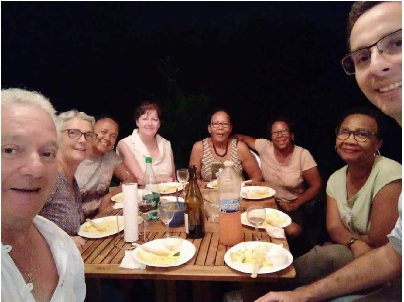
Dîner avec les membres de la paroisse après une étude biblique

Nous sommes arrivés en Guadeloupe mercredi après-midi le 19 avril, par un soleil radieux. Venant du Québec, il n'y a pas de décalage horaire, seule la fatigue de 5 heures d'avion. Nous avons été accueillis, mon épouse et moi, par la secrétaire du conseil presbytéral, Fanny, au volant de la voiture de paroisse.