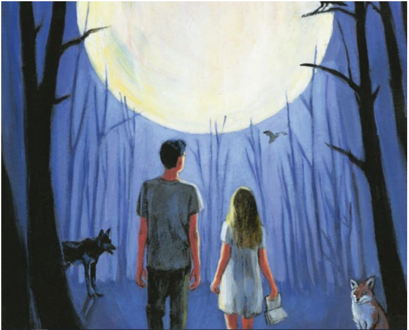
Détail de l'affiche des 7èmes « Nuits de la lecture », créée par l'artiste Aude Samama

Après l'amour en 2022, les Nuits de la lecture se tournent vers un autre genre de sensations fortes, puisque le thème choisi pour la 7ème édition est celui de la peur... Créées en 2017 par le ministère de la Culture pour promouvoir le livre et la lecture, elles sont aujourd'hui organisées par le Centre national du livre (CNL). Elles fédèrent chaque année plusieurs milliers d'événements en France, portés par les professionnels du livre et les lecteurs. Cette année le Défap y participe et a choisi pour thème « Peur de l'autre ».