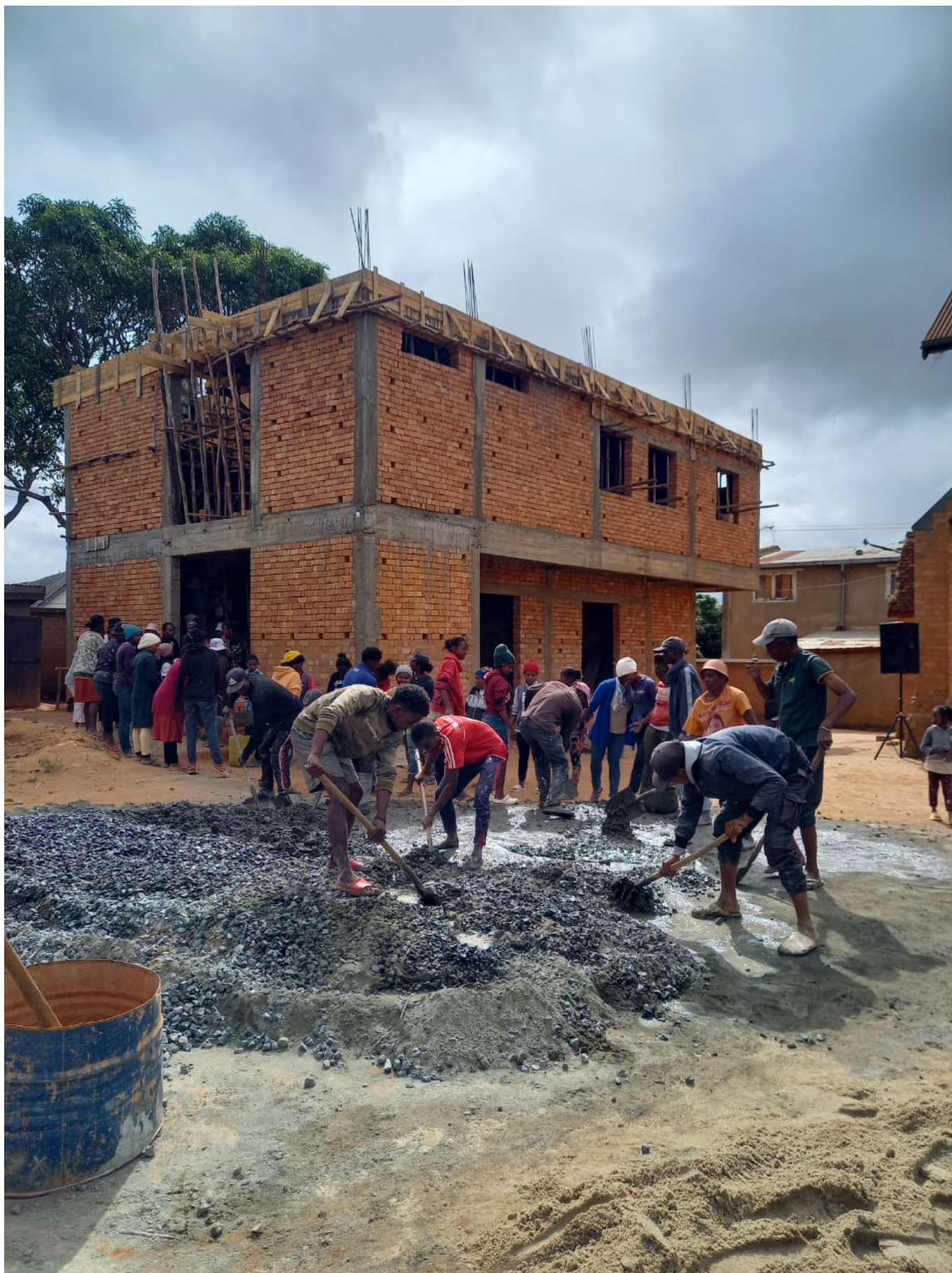
Le chantier du dispensaire Quand est prévu le voyage ?