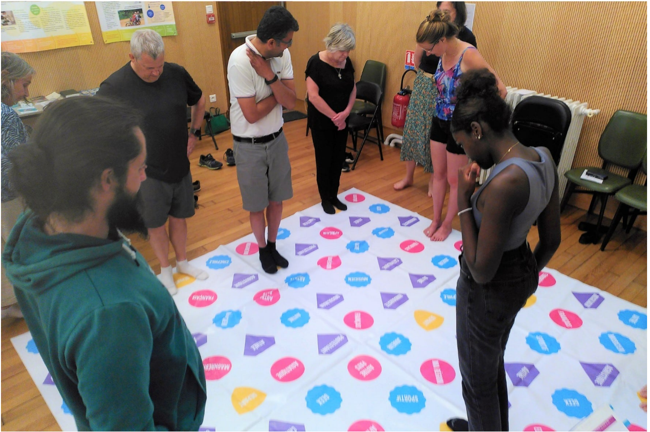
Les futurs animateurs pendant la session de formation au Défap