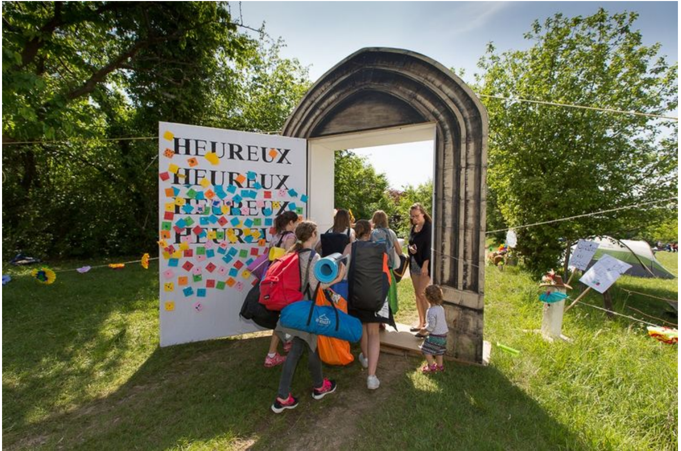
Photo extraite de la page Facebook de « La Parole est dans le Pré », le grand rassemblement des jeunes de l'UEPAL © UEPAL

Avant les tentes, les matelas de camping et les soirées à la belle étoile ; avant les bêtes qui piquent, les herbes qui démangent et les discussions théologiques en forme de poil à gratter autour des feux de camp, ça s'active ferme au sein des équipes chargées de l'organisation de « La Parole est dans le Pré » (« PdP » pour les initiés). Facebook bourdonne de posts et de photos de jeunes et bénévoles en plein travail, entre extraits musicaux pour donner l'eau à la bouche aux futurs participants et conseils avisés sur le « dress code » officiel de l'opération (à savoir : bottes et chapeau de paille). Le thème de cette édition 2022 : Choisis la vie !