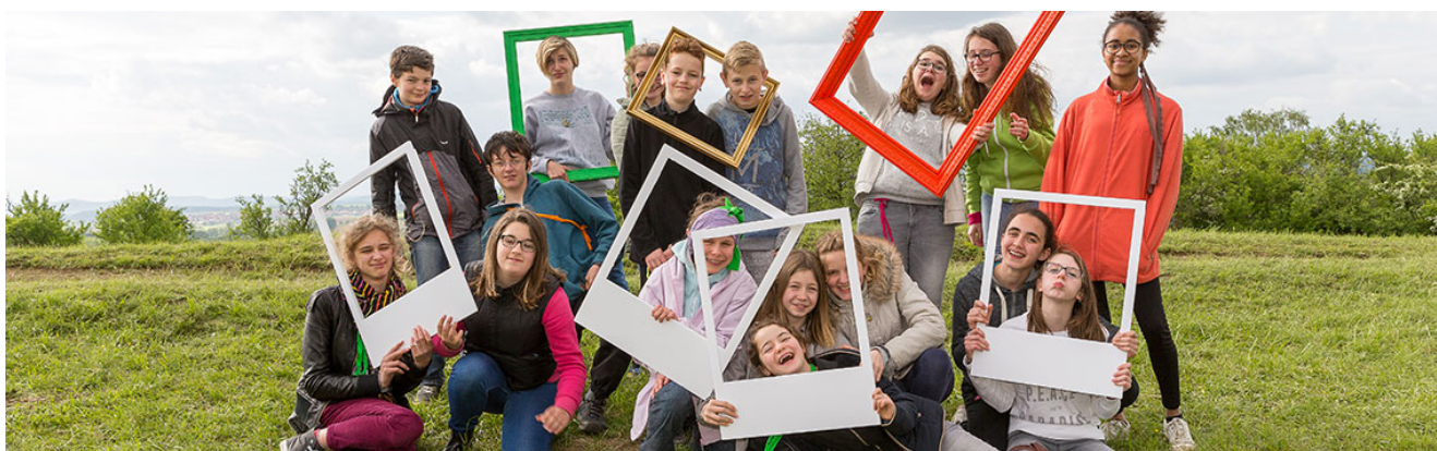
Illustration pour « La Parole est dans le Pré », le grand rassemblement des jeunes de l'UEPAL