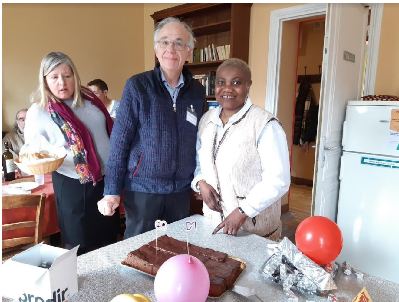
Le gâteau offert par le délégué de DM lors de l'AG du Défap

Nouvelle ». Ce projet aura son propre comité de coordination, ses animateurs cantonaux, son journal, jusqu'à envisager, au fil des ans, une complète fusion de ses organismes membres dans une entité unique. Espoir avorté en 2002... Mais entretemps, les Églises suisses, leurs envoyés et leur service missionnaire auront vécu tous les soubresauts d'une histoire internationale agitée : la lutte contre l'apartheid en Afrique du Sud, le génocide rwandais... mais aussi la création du service civil à l'étranger, un nouveau statut qui permettra d'apporter une nouvelle vitalité à l'échange de personnes porté par DM dans son réseau d'Églises.