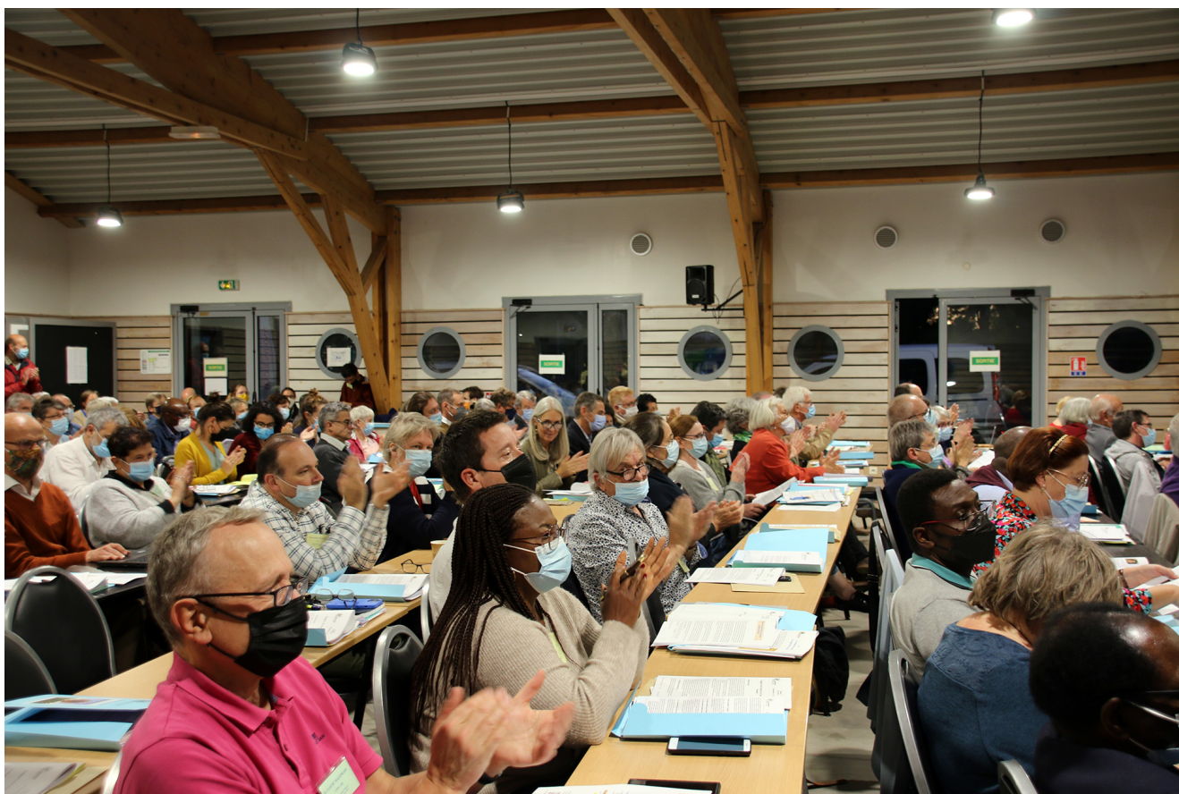
Le synode national 2021 de l'ÉPUdF à Sète

Le Défap sera présent au prochain Synode national de l'Église protestante unie de France, qui se tiendra du 18 au 21 mai 2023 en région parisienne, à Noisy-le-Grand, à l'invitation de cette paroisse de l'Inspection luthérienne de Paris.