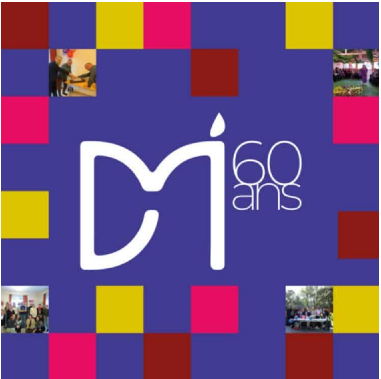
Le logo du soixantenaire de DM

DM, c'est un peu le cousin suisse du Défap. Né durant la même période mais quelques années auparavant (en 1963, quand le Défap a été officiellement créé en 1971) ; œuvrant dans des milieux d'Églises similaires et invité comme le Défap aux Conseils et aux Assemblée générales de la Cevaa (DM est ainsi le département missionnaire des Églises de Suisse romande, quand le Défap réunit trois unions d'Églises protestantes françaises de tradition luthéro-réformée). Avec des modalités d'engagement et des visions très proches, une même pratique de