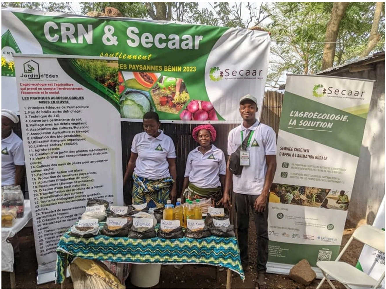
Le Secaar représenté lors de la foire ouest-africaine des semences paysannes, en mars 2023

« Pas de souveraineté politique sans une souveraineté alimentaire et pas de souveraineté alimentaire sans une souveraineté semencière ». Ce mot d'ordre illustre l'un des nombreux engagements du Secaar, qui lui a valu d'être présent en mars dernier lors de la foire ouest-africaine des semences paysannes organisée par le COASP Bénin (Comité Ouest Africain des Semences Paysannes). Il est aussi révélateur du positionnement de cette organisation qui rassemble aujourd'hui dix-huit Églises et organisations chrétiennes d'Afrique et d'Europe, présentes dans une douzaine de pays, et dont le Défap est un des membres fondateurs. Les questions écologiques, politiques et de justice sociale y sont étroitement liées.