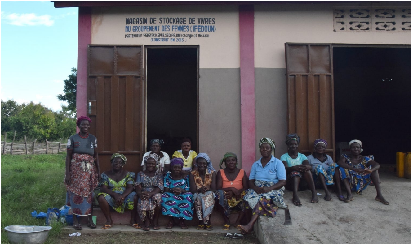
Un projet soutenu par DM au Bénin