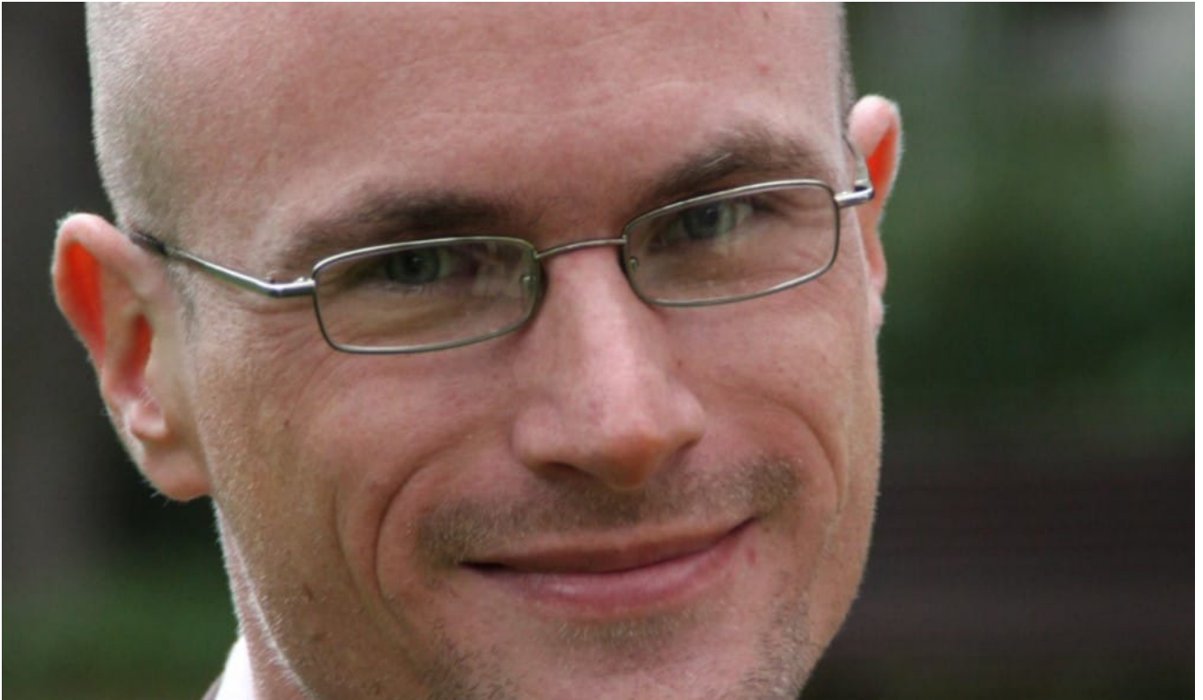
Éric de Putter

Réforme : C'est la première fois que le Défap s'exprime publiquement depuis l'assassinat d'Éric de Putter le 8 juillet 2012 à Yaoundé, pourquoi ?