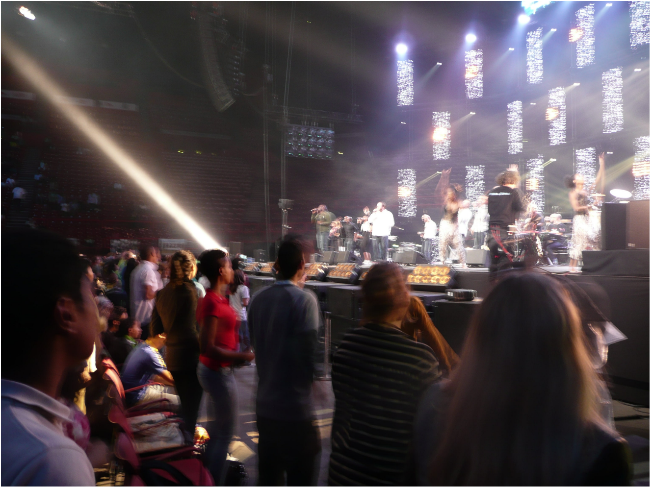
Le samedi 28 Septembre à Bercy, lors de la soirée spectacle. Petite incursion dans le public sur des images de Valérie Thorin (Défap)