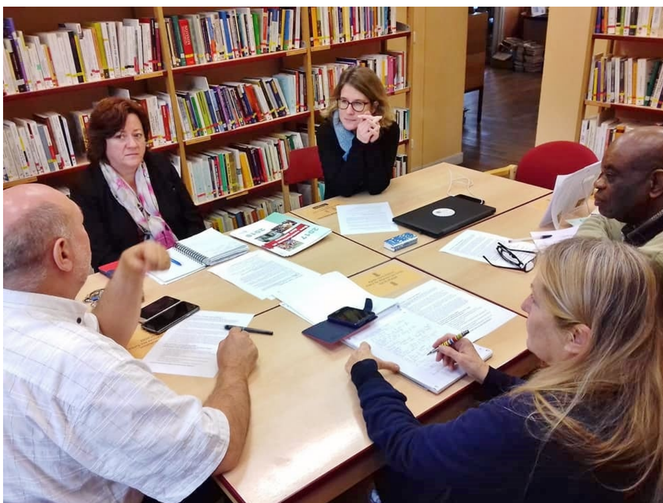
Rencontre des ERM du 6 décembre 2018 : une vue des travaux de groupes

Mais ces réflexions concernent les étrangers déjà installés, déjà accueillis, qui font déjà partie