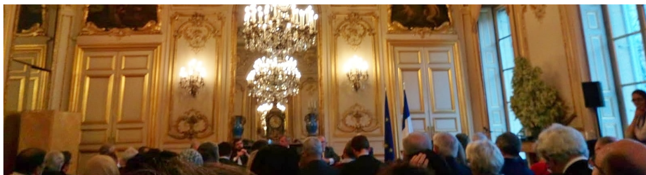
Image du colloque du 4 décembre au Sénat

rencontre, des thèmes interrogeant les relations profondes entre les religions et les droits de l'homme.