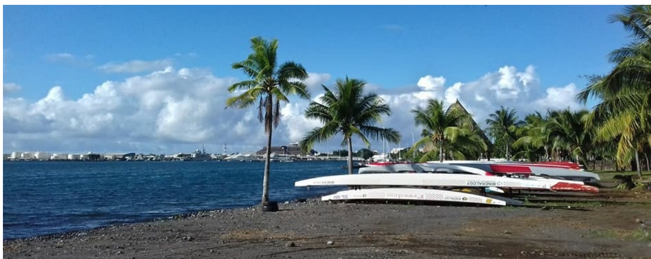
Tahiti, Papeete : vue sur la mer et le port, en face du temple de Paofai