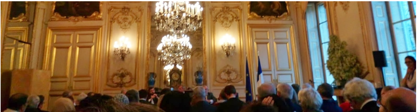
Image du colloque du 4 décembre au Sénat