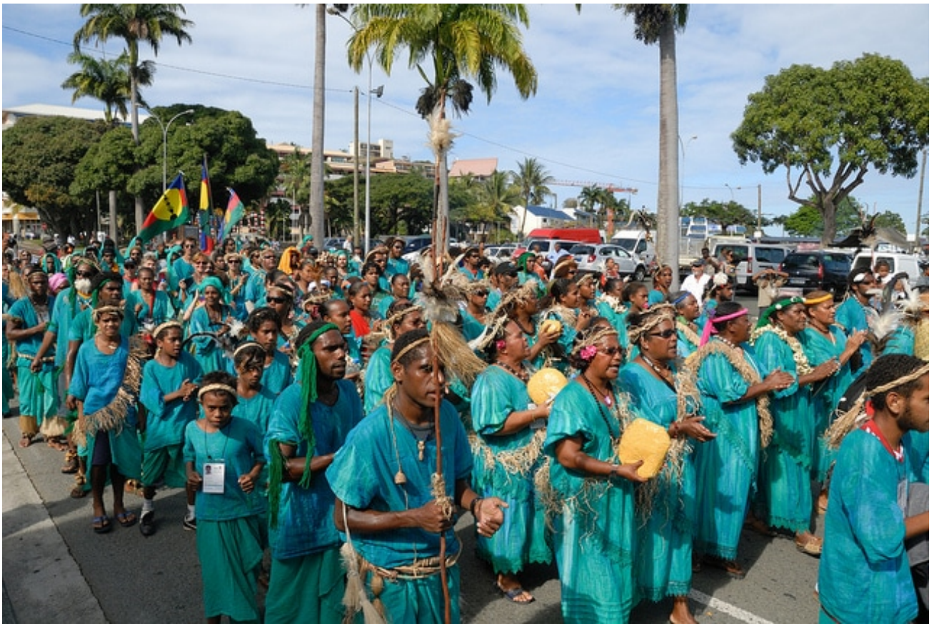
Délégation de la Nouvelle-Calédonie Clôture du 4ème festival des arts mélanésiens, Mwâ kê Nouméa, Nouvelle-Calédonie 2010

Que peuvent faire les protestants face à ces risques de tensions –