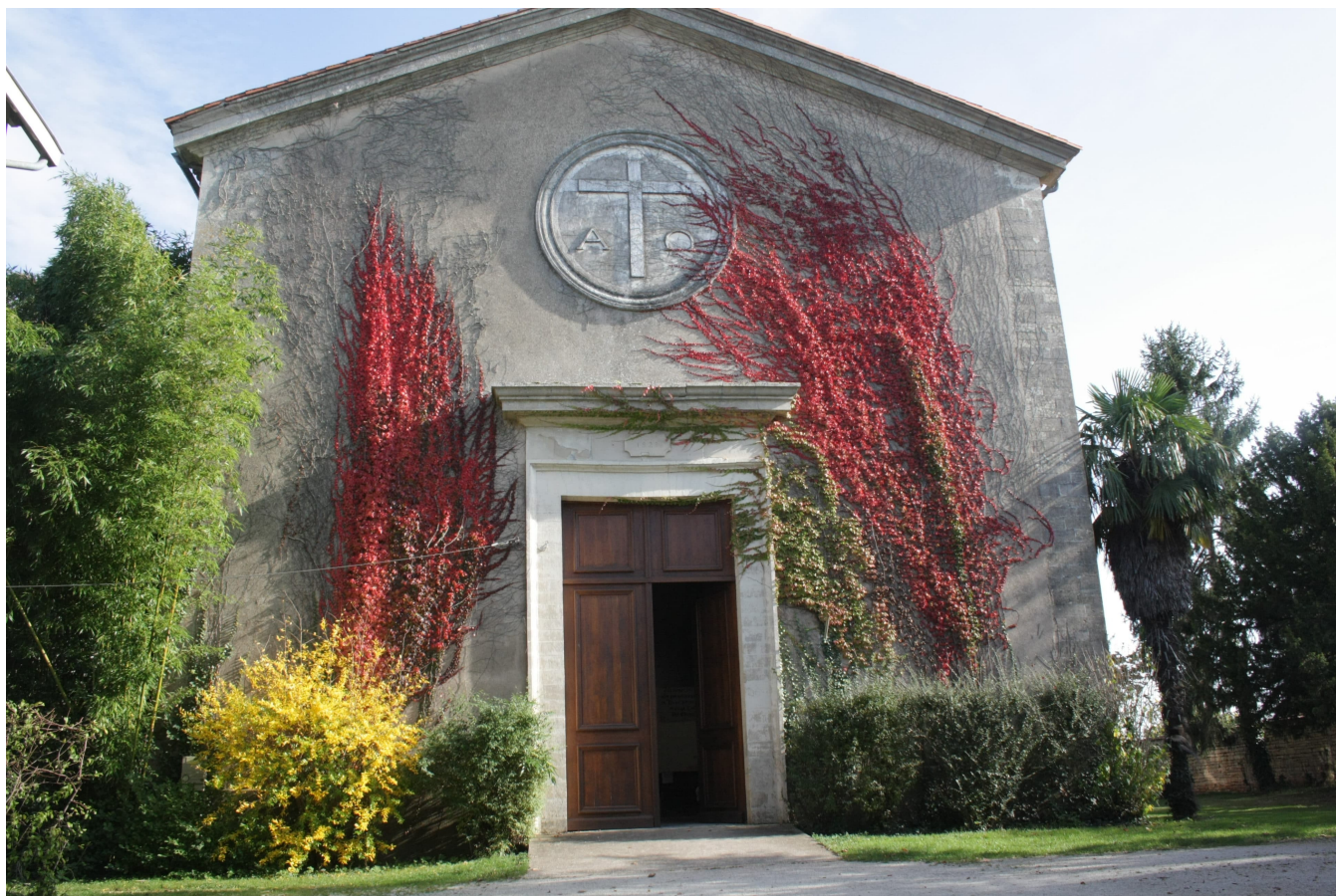
Temple de l'Église Protestante Unie de Lezay

défi. Une Église de Lezay qui avait très chaleureusement accueilli le Synode National en 2018. Cette série est proposée par Marie Piat, en partenariat avec Regards Protestants.