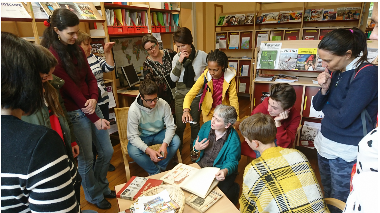
Visite de groupe au Défap en avril 2019 : découverte de la bibliothèque

Permettre à des jeunes venus de toutes les paroisses de toucher du doigt l'histoire des missions protestantes, et leur montrer comment les échanges et les partenariats avec les Églises sœurs se vivent aujourd'hui au Défap : c'était l'objectif du programme «Voir et revoir Paris». Un an et demi après son lancement, ces visites de groupes au sein de la «Maison des Missions» sont entrées dans le quotidien du 102 boulevard Arago. Avec leurs étapes incontournables, comme la bibliothèque ou la chapelle ; et leur lot de rencontres avec des visiteurs du monde entier qui se croisent au Défap. Quel autre lieu du protestantisme français permet ainsi, le même jour, de petit-déjeuner avec un professeur de théologie du Congo-Brazzaville, de croiser dans un couloir un envoyé de retour de Madagascar, ou de discuter dans le jardin avec un responsable d'une Église camerounaise ?