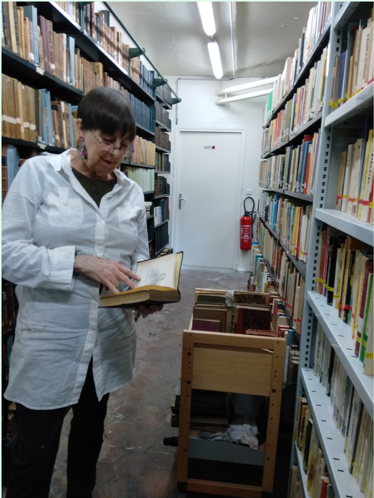
Mireille Boissonnat © Défap

Le jeudi matin, c'est l'atelier récolement... Une entreprise de longue haleine qui se déroule dans les entrailles de la bibliothèque où se trouvent les magasins.