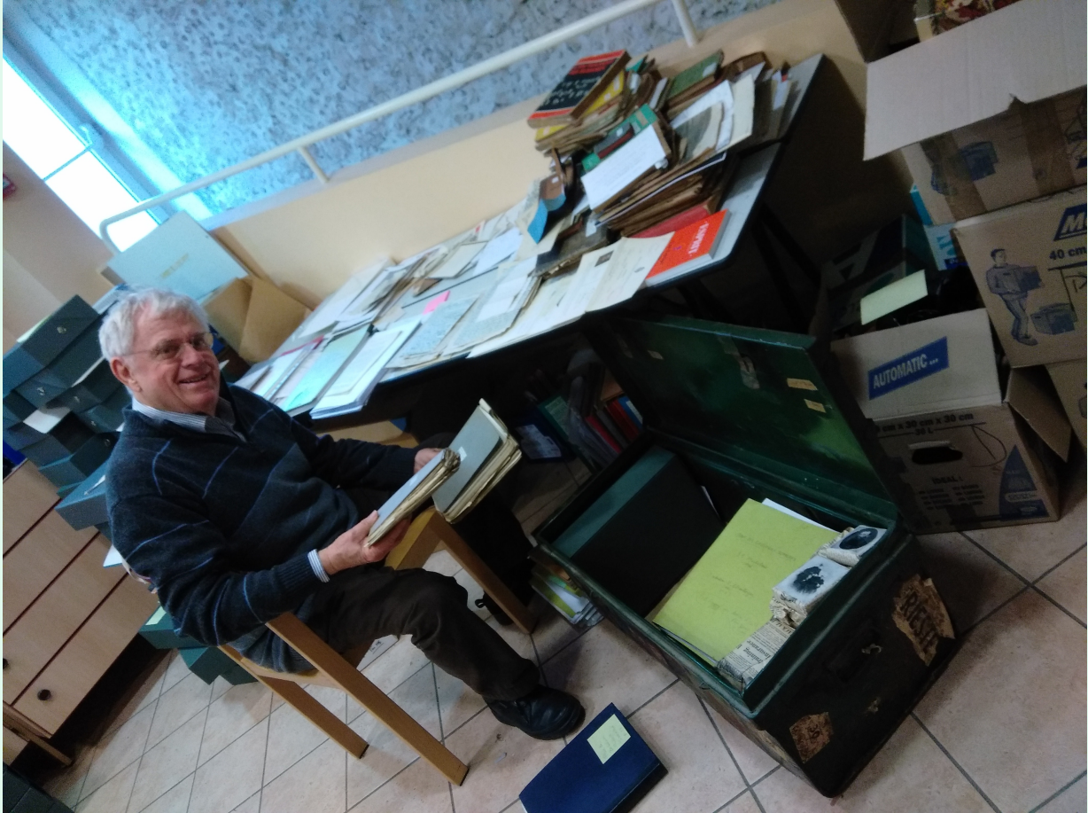
Jean-François Faba © Défap

Environ une centaine de boîtes – mais aussi une « malle Ellenberger » – remises par la famille au courant de l'année 2016 et dont Jean-François Faba entreprend le classement et la description.