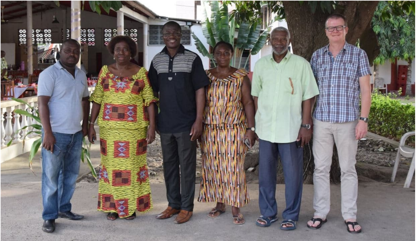
Le nouveau bureau du Secaar

Loin d'une course au développement à tout crin, le Secaar (Service chrétien d'appui à l'animation rurale), un réseau de dix-neuf Églises et organisations chrétiennes d'Afrique et d'Europe, présent dans une douzaine de pays, cherche à promouvoir l'être humain dans toutes ses dimensions : spirituelle, sociale et matérielle. Ses actions se déploient selon cinq axes de travail : le développement intégral (considérer l'être humain comme une créature avec des besoins matériels mais également relationnels et spirituels), l'agroécologie (maintenir les équilibres des écosystèmes), le climat et l'environnement (système alimentaire mondial plus juste, avec respect de l'environnement), les droits humains (promotion de la dignité humaine et accès équitable aux ressources), et la gestion de projet (accompagnement et/ou suivi). Il a été fondé en 1988 au Bénin, avant d'être officiellement constitué en association internationale en 1994 à Yaoundé, au Cameroun ; et le Défap en est un des membres fondateurs. Son siège se trouve aujourd'hui à Lausanne, en Suisse, et le secrétariat exécutif à Lomé, au Togo.