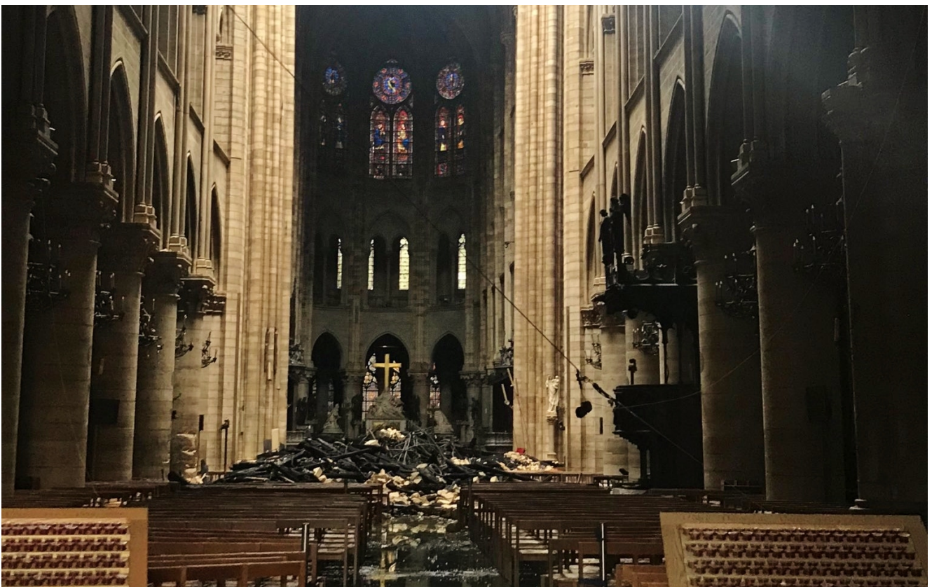
L'intérieur de la cathédrale au lendemain de l'incendie

Après le violent incendie qui a détruit, au soir du 15 avril, la flèche et la toiture de la cathédrale Notre-Dame de Paris, la Fédération Protestante de France, la Conférence des responsables de culte en France et le Conseil d'Églises chrétiennes en France font part de leur solidarité.