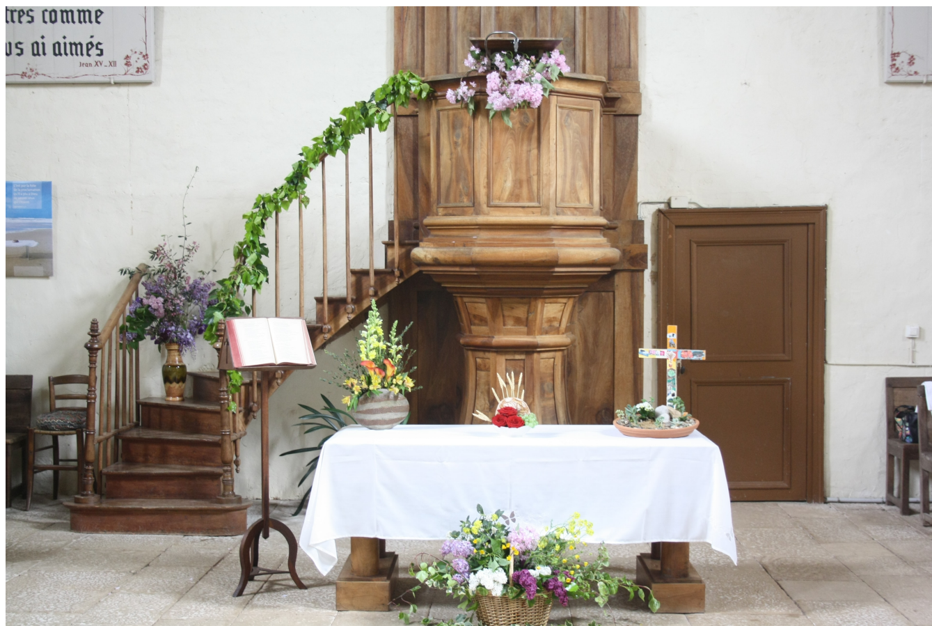
Temple de l'Église Protestante Unie de Lezay

avec modestie Bertrand Marchand, pasteur de l'Ensemble du Poitou Rural Protestant depuis 2015. Cela fait maintenant plus de cinq ans que nous évoquons le respect de la création, de la nature, dans la catéchèse et lors des cultes. Par ailleurs, les repas paroissiaux proviennent quasi intégralement des jardins locaux. Pour les bâtiments, nous avons fait isoler le presbytère et nous n'utilisons plus de pesticides. Mais nous avons encore beaucoup à faire. »