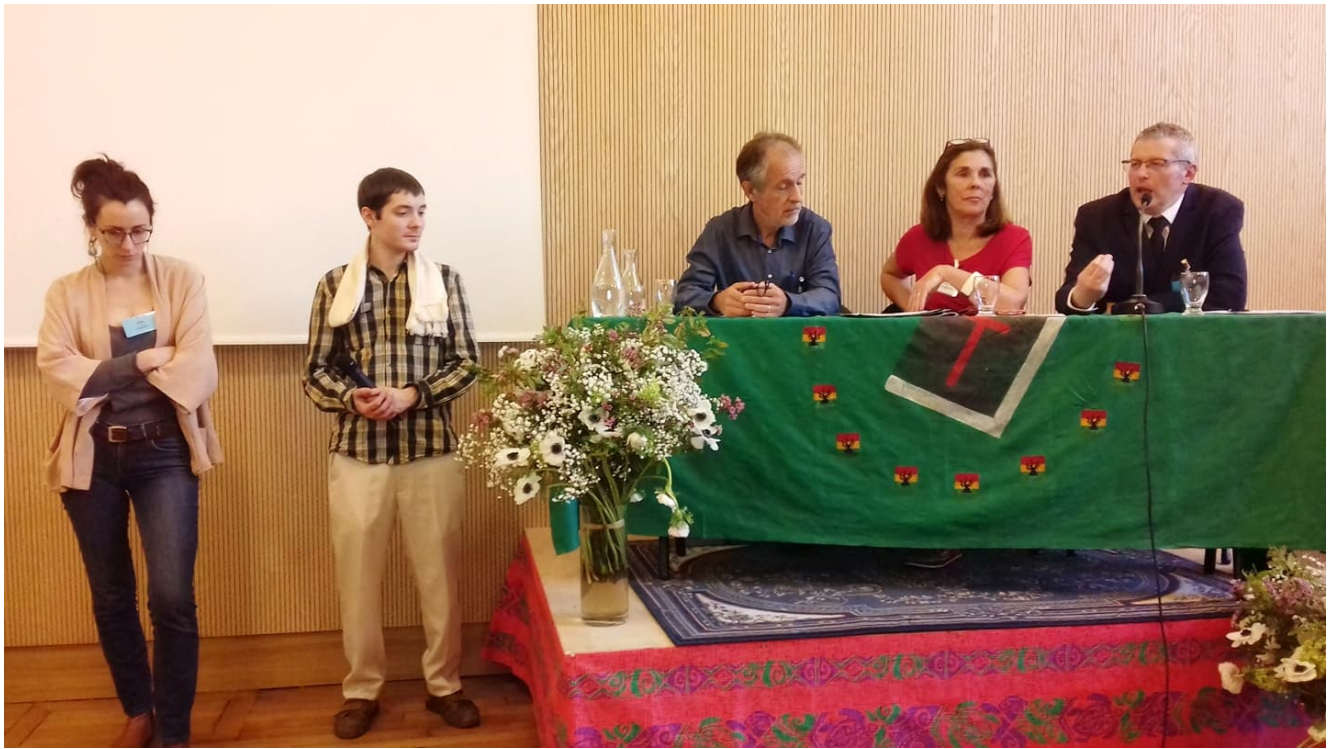
Image de l'après-midi de l'AG du Défap consacrée à des débats sur les «fruits de la mission»