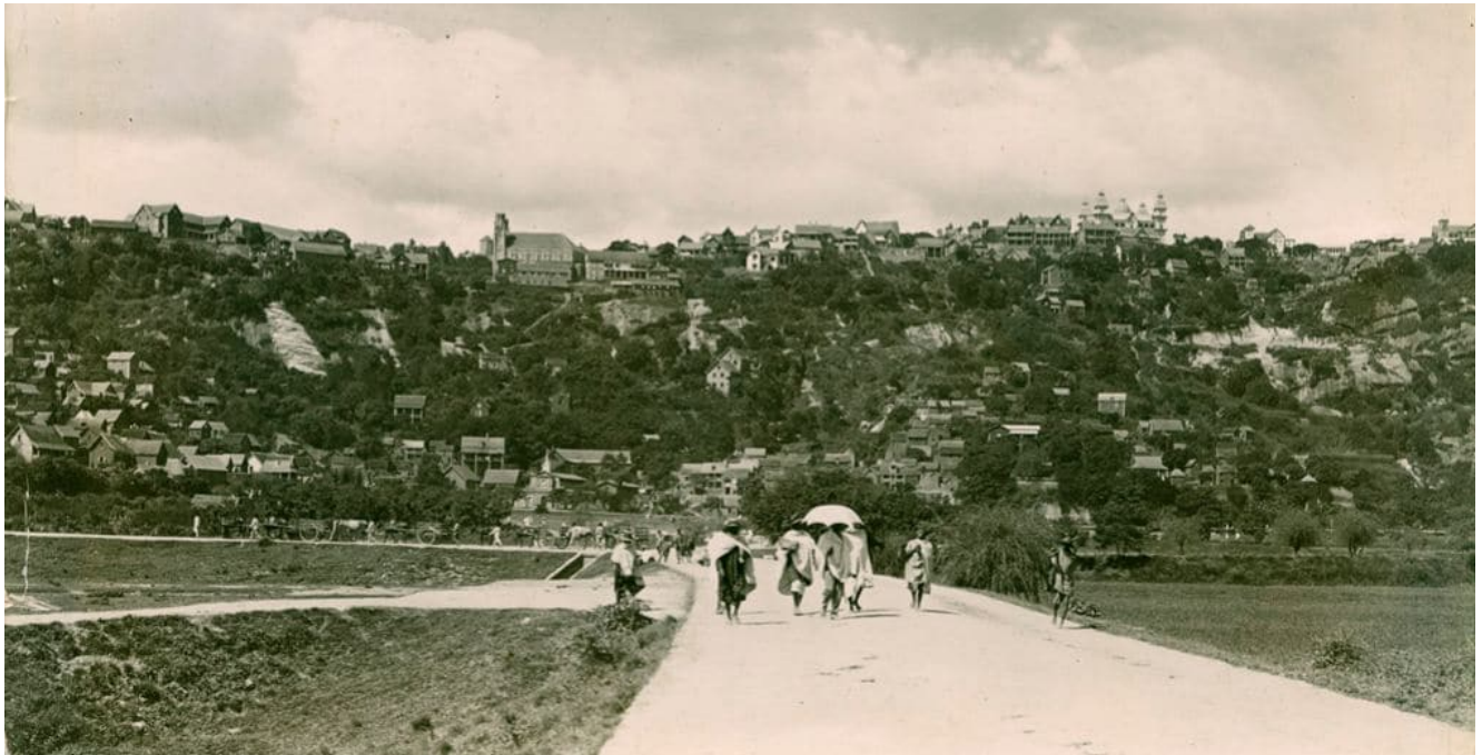
Panorama de Tananarive dans les années 1920 à 1950

Beigbeder, Z'oeil de chouette pour les éclaireurs ou Rabeigy pour des Malgaches, qui a marqué à la fois plusieurs générations de Malgaches et de Français.