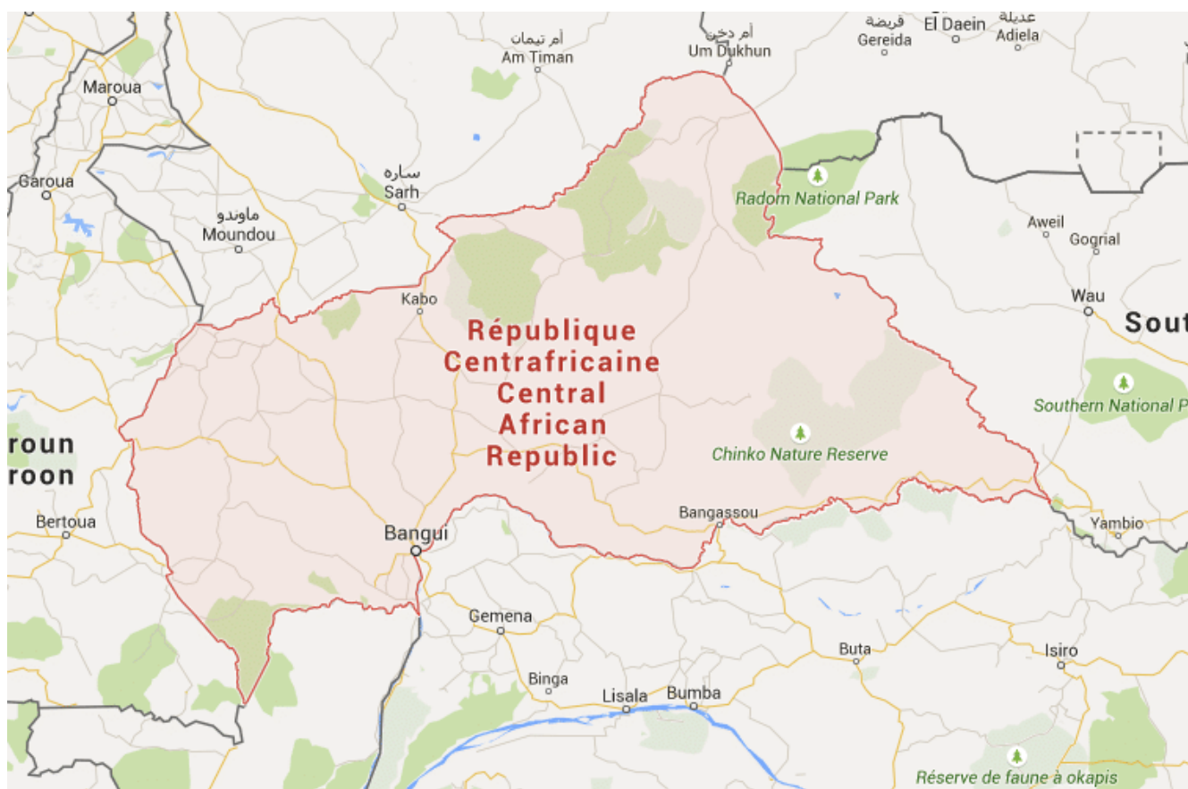
Carte de la République centrafricaine