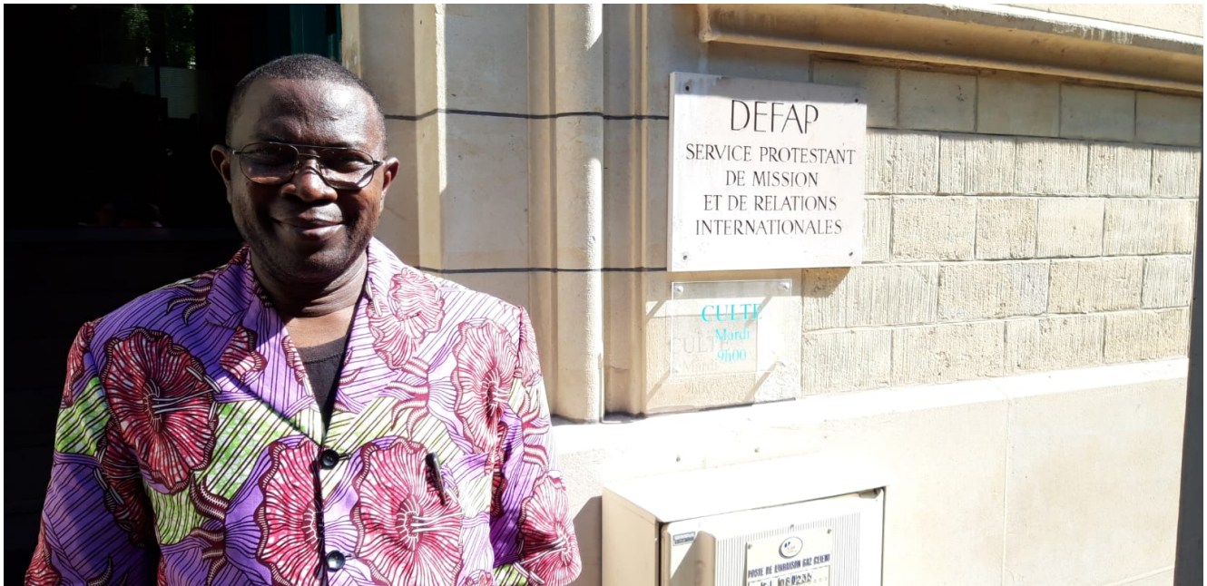
Le pasteur Maurice Gazayeke

Quelle est aujourd'hui la situation en République centrafricaine ?