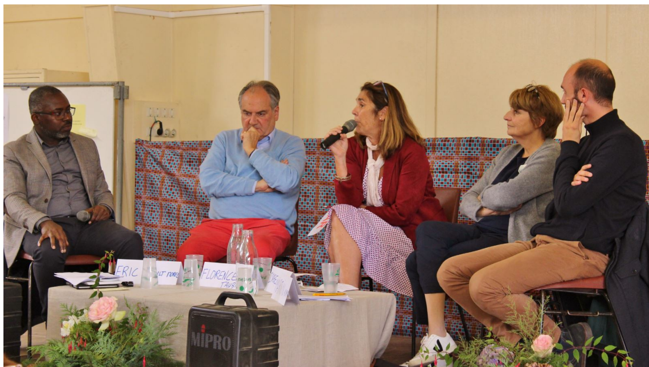
Vue de quelques intervenants du «mini-forum» de Condé-sur-Noireau

Loin des discours formatés sur l'environnement, le «mini-forum» de Condé-sur-Noireau, organisé fin septembre avec le soutien du Défap, a été l'occasion pour les participants de s'interroger sur leur engagement en faveur de la création. Et sur ses implications concrètes et quotidiennes. Comment avoir un discours qui ne cache pas la gravité des enjeux, mais qui puisse en même temps motiver au lieu de décourager ? Que signifie véritablement «Vivre simplement» ? Une thématique débattue tout au long du week-end à travers échanges et tables rondes, et illustrée par des témoignages concrets allant du monde de l'entreprise à celui des communautés religieuses. À noter, le 17 octobre, une émission sur RCF avec Éric Trocmé, qui reviendra en détail sur cette rencontre.