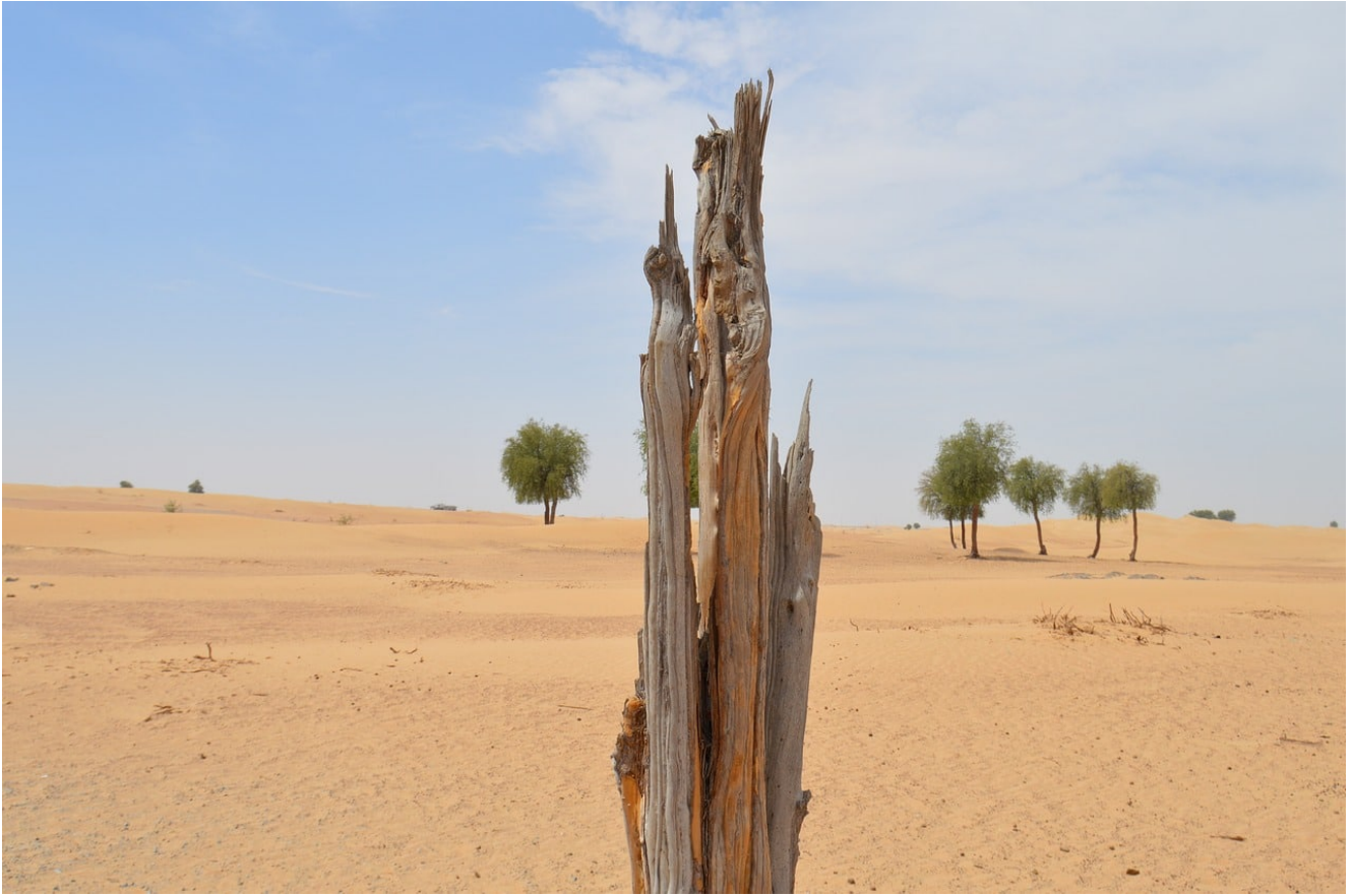
Illustration : déforestation et avancée des déserts La France vient d'adopter sa feuille de route pour la mise en œuvre des «objectifs de développement durable» (ODD) au moment où se tient le sommet dédié des Nations unies et quatre ans après l'adoption de l'Agenda 2030 et l'Accord de Paris. Cette adoption intervient alors que la situation de la planète ne cesse de s'aggraver et que le réchauffement planétaire pourrait être bien pire que prévu selon un rapport d'experts et expertes français du CNRS et de Météo France rendu public cette semaine.

menées, tant au niveau local qu'international, pour s'assurer qu'elles soient cohérentes avec les «objectifs de développement durable» signés par la France.