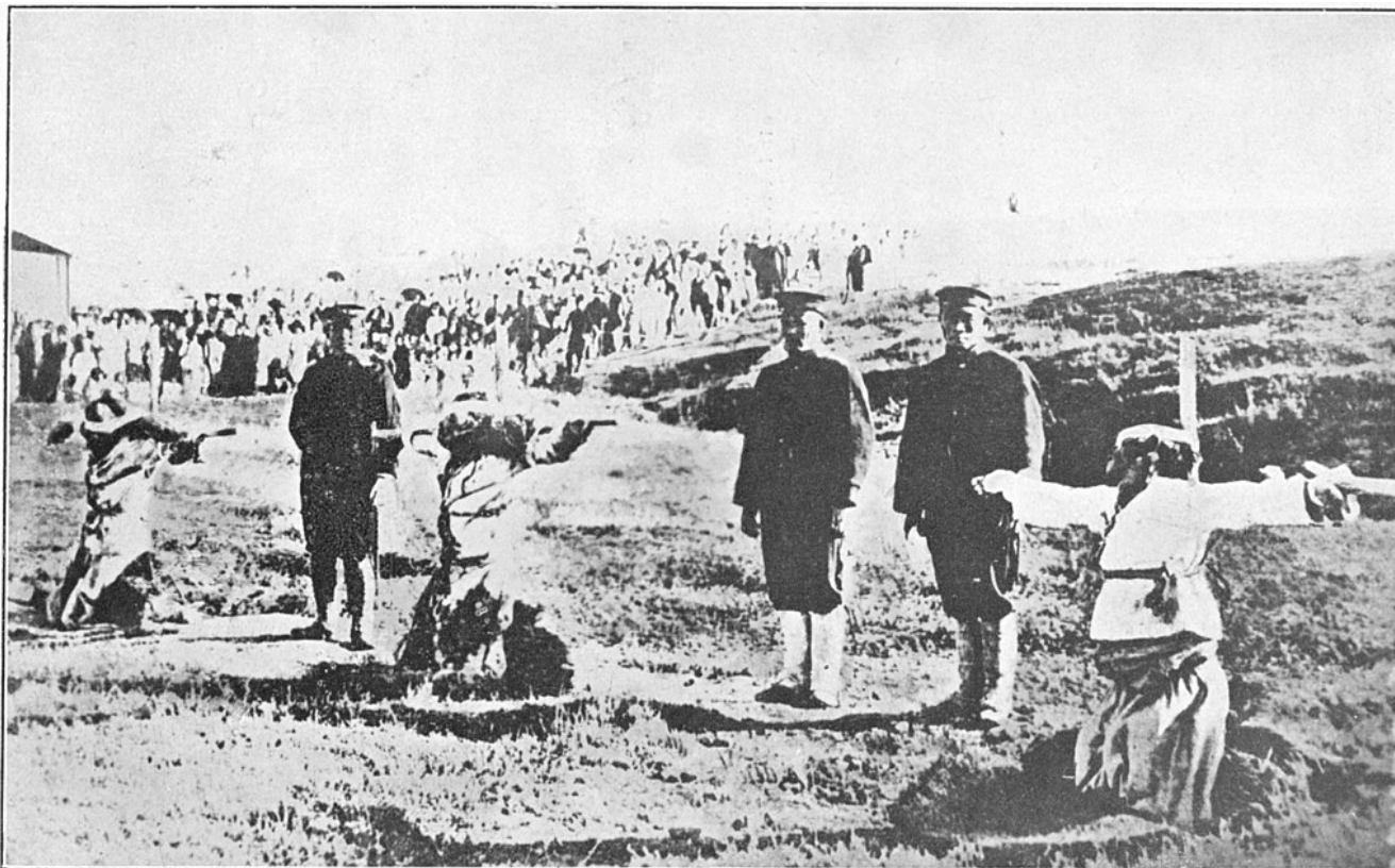
Les Japonais crucifient les Coréens chrétiens « coupables » de vouloir la libération de leur pays du joug japonais (1919).

d'occupation (1895-1910) puis décident d'annexer le pays, situation qui perdure jusqu'en 1945. Après quelques décennies de paix religieuse, le rejet du christianisme reprend avec une intensité croissante sous le régime nippon qui introduit le shintoïsme et rend obligatoire certaines de ses dévotions.