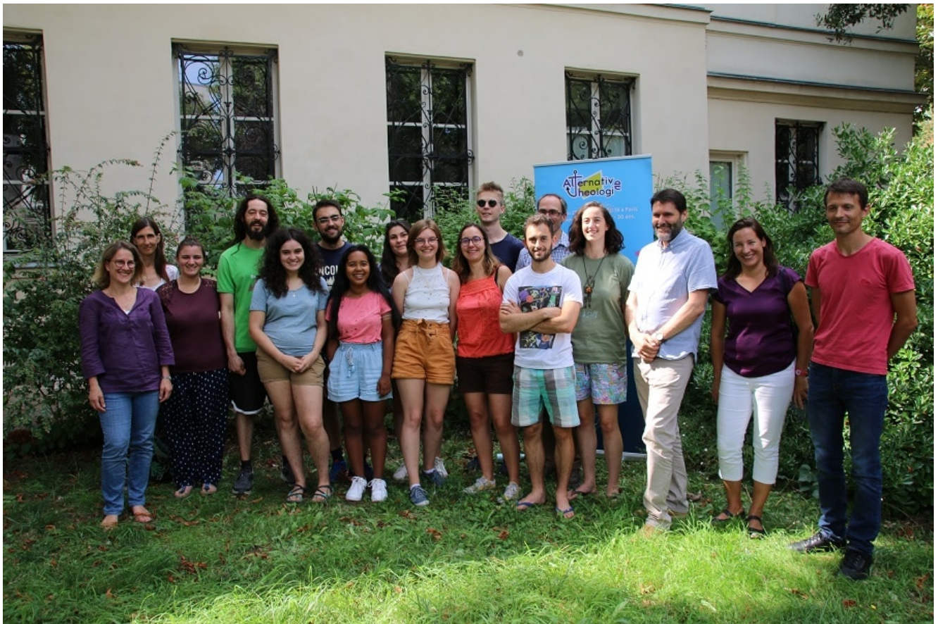
Participants du camp

partage théologique original sur le thème de la Liberté.