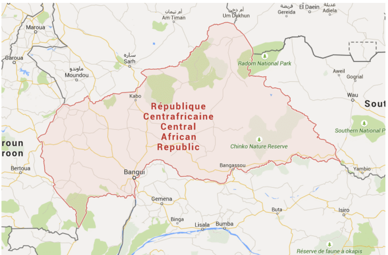
Carte de la République centrafricaine