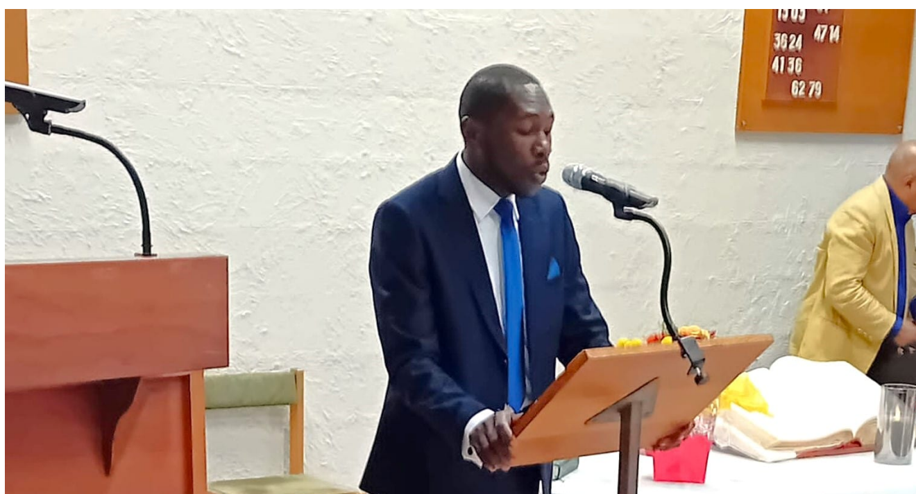
Robert Louinor

N'oubliez pas de vous inscrire, si ce n'est déjà fait ! Le lien Zoom vous sera fourni par mail quelques jours avant le webinaire.