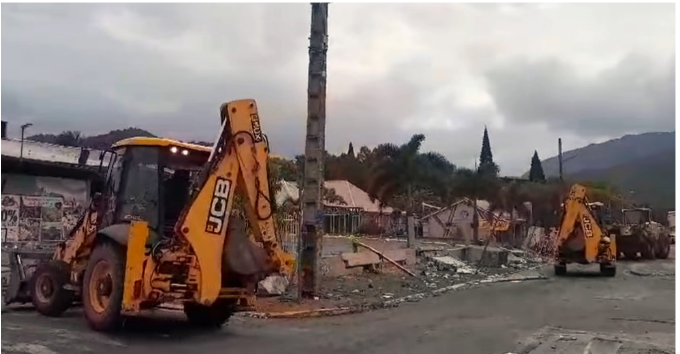
Bulldozers dégageant les décombres après les émeutes en Nouvelle-Calédonie