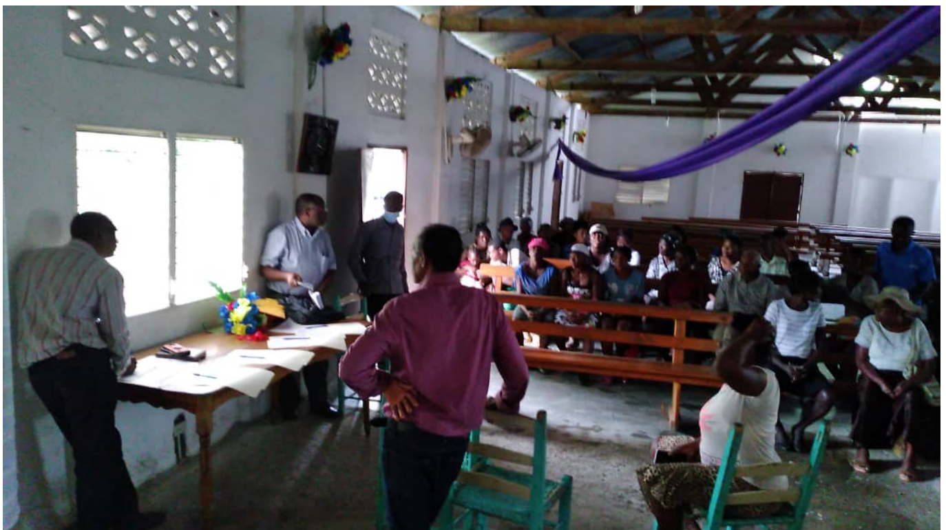
Distribution de fonds aux victimes à l'Église MEBSH à Maniche

Les partenaires sur place en lien avec les membres de la Plateforme Haïti s'efforcent d'apporter leur aide, en dépit de la désorganisation et des risques causés par une criminalité toujours omniprésente. ADRA-Haïti annonce ainsi que 300 familles réparties entre trois camps situées sur la commune de La Sucrière Henry de St-Louis du Sud, ont commencé à recevoir des tentes, eau, kits hygiéniques et alimentaires. La Mission Biblique, en lien avec l'UEBH (Union Évangélique Baptiste d'Haïti), a fait savoir que pour contourner les difficultés d'acheminement de l'aide, des fonds avaient pu être avancés directement à des familles de sinistrés via la Mission Évangélique Baptiste du Sud d'Haïti.