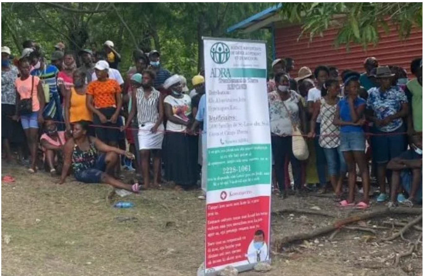
Distribution d'aide par ADRA Haïti dans la zone frappée par le séisme

Le Sud d'Haïti s'installe dans la crise post-séisme : de nombreuses familles sinistrées restent divisées entre des camps de fortune, privées d'un hébergement stable en pleine saison cyclonique, et l'acheminement de l'aide reste difficile. Les partenaires présents sur place de la Plateforme Haïti nous donnent des nouvelles. La plateforme Solidarité Protestante, qui a déjà fourni une aide exceptionnelle, lance un nouvel appel à la solidarité.