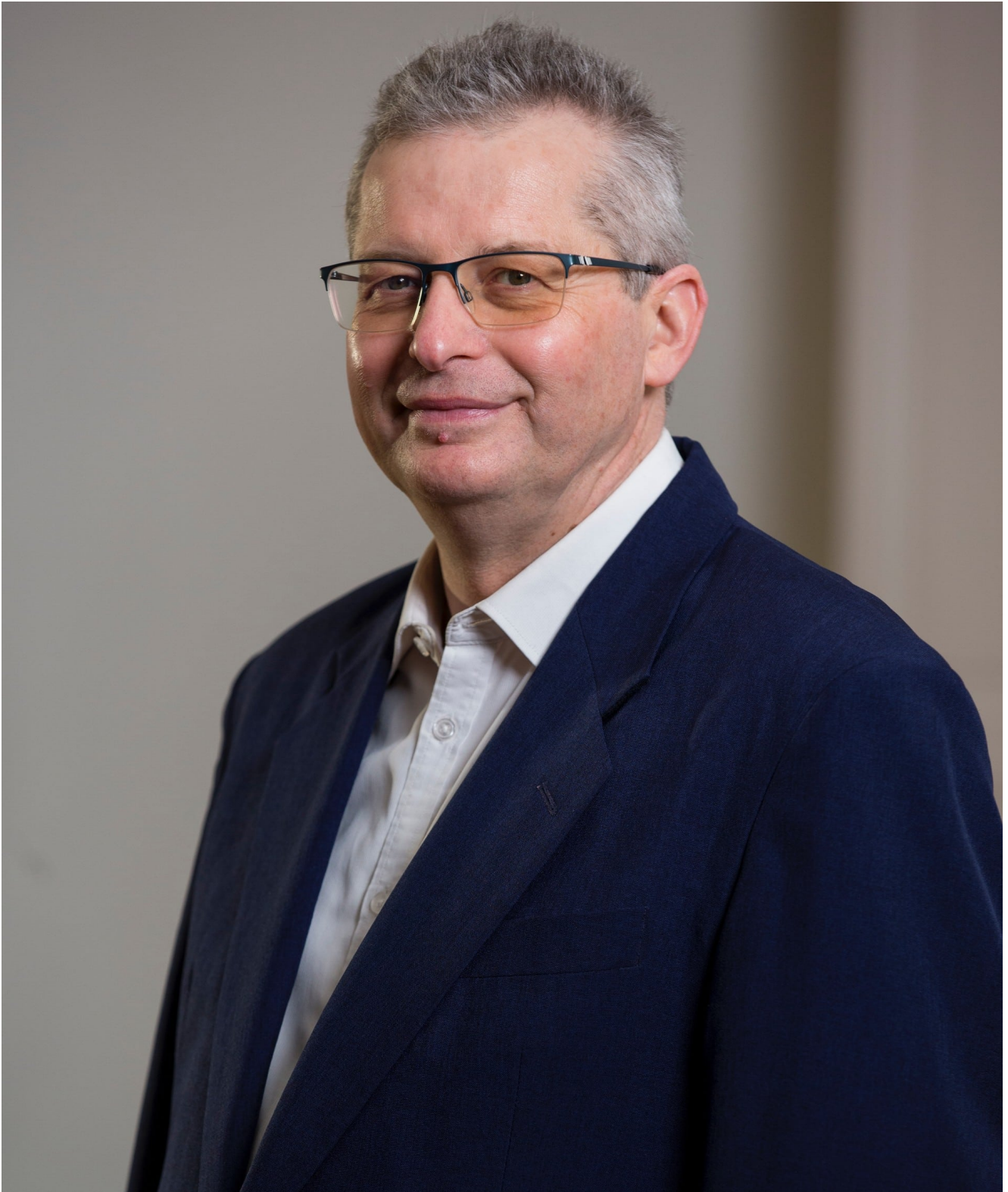
Gilles Vidal