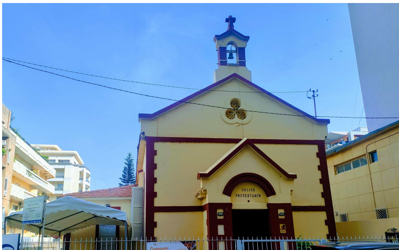
Le temple de Dakar