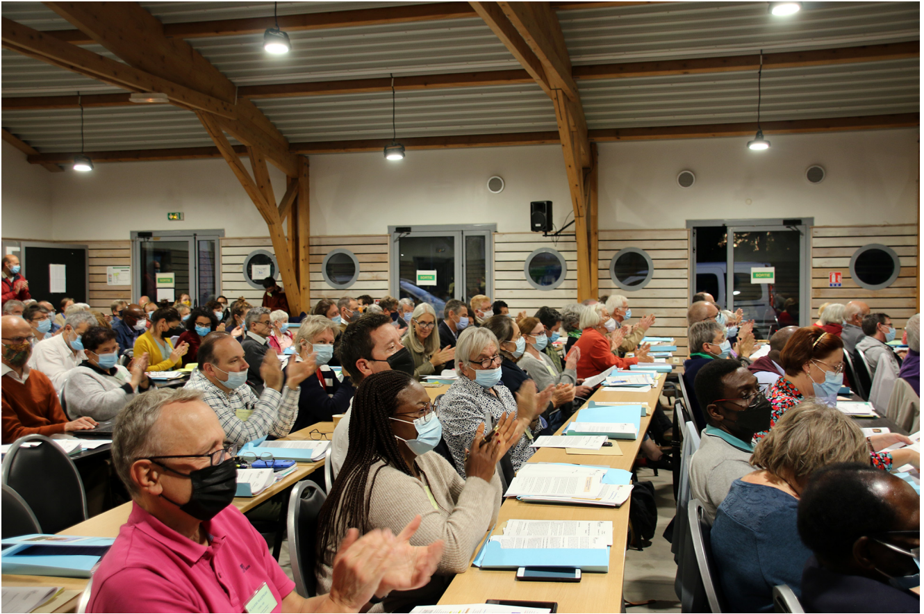
Le synode national de l'ÉPUdF à Sète