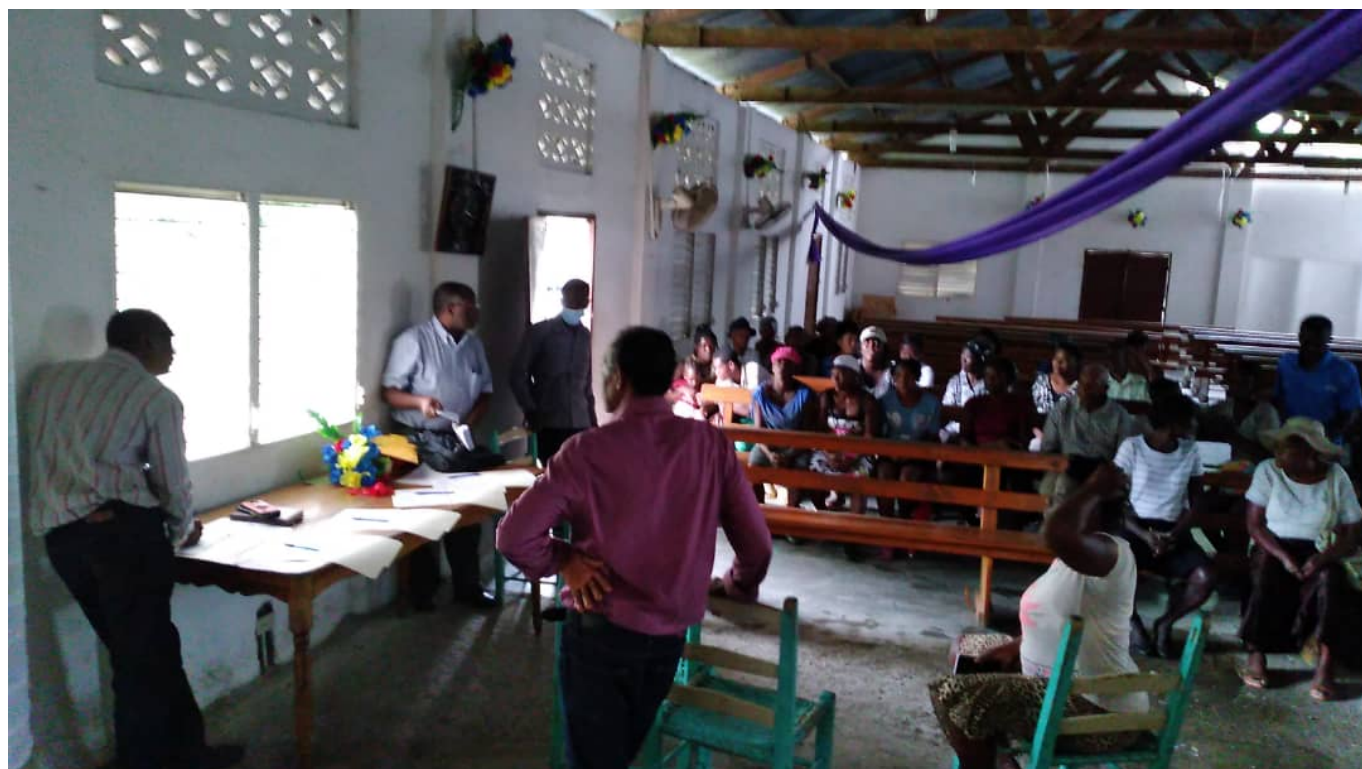
Distribution de fonds aux victimes à l'Église MEBSH à Maniche

La Sucrière Henry de St-Louis du Sud, ont commencé à recevoir des tentes, eau, kits hygiéniques et alimentaires. La Mission Biblique, en lien avec l'UEBH (Union Évangélique Baptiste d'Haïti), a fait savoir que pour contourner les difficultés d'acheminement de l'aide, des fonds avaient pu être avancés directement à des familles de sinistrés via la Mission Évangélique Baptiste du Sud d'Haïti.