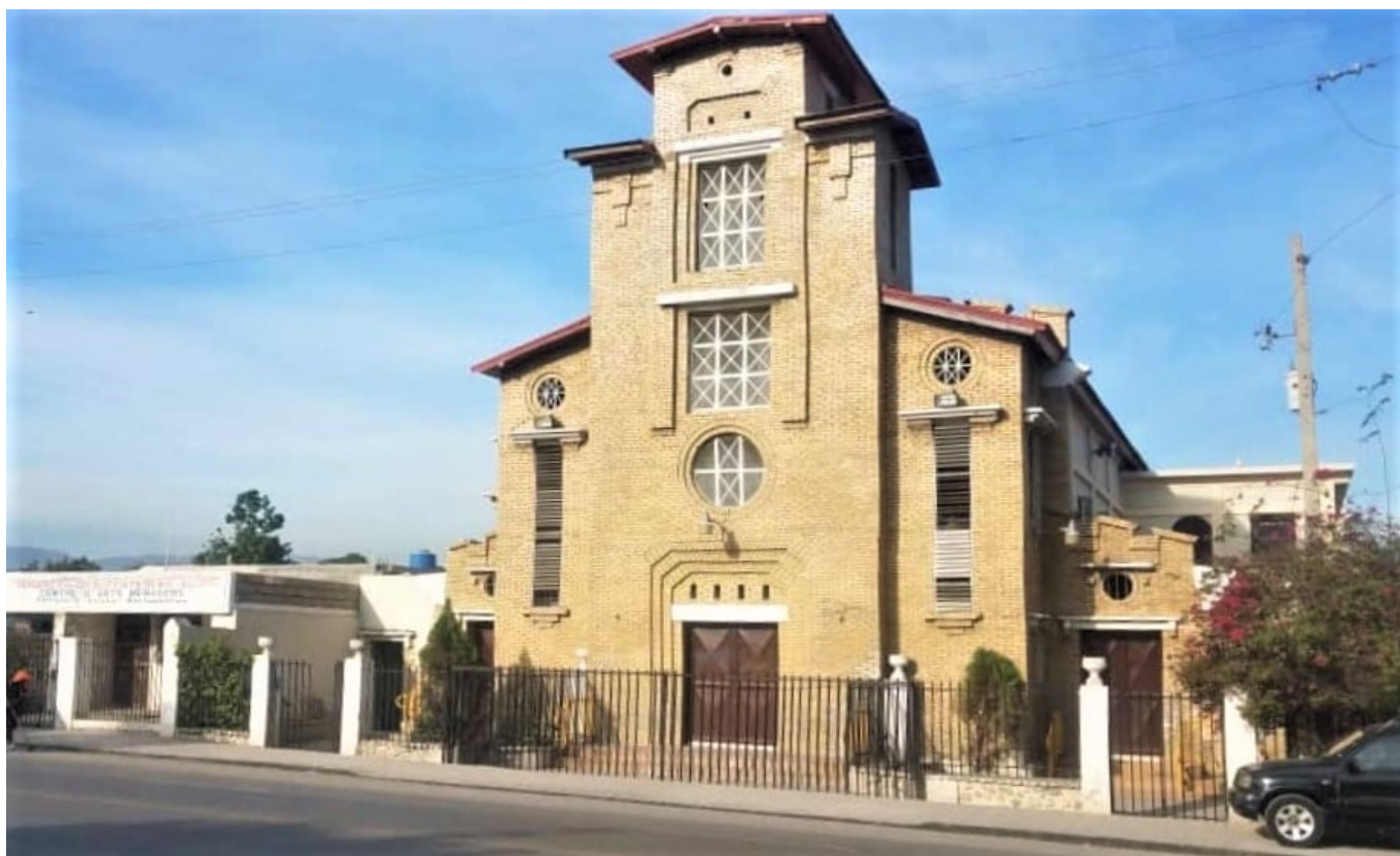
La Première Église Baptiste de Port-au-Prince