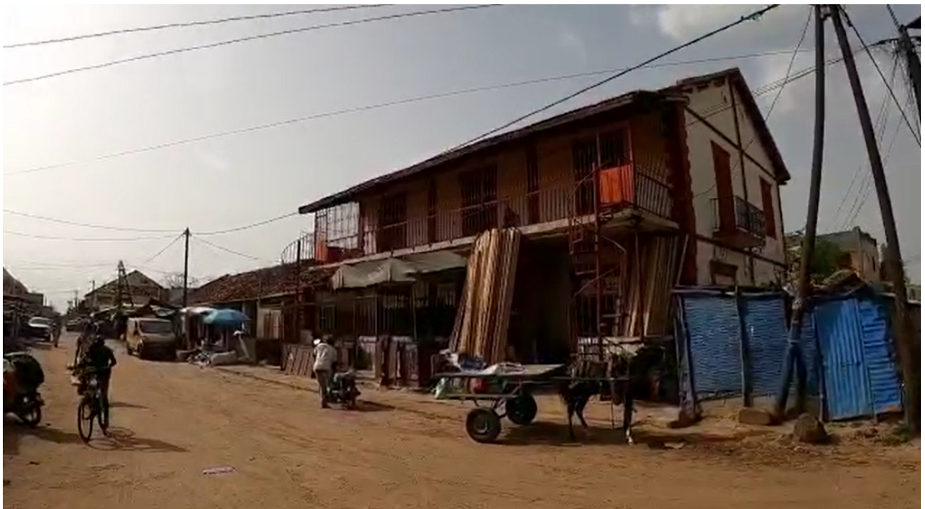
Vue de Fatick, au Sénégal

Les frontières se rouvrent, partiellement du moins, après l'épisode de fermeture dû à la situation sanitaire, et les missions à l'étranger reprennent. Après nos chroniques « Éloigné, en confinement » qui ont rendu compte de ce que vivaient les envoyés et boursiers du Défap pendant les périodes de restriction des déplacements, voici le témoignage de Sacha : après avoir participé à la session de formation des envoyés de juillet 2021, le voilà au Sénégal, comme volontaire du Défap. Sa mission s'inscrit dans un projet d'appui à la santé communautaire au centre de santé Darvari de l'ELS (l'Église Luthérienne du Sénégal) à Fatick. Sacha travaille aux côtés d'une sage-femme, Monique Bakkhoum.