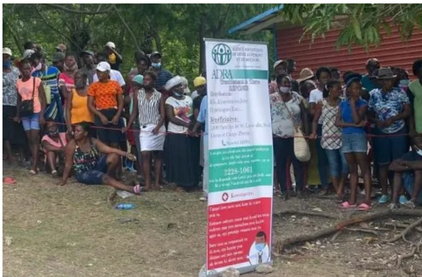
Distribution d'aide par ADRA Haïti dans la zone frappée par le séisme

entre des camps de fortune, privées d'un hébergement stable en pleine saison cyclonique, et l'acheminement de l'aide reste difficile. Les partenaires présents sur place de la Plateforme Haïti nous donnent des nouvelles. La plateforme Solidarité Protestante, qui a déjà fourni une aide exceptionnelle, lance un nouvel appel à la solidarité.