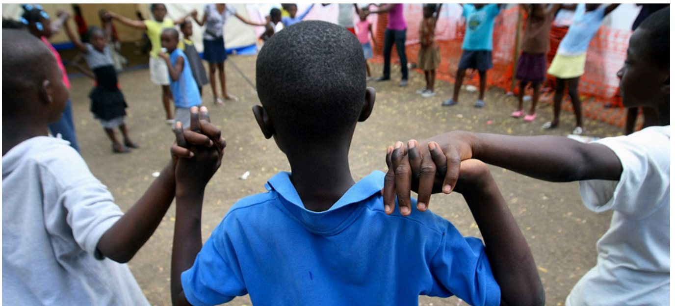
Des enfants dans un camp pour personnes déplacées à Port-au-Prince, Haïti

Enlèvements de pasteurs ou de missionnaires, emprise croissante des gangs qui bloquent le pays, ses commerces et ses hôpitaux en empêchant l'accès aux terminaux pétroliers : les nouvelles venues d'Haïti peuvent paraître désespérantes. Mais si la crise haïtienne est multiforme, les Haïtiens ont avant tout besoin qu'on ne les oublie pas.