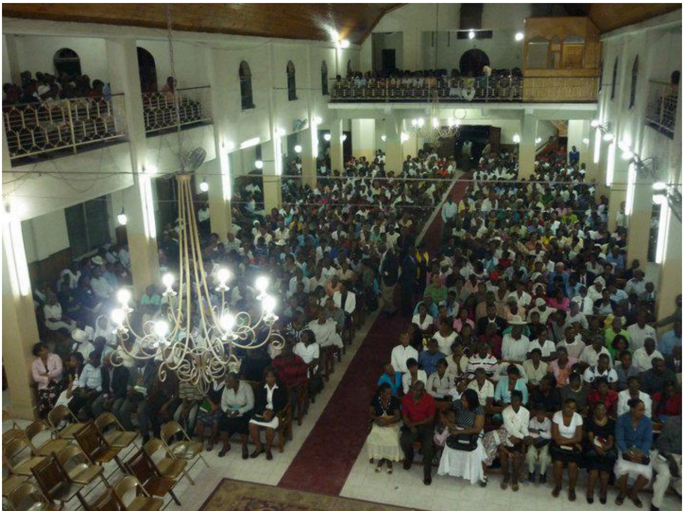
Culte à la Première Église Baptiste de Port-au-Prince

En dépit des dégâts liés au dernier séisme, et aggravés par la saison des cyclones, le pire problème auquel Haïti est confronté aujourd'hui reste l'insécurité. Les gangs qui contrôlent des quartiers entiers de Port-au-Prince bloquent l'aide internationale, rançonnent la population en multipliant les raptés et menacent même l'approvisionnement en pétrole du pays. Suite à la mort d'un diacre, abattu en plein culte dans le quartier du Palais National, censé être le plus protégé du pays, la Fédération protestante d'Haïti organise une journée de grève le vendredi 1er octobre. Le dimanche 3 octobre, les protestants haïtiens sont invités à s'habiller en noir et blanc en signe de deuil.