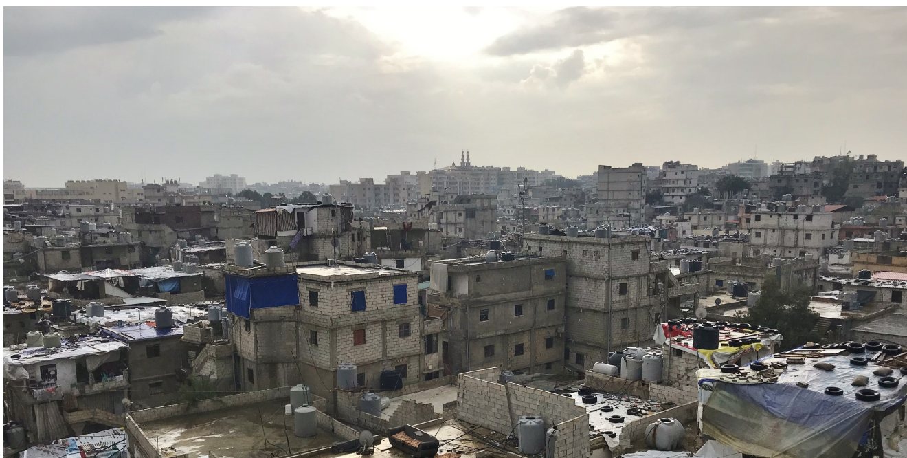
Vue du camp de réfugiés palestiniens de Chatila, en place depuis 1948 : l'un des lieux où intervient Soledad André

Dans un pays, le Liban, qui fait naufrage, les réfugiés venus d'Irak et surtout de Syrie voient leur condition devenir dramatique : 9 sur 10 survivent sous le seuil d'extrême pauvreté, sans statut (le Liban n'étant pas signataire de la Convention de Genève sur les réfugiés), et en butte à des marques d'hostilité croissante. C'est pour permettre aux plus vulnérables d'entre eux d'être accueillis en France que vient d'être renouvelé le dispositif des « couloirs humanitaires ».