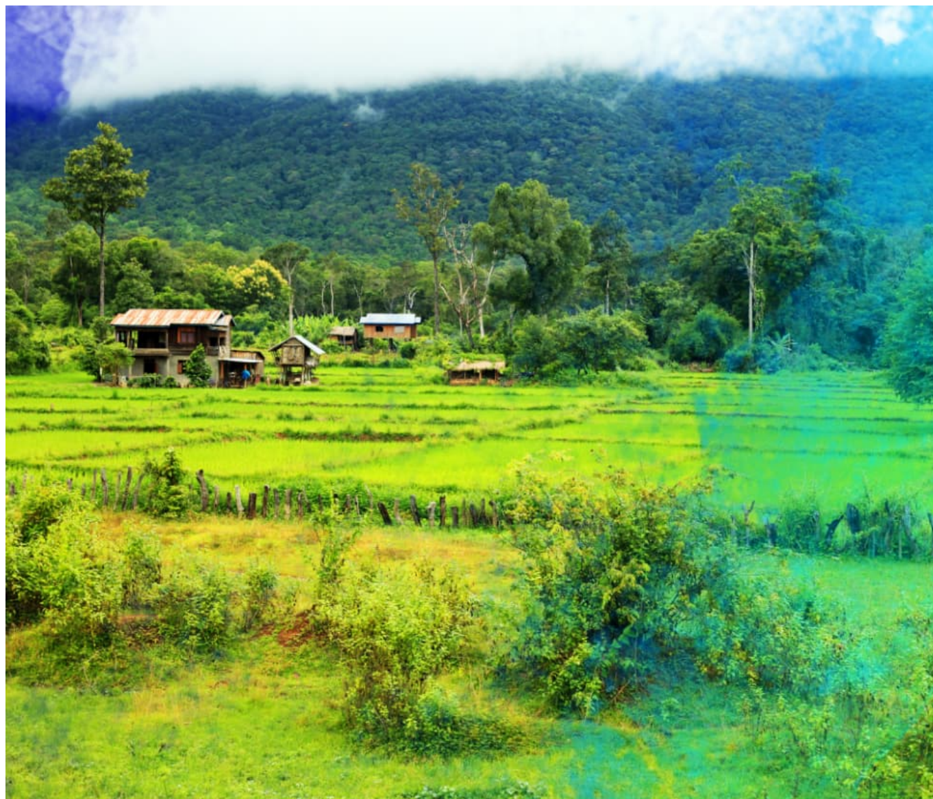
L'un des lieux d'intervention du Service Fraternel d'Entraide

Les organismes opérant dans le domaine de la solidarité internationale et disposant d'un agrément pour l'envoi de VSI (Volontaires de Solidarité Internationale) sont peu nombreux, et les pouvoirs publics encouragent la pratique du « portage » – c'est-à-dire que d'autres organismes voulant bénéficier de ce statut auront tout intérêt à se rapprocher de ceux déjà agréés. C'est une garantie en ce qui concerne la formation et le suivi des volontaires. Dans le milieu protestant, le Défap, disposant de cet agrément, est ainsi en relation avec de nombreux autres organismes dont il forme et suit les envoyés au cours de leur mission. Ce qui permet d'entretenir un