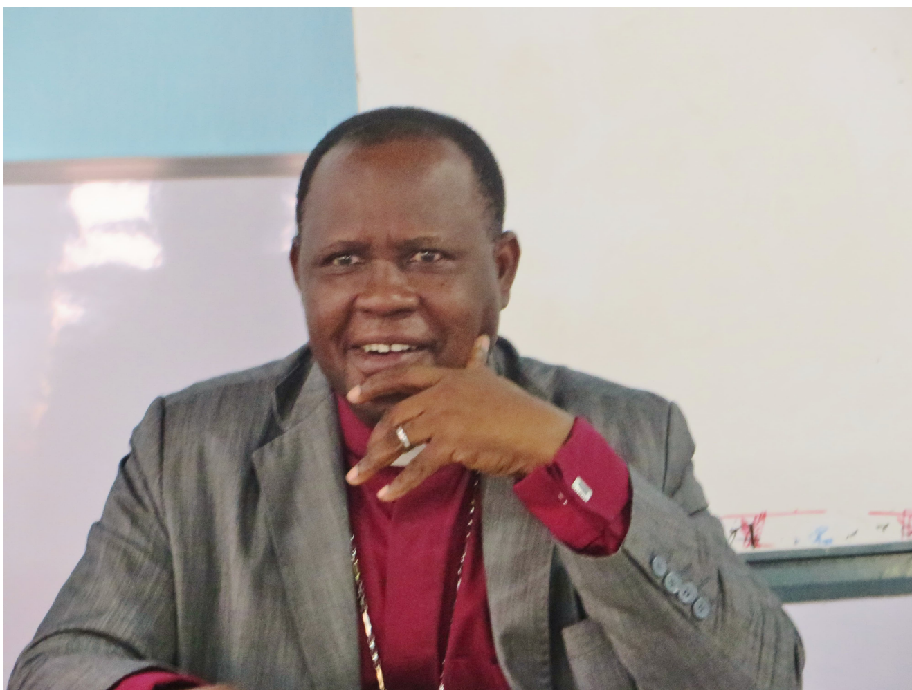
Nicodème Alagbada

Nicodème Alagbada, qui avait présidé l'Église protestante méthodiste du Bénin (EPMB) de 2010 à 2017, s'est éteint dans la nuit du dimanche 5 au lundi 6 février 2023. Il avait également dirigé l'organe transitoire mis en place par le président de la République Patrice Talon pour gérer la crise qu'avait traversée l'Église. Le chef de l'État béninois est allé présenter ses condoléances aux proches du disparu.