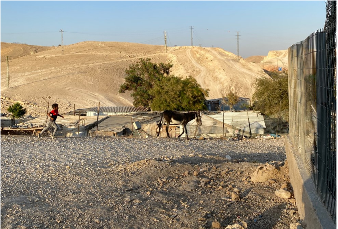
Vue du camp de bédouins de Khan Al Ahmar