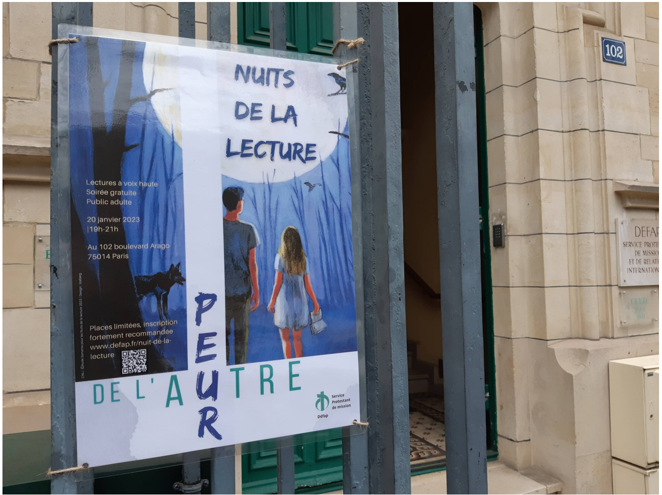
« Nuits de la lecture » : l'affiche à l'entrée du Défap, au 102 boulevard Arago