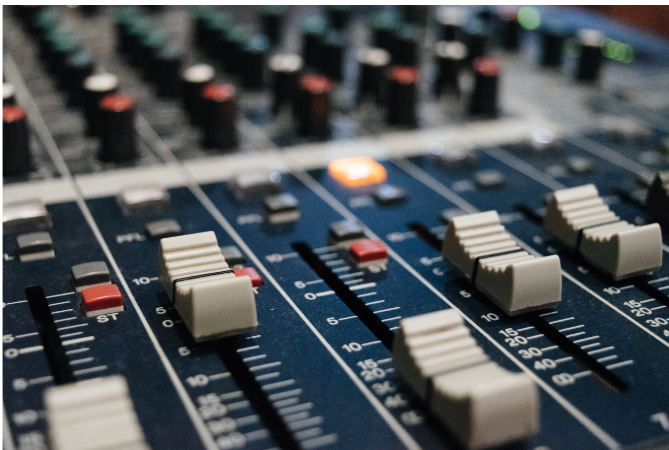
Illustration pour Carême Protestant