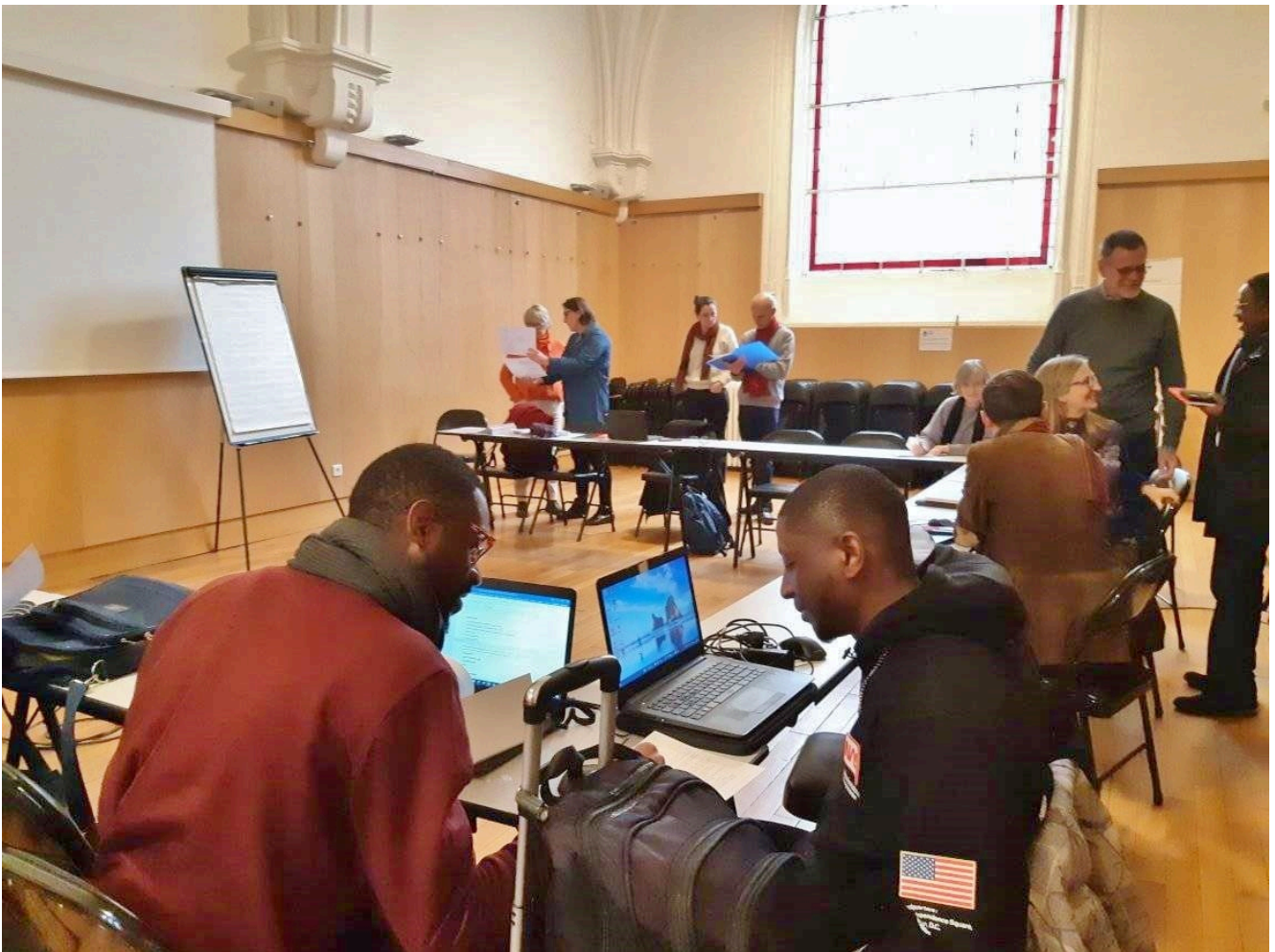
Participants de la « session d'accueil » organisée par le Défap, le 23 janvier 2023