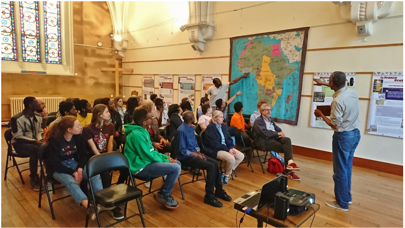
Visite d'un groupe de jeunes au Défap