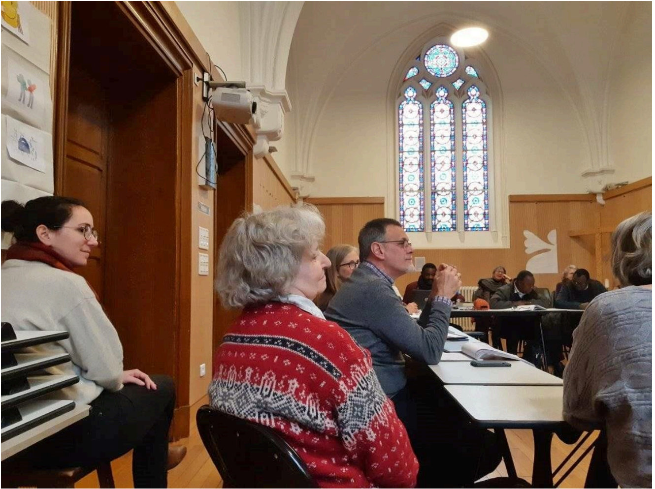
Vue de la première journée la deuxième session d'accueil des « pasteurs venus d'ailleurs »

Parmi les principaux sujets pouvant générer malentendus ou frictions, les premiers à ressortir, lors de travaux de groupes, ont été ceux de la place du religieux dans la société, et de l'équilibre entre vie personnelle et rôle pastoral. Des thématiques qui peuvent entraîner des incompréhensions, non seulement pour des pasteurs venus d'autres continents comme l'Afrique, mais aussi entre ministres et paroisses de pays pourtant géographiquement beaucoup plus proches : « On s'est aperçu qu'on ne faisait pas toujours assez attention à des différences culturelles entre pays voisins (comme entre la France et la Suisse), alors qu'elles peuvent parfois porter sur des questions assez fondamentales », notait ainsi en marge de la session Vincent Nême-Peyron, président de la Commission des ministères, « commission d'embauche » des futurs ministres de l'EPUDF.