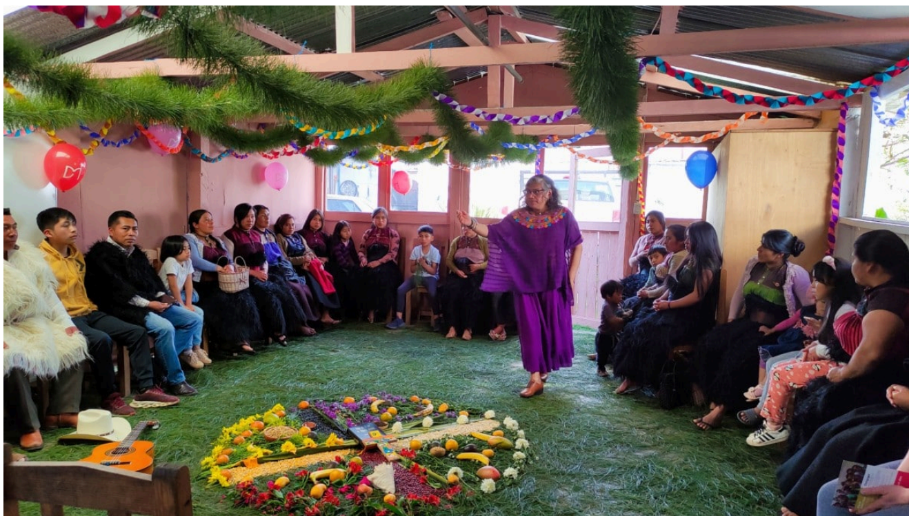
Célébration des 60 ans de DM au Mexique

désormais de « DM-échange et mission », l'association ayant changé ses statuts et son nom, et adopté un nouveau slogan, celui de « Dynamique dans l'échange ». S'appuyant sur le constat que le « centre de gravité du christianisme s'est déplacé au Sud », son 117ème Synode missionnaire (l'équivalent d'une AG), après un intense débat, a décidé à une large majorité de soutenir une nouvelle vision, dite de « réciprocité ». Avec trois thématiques porteuses : la formation théologique, le développement rural, l'éducation. Cette révolution interne s'est faite dans un contexte de réorganisation du paysage des oeuvres d'entraide de Suisse, avec la fusion de l'EPER (l'Entraide protestante suisse) et de PPP (Pain pour le prochain). C'est donc un DM tout neuf qui regarde désormais vers l'avenir et fête ses 60 ans tout au long de l'année, par des gâteaux partagés avec le Conseil et le Secrétariat, avec les envoyés, en Suisse, au Mexique... Des célébrations qui culmineront le 18 novembre 2023 à la cathédrale de Lausanne.