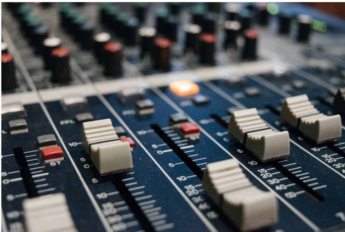
Illustration pour Carême Protestant