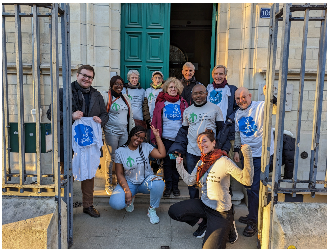
L'équipe du Défap au départ du 102 boulevard Arago, à Paris