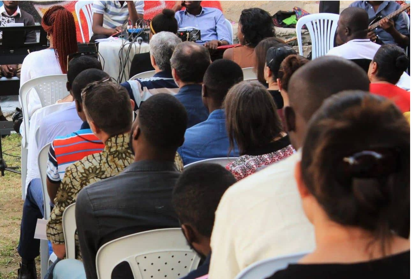
Une réunion des paroissiens de l'Église Réformée de Tunisie