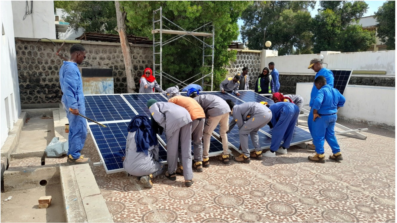
Élèves du centre de formation de l'EPED

Une activité qui se trouve au cœur de deux des grands enjeux de Djibouti : l'accès à l'énergie et à l'emploi. Djibouti a beau être l'un des plus petits pays d'Afrique – 23 200 kilomètres carrés – sa position géographique stratégique, à l'entrée méridionale de la mer Rouge et à proximité de certaines des voies maritimes les plus fréquentées du monde, en fait un pont entre l'Afrique et le Moyen-Orient. Son économie repose sur un complexe portuaire qui figure parmi les plus modernes du monde, et qui se développe. Mais Djibouti peine à se fournir en électricité et reste très dépendant des importations de combustibles fossiles, dont les prix explosent.