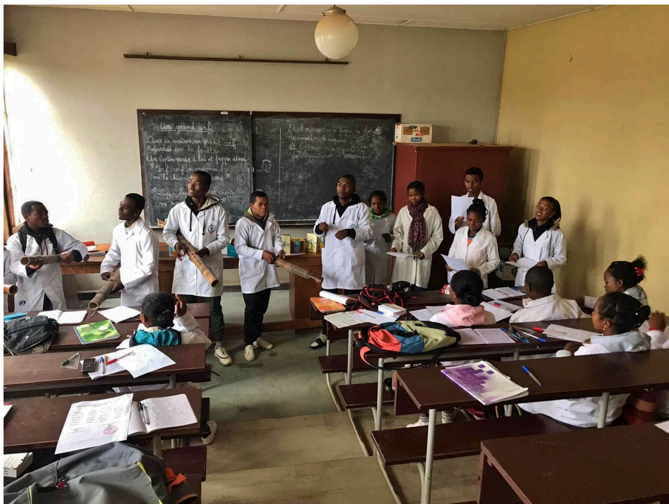
Futurs enseignants malgaches pendant leur formation

directeurs / trices d'établissements scolaire, qui vise en outre à accompagner des formateurs locaux pour qu'ils puissent prendre la relève.