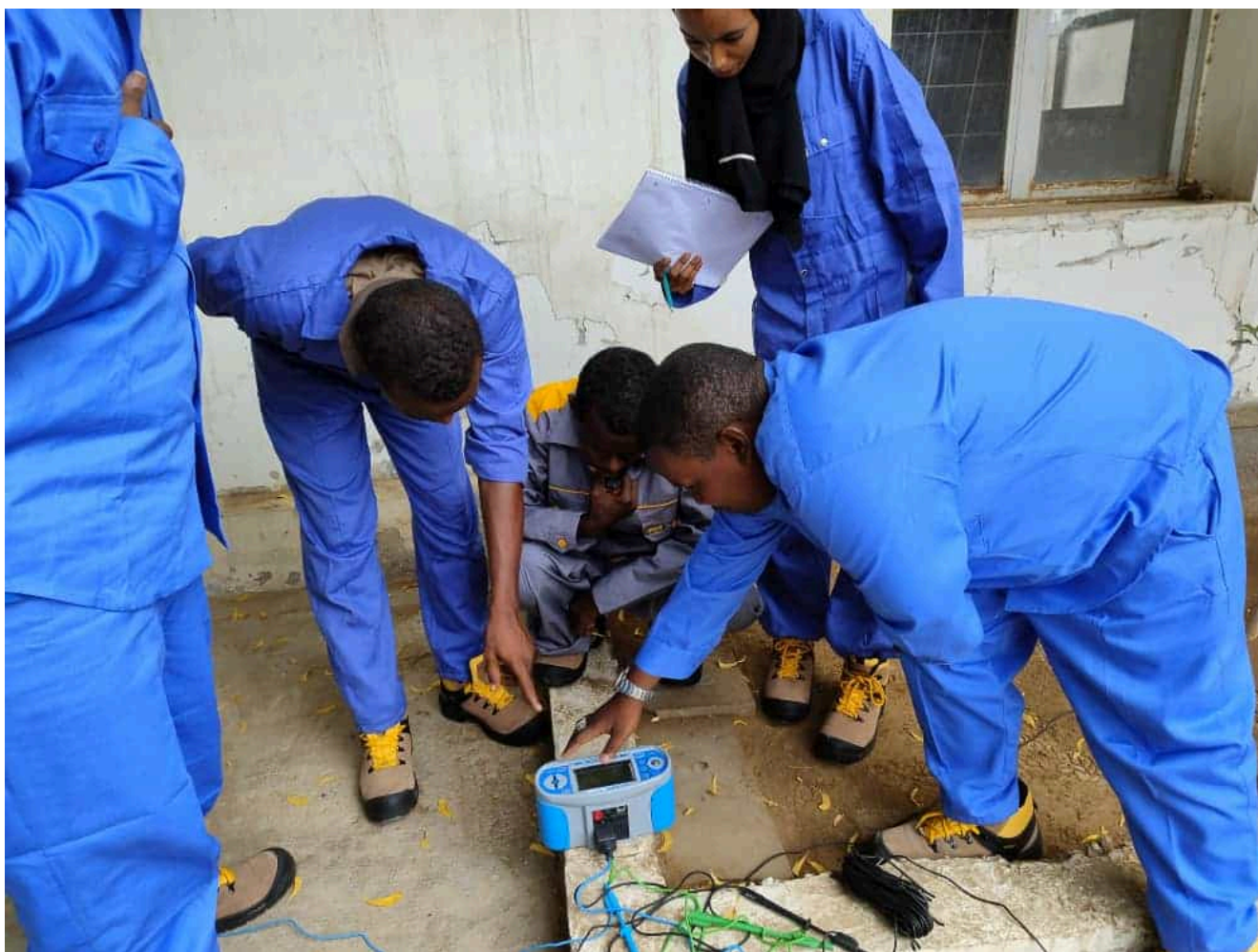
Élèves du centre de formation de l'EPED

jeunes : 70% des chômeurs ont moins de 30 ans. C'est sur ces deux points qu'intervient le centre de formation de l'EPED, en transmettant à des jeunes Djiboutiens des compétences qui aideront à la transition énergétique du pays et leur permettront de s'insérer sur le marché du travail. Un projet qui présente donc un double intérêt, social et écologique, et qui est précisément celui que le Défap a décidé de promouvoir cette année lors de l'édition 2023 de Hope360.