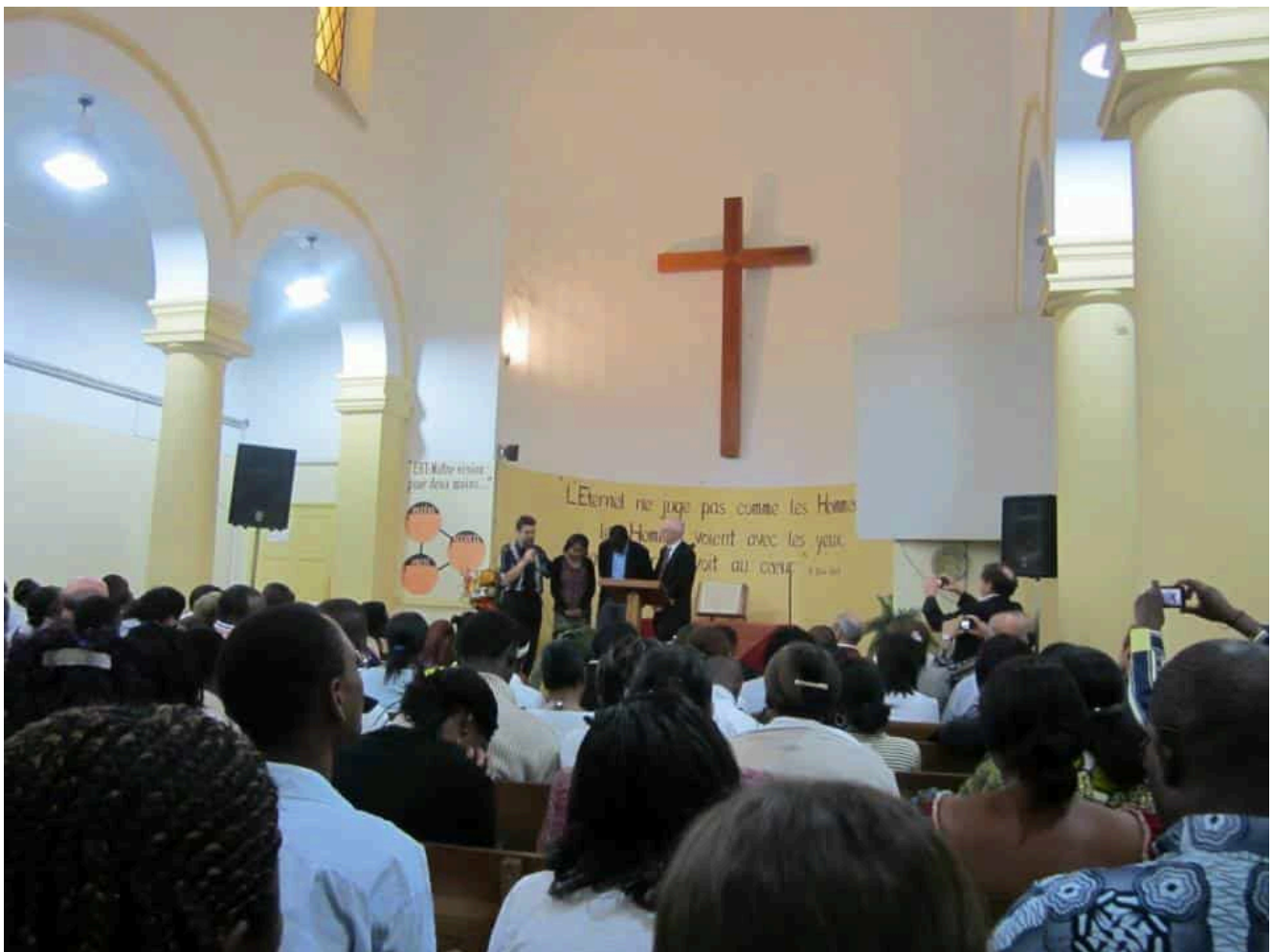
Un culte de l'Église Réformée de Tunisie

jasmin », en 2011, a provoqué le départ du président Zine el-Abidine Ben Ali et servi de facteur déclencheur au « printemps arabe », elle s'est aussi traduite par une décennie de croissance perdue dans une économie multipliant les facteurs de blocage et incapable de se réformer : entre 2011 et 2019, la croissance du produit intérieur brut est tombée à 1,7% en moyenne. Avec la guerre en Ukraine et la hausse des coûts de l'énergie, le pays peine désormais à boucler son budget et attend du Fonds monétaire international un prêt de 1,9 milliard de dollars, en échange d'un programme de réformes économiques drastiques.