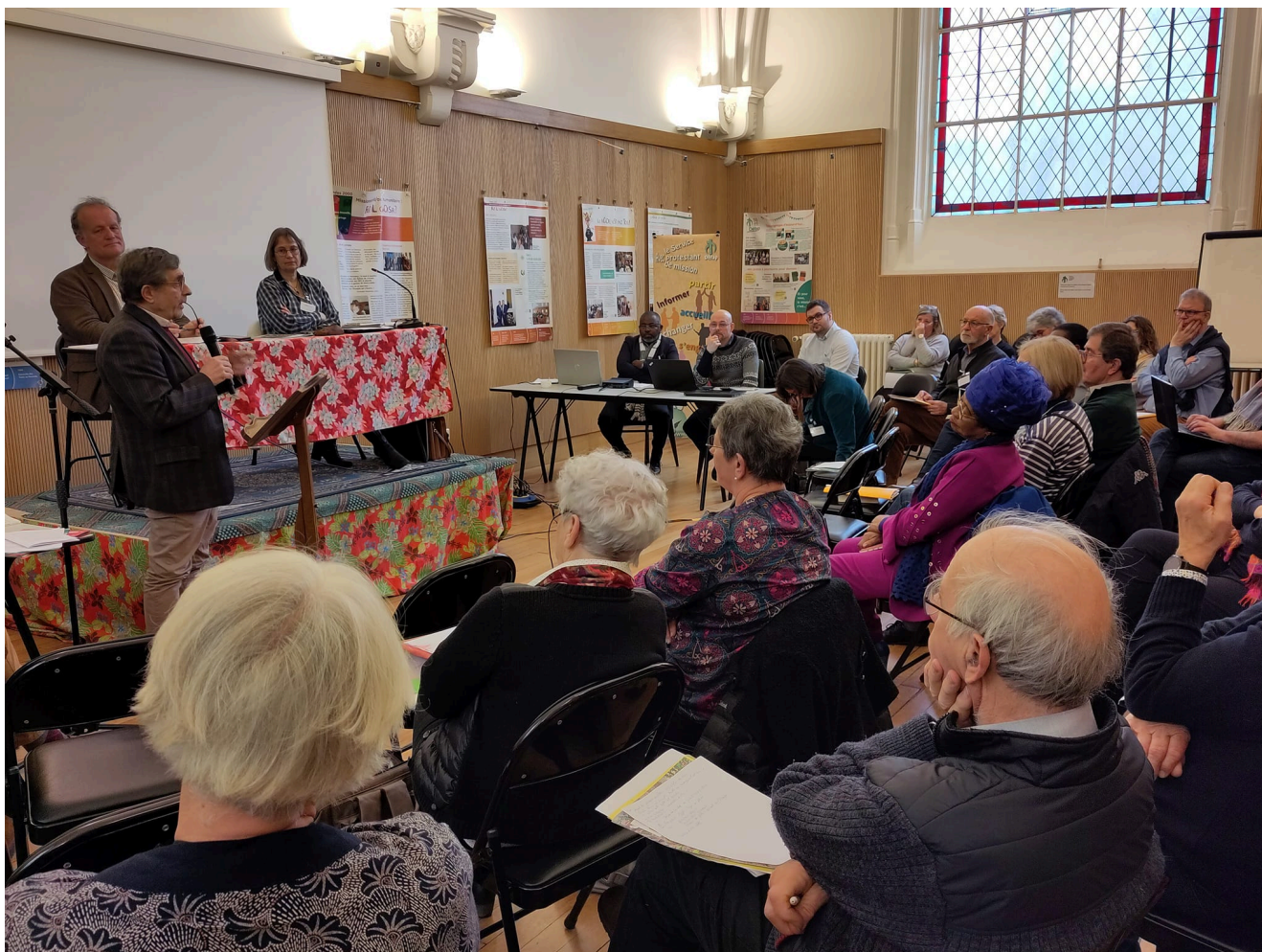
Vue de l'AG 2023 du Défap

ou boursière en congé recherche en France. Elle sera enfin l'occasion de se joindre à DM, l'homologue suisse du Défap, dans les célébrations de ses 60 ans.