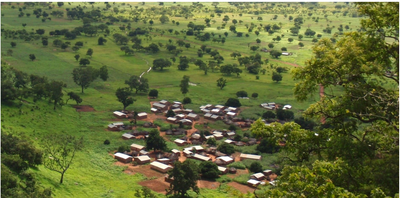
Vue d'un village au Bénin

Pour lutter contre le changement climatique, chaque geste compte. C'est valable pour les organisations humaines, États, entreprises, ONG, Églises ; c'est valable pour les individus. Le Défap a ainsi mis en place une stratégie ambitieuse de réduction de ses émissions de CO2 et de compensation carbone. Et vous, que ferez-vous pour le climat ? Pourquoi ne pas vous associer aux projets portés par le Défap par un don, et contribuer ainsi à réduire votre propre empreinte carbone ? Vous pourrez par la même occasion vous engager pour plus de justice climatique, en finançant un projet bon pour l'environnement, et bon pour les populations concernées. Présentation avec Maëlle NKOT, notre Chargée de projets.