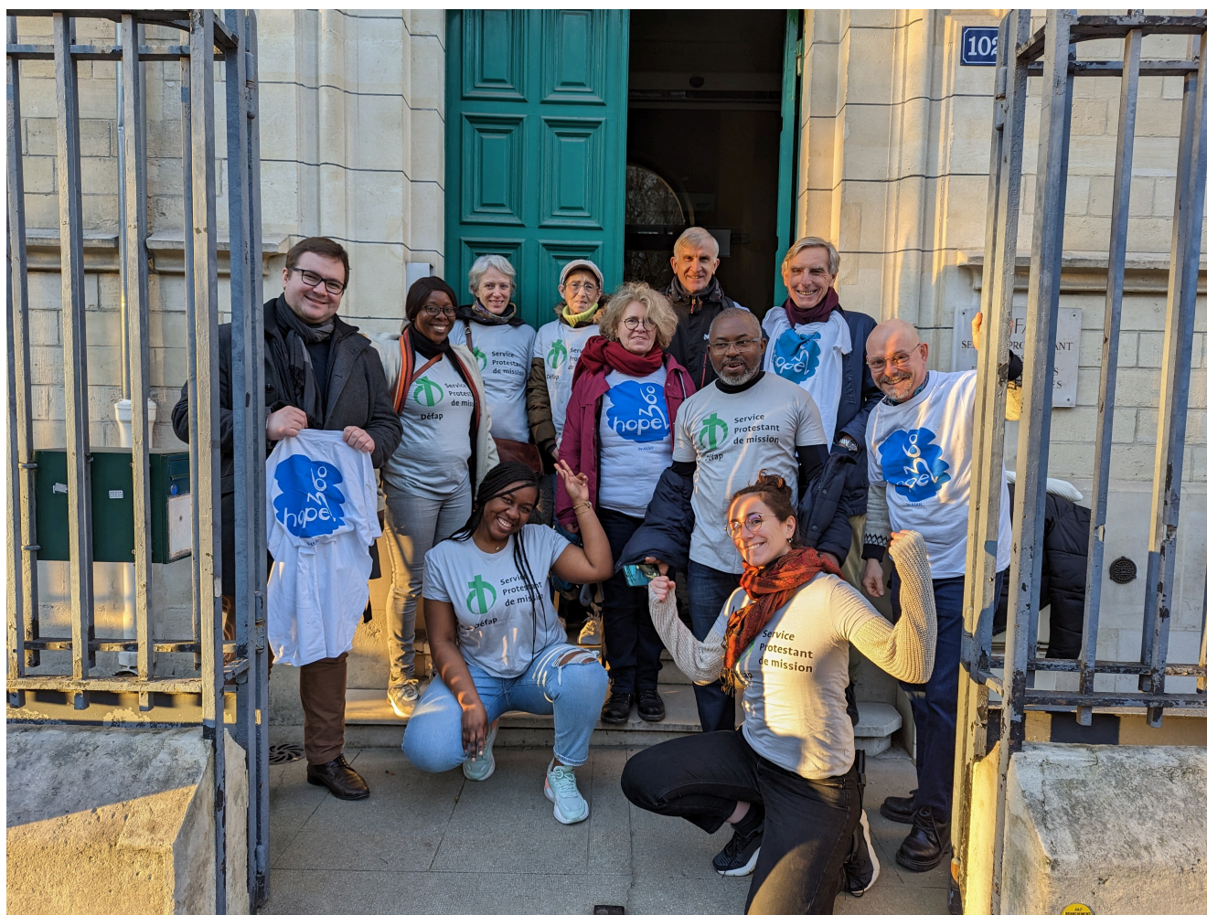
L'équipe du Défap au départ du 102 boulevard Arago, à Paris

L'équipe du Défap s'est mise en route, le 27 février, pour une randonnée en groupe à travers Paris destinée à engranger des kilomètres en faveur du projet présenté lors de l'édition 2023 de Hope 360. Destination : l'ambassade de Djibouti, lieu symbolique puisque c'est précisément à Djibouti que se situe le projet de formation à l'énergie solaire soutenu par le Défap. Venez nous rejoindre : où que vous soyez, vous pouvez, vous aussi, apporter votre soutien à ce projet... et aider, collectivement, tous les « hopeurs » à totaliser la distance Terre-Lune !