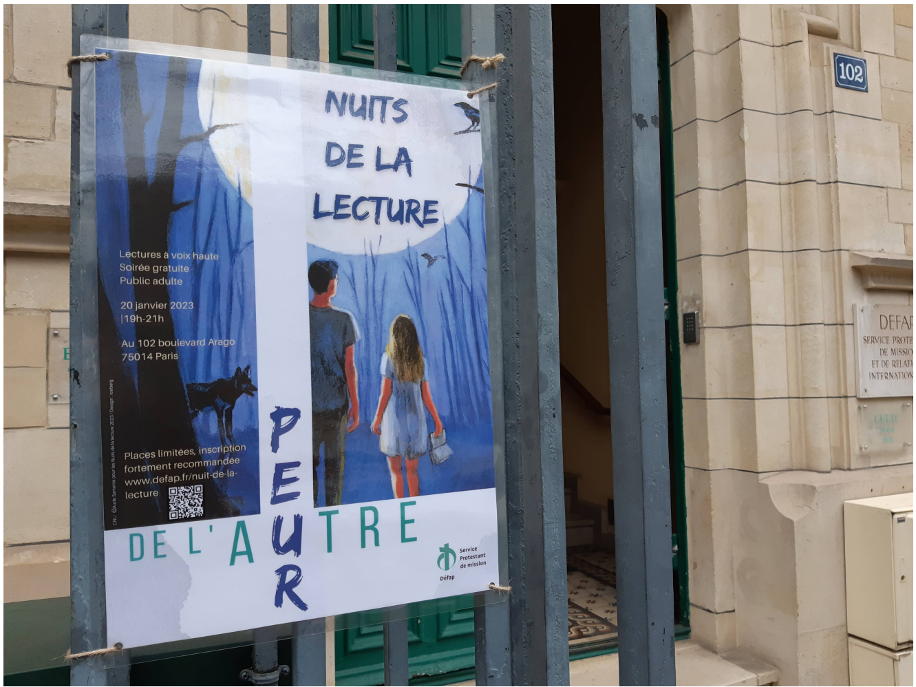
« Nuits de la lecture » : l'affiche à l'entrée du Défap, au 102 boulevard Arago