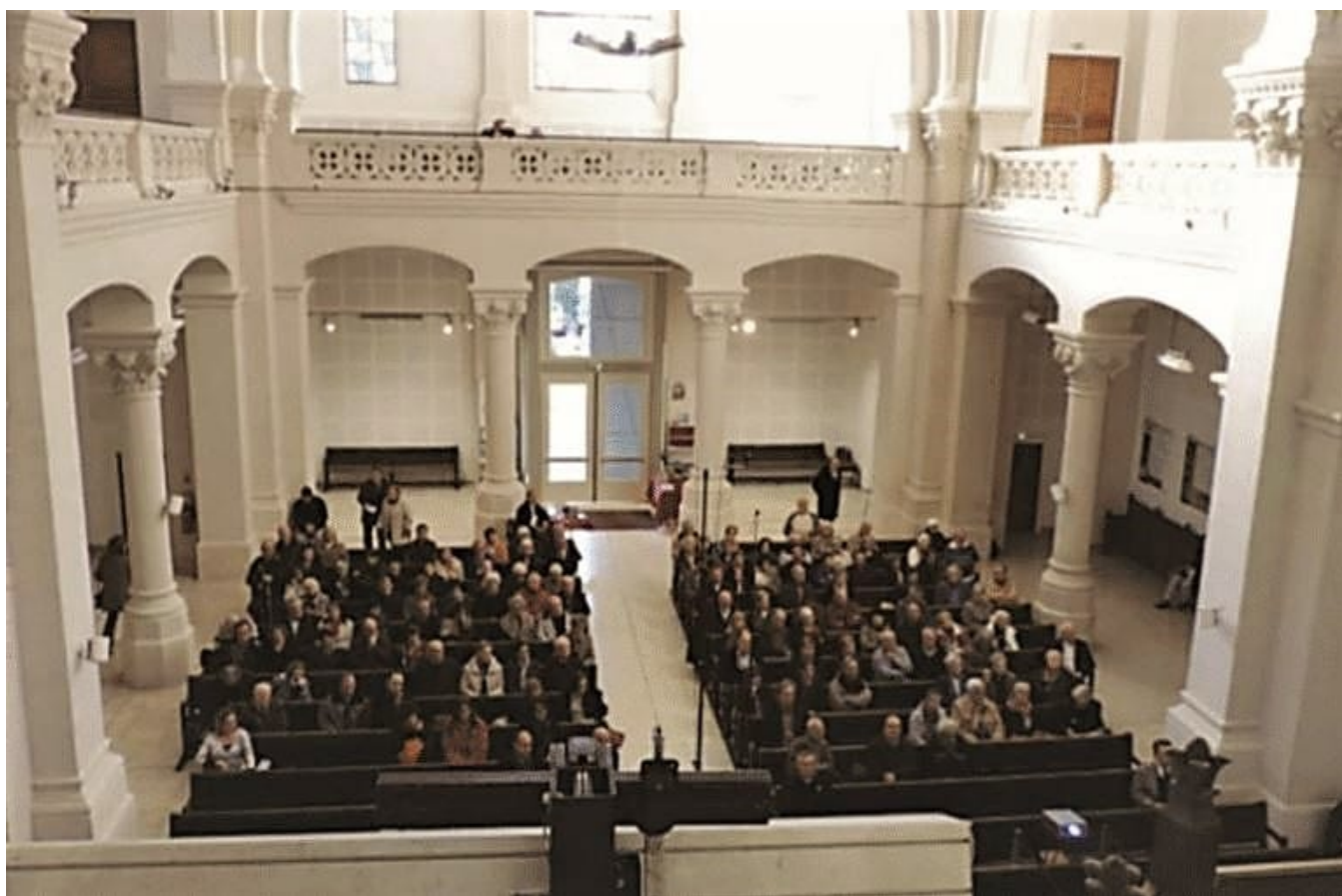
Le temple d'Alès, où se tiendra le synode national de l'Unepref