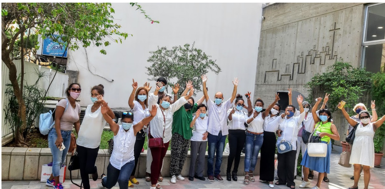
Membres de la paroisse protestante francophone de Beyrouth

Dans un contexte de paupérisation galopante de la société libanaise, elles font vraiment partie des «pauvres parmi les